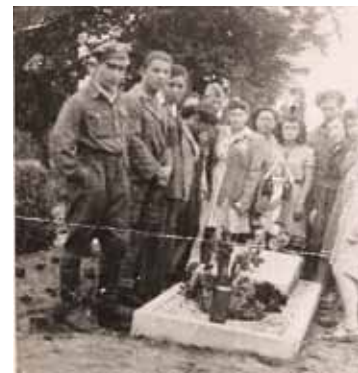
חברים על קברה של אלגרה