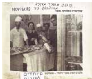
ממתקים מיוחדים לפורים מקונדיטוריה בשאלוניקי בשנת 1935