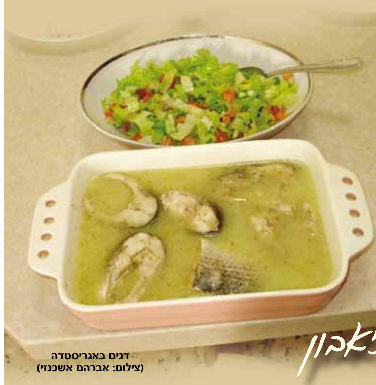
דגים באגריסטדה