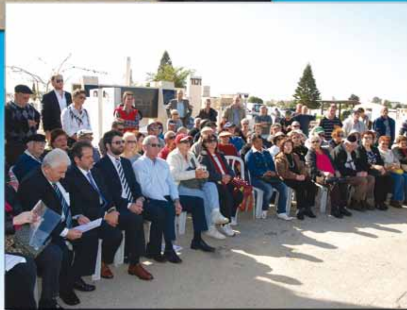
קהל בטקס חנוכת הגלעד בבית העלמין בחולון