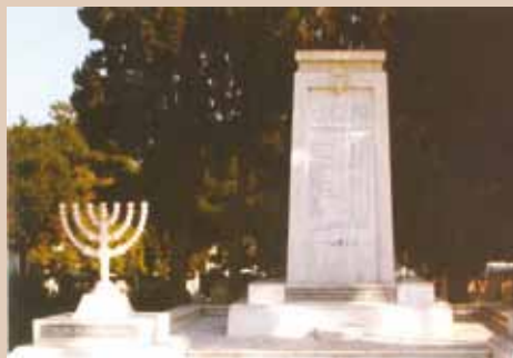
בית העלמין החדש באתונה

שיקום של קהילת אתונה החלה מיד המלחמה. מדו"ח מיום 31 בינואר 1945, נובע שהיו בה אז 3,640 יהודים, מוסתרים שיצאו ממחבואם, אנשי מחותרת וניצולים ממחנות ההשמדה והריכוז. כיום קהילת אתונה היא הגדולה מבין קהילות יוון.