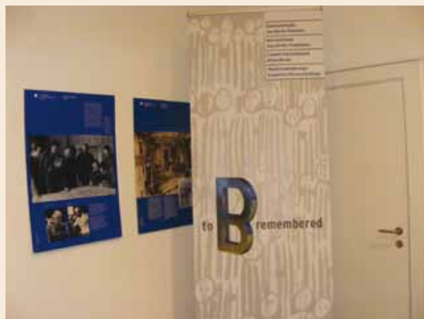
מל הועד הבינלאומי של אסירי אושוויץ

האתני. מבניין זה יצא גנרל פון שטאופנברג עם הפצצה בתיקו למקום שבו נמצא היטלר במטרה להרוג, אך נתפס והוצא להורג. בבניין זה שמעה בשנת 1933 פקידה בחדר הסמוך שבו קיים היטלר דיון, על כל התוכניות לכיבוש פולין, רוסיה והשמדת העם היהודי, והעבירה את הידיעה בצינורות של המחתרות לרוסיה, אך אף אחד לא האמין.