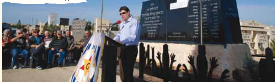
ח"כ אופיר אקוניס נושא דברים בטקס