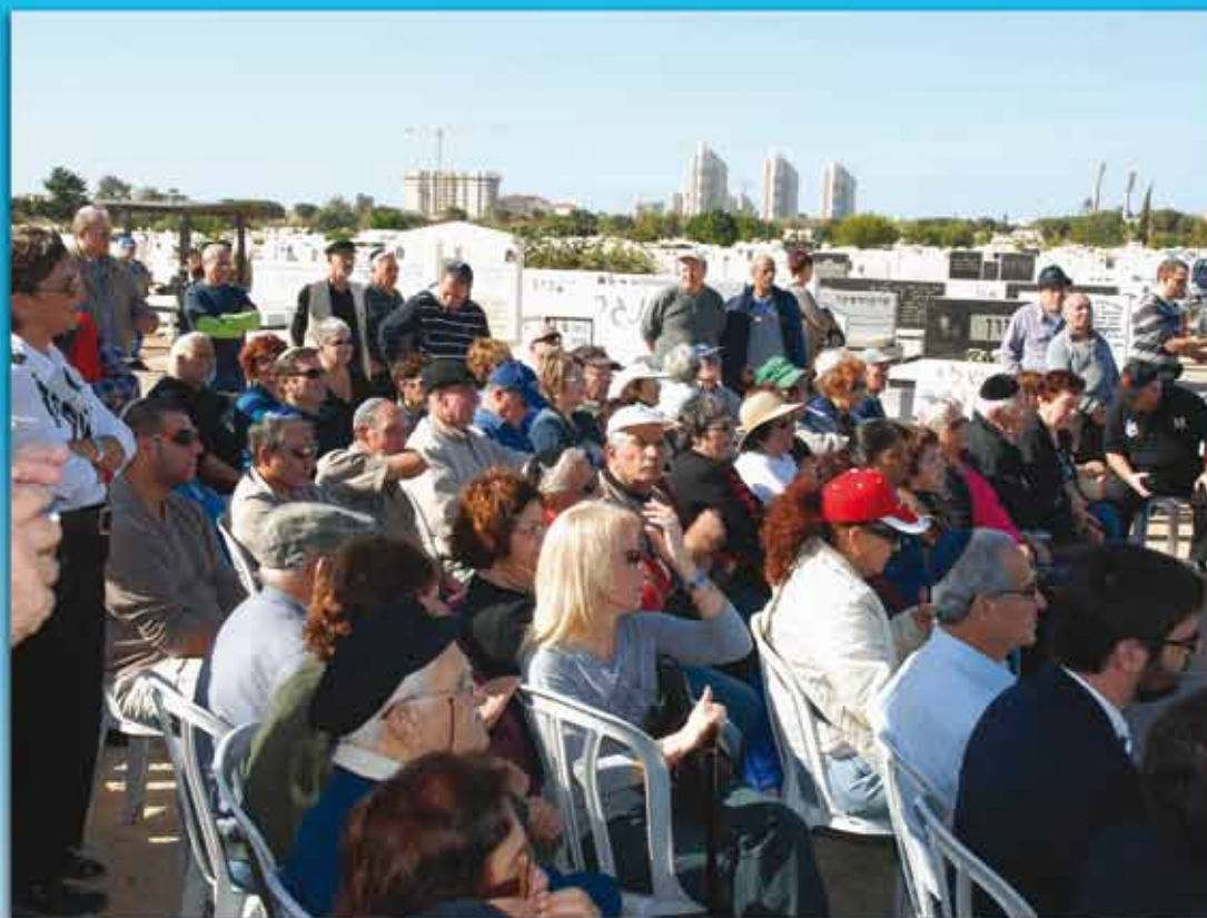
קהל בטקס חנוכת הגלעד