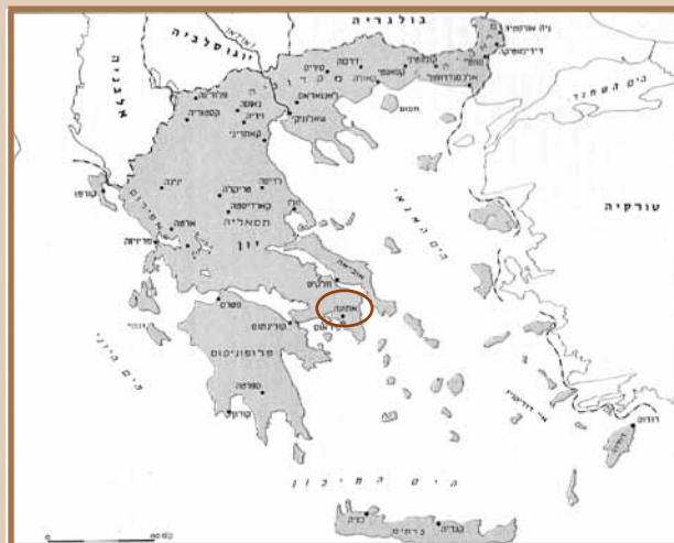
מפת קהילות יוון

אתונה, בירת יוון, שוכנת במחוז אטיקה על רמה מוקפת ערים. בעת העתיקה, לאחר סיום מלחמות יוון-פרס בשנת 480 לפני הספירה, תפסה אתונה את ההגמוניה בחלק המזרחי של המזרח של הים התיכון והפכה להפכה לאחת מערי המסחר החשובות. בתקופה זו, ראשיתה של הקהילה היהודית בעיר זו. לאחר כינון ממלכת החשמונאים במחצית השנייה של המאה השנייה לפני הספירה, קשרו ראשיה קשרים הדוקים עם אתונה. יהודים התיישבו בה במאה הראשונה שלפני הספירה ובעיקר במאה הראשונה למנינם. במכתב של אגריפס הראשון אל קיוס קליגולה הוא מזכיר יהודים שגרו בעיר זאת וגם ידוע ביקורו של השליח פאולוס בבית הכנסת של העיר. מן המאות 1 - 3 נמצאו במקום לוחות שיש ומצבות שחרותים בהם לולב ומנורת בעלת שבעה קנים, וכן מצבות עם שמות יהודיים. במאה ה-4 נחרבה אתונה, ואין ידיעות על יהודים בה במשך דורות רבים.