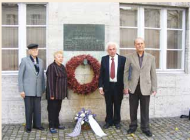
נציגים מיוון ומישראל ליד הלוח לזכרם של קולונל פון שטאופנברג ושותפיו שנרצחו בידי הנאצים