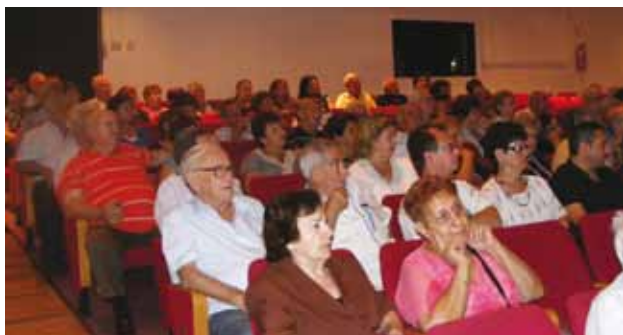
הקהל בכנס התרבות וההסברה בתיאטרון חולון

פרצו מאורעות 1936. עד 1931 יעדי ההגירה של יהודי שאלונקי היו ארה"ב, ספרד, איטליה ודרום אמריקה. באותה שנה נפתחו שערי ארץ ישראל. מי שיכול היה להגר, היגר. רחובות שלמים התרוקנו, עסקים נסגרו, מחירי הנדל"ן ירדו. במקביל גדל הישוב בארץ ישראל מ-75,000 ל-450,000 איש, ביניהם 10,000 עולים משאלונקי. המשבר הכלכלי באירופה החמיר, נמל שאלונקי הפחית פעילותו לעומת נמל פיראוס שפרח. ב-1932 התקיימו בארץ ישראל שני אירועים כינוס המכבייה ויריד המזרח. שאלונקאים רבים הגיעו לאירועים אלה ונשארו בארץ כעולים בלתי לגאליים. אבא חושי הגיע לשאלונקי לראיין סבלים כדי להביאם לעבודה בנמל חיפה. הייתה זו תקופה שאפשר היה לקבל סרטיפיקטים לקטיף תפוזים.