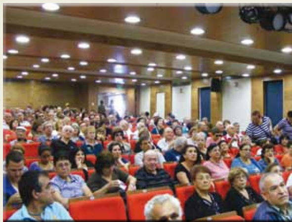
חברי הארגון באודיטוריום של קיבוץ לוחמי הגטאות

אכן משפט אייכמן היווה נקודת מפנה מכוננת, השיחה הערנית של רב הנוכחים באולם, הייתה מרגשת ומלאה באווירת הזדהות עם הסיפורים האישיים שהועלו.