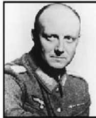
טרסקו הנינג פון