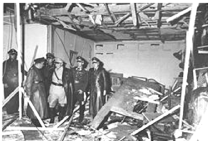
מאורת הזאב זמן קצר לאחר ההתפוצצות

שטאופנברג הנהן לפלגיבל וזה נכנס לבניין המשרדים שלו כדי להודיע לשותפים בברלין להפעיל את מנגנון המרד שהוכן מראש, בעוד הוא מנתק את "מאורת הזאב" מן העולם. גם לשטאופנברג ציפה יום ארוך, הוא השליך את הסיגריה הבושרת, נכנס למכונית ויצא לדרך.