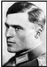
שטאופנברג קלאוס פון