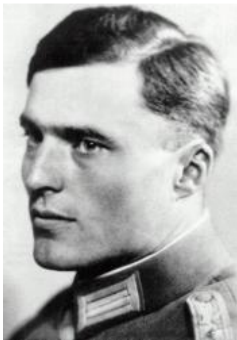
הרוזן קלאוס שנק פון שטאופנברג

באוגוסט 1943 נפגש טרסקו לראשונה עם קצין מטה צעיר, הקולונל רוזן קלאוס שנק פון שטאופנברג. שטאופנברג נולד בשטוטגרט כבן שלישי מתוך ארבעה לאחת המשפחות האציליות והמוערכות במדינת וירטמברג (כיום באדן-וירטמברג) שבדרום גרמניה. הוריו היו האובר-הופמארשלים האחרונים של ממלכת וירטמברג. בית שטאופנברג היה דתי ותרבותי מאוד, האם גידלה את ילדיה לאדיקות נוצרית מצד אחד ולאהבת שירה, אמנויות ומוזיקה מצד אחר. חבריו מתקופת בית הספר זכרו אותו בתור ילד חיוור וחולני שנעדר תקופות ארוכות מהלימודים. דווקא בשל כך השקיע מאמצים רבים בניסיון לפתח את כושרו הגופני, עם התבגרותו והתפתחותו הגופנית והמנטלית זכה למעמד מיוחד בין בני גילו, בקרב חבריו בבית הספר הצטייר קלאוס בן השבע עשרה כמנהיג כריזמטי. בשנת 1926 התגייס שטאופנברג לרגימנט המשפחתי בבמברג (ה"ריטר אוג'ד קבאלרי רגימנט מספר 17" - רגימנט חיל פרשים מובחר). ב-1933