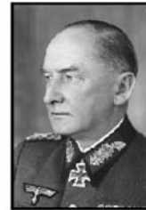
וויצרבך אירוויין פון