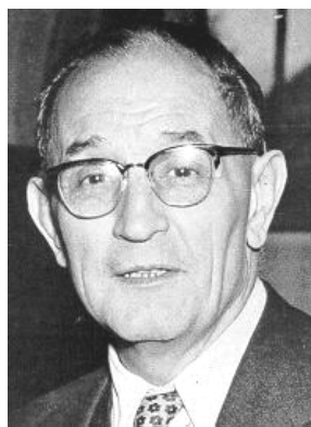
הכומר מרטין נימולר

זרם נוסף היה התנגדותם של יחידים וקבוצות מאנשי הכנסייה , קתולים