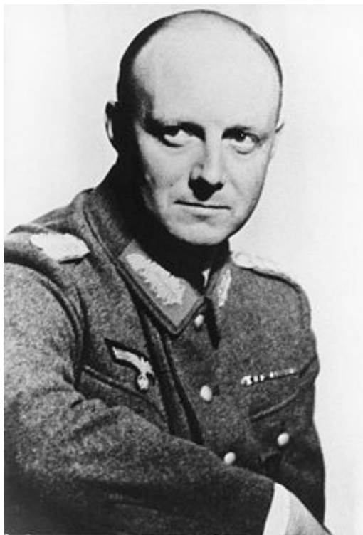
הגנרל פון טרסקו