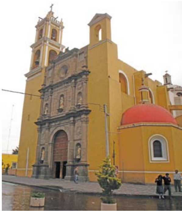
SAN LUIS OBISPO DE TOLOSA, HUAMANTLA