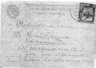
fol. 2, 3, i 4

Druga kartka (fol.2), tego samego nadawcy, wysłana do tego samego odbiorcy, nadana została w Starobielsku 24 maja 1941. Nadawcą obu kartek jest oficer rezerwy Wojska Polskiego. Z treści kartki z 24.05.1941 r. wynika,