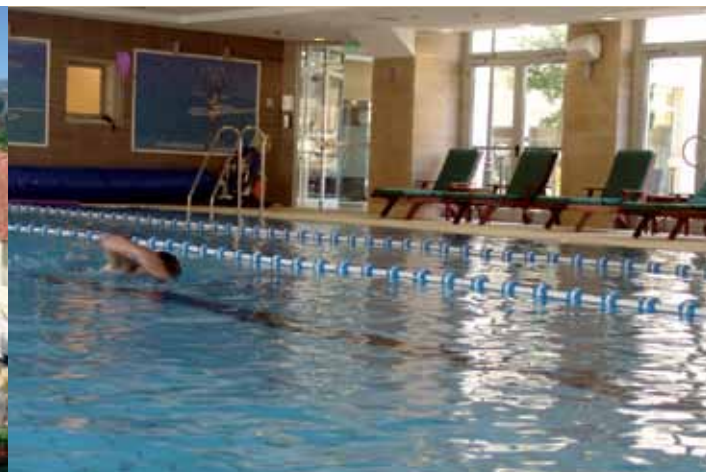
אחוזת בית הכרם - ירושלים

צוות אחוזות רובינשטיין מתכבד להזמין אתכם לבוקר מהנה עם הרצאה, קפה ומאפה