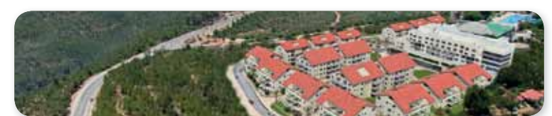
*ההטבה במסגרת ההבנות עם הנהלת הארגון.