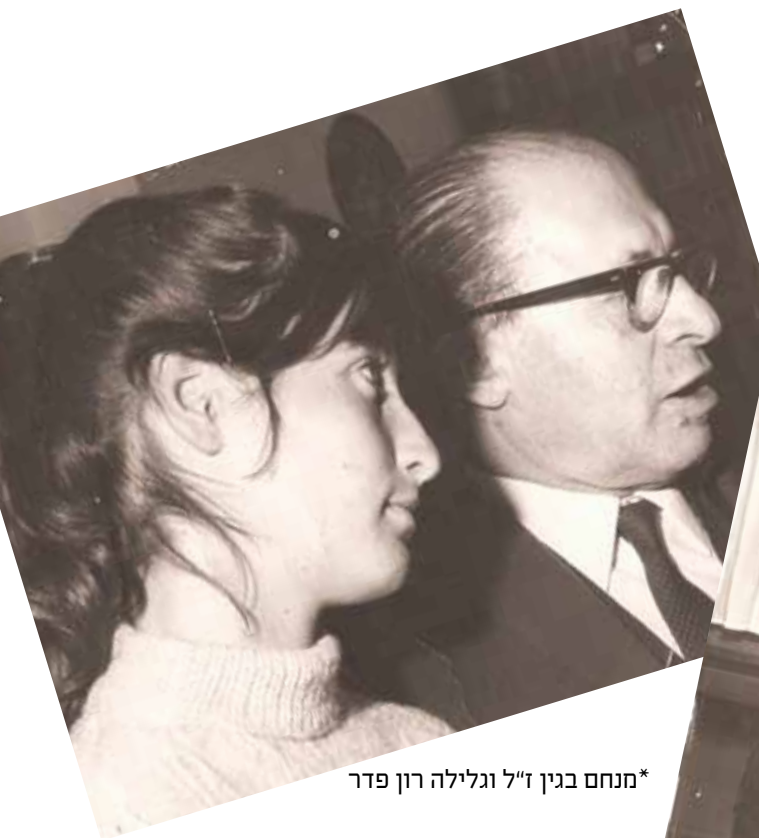
*מנחם בגין ז"ל וגלילה רון פדר

"מעבר לזה שנכדו יהונתן בגין נפל בתאונת מטוס בצבא בגין ראה עצמו תמיד כמפקד שכול. אני חושבת שבגין הרגיש עצמו מעין אב שכול מהיום שהוא התמנה למפקד האצ"ל. האנשים שהוא איבד בדרך היו לו כבנים. הוא הרגיש עצמו ממש אב שכול. לא בכדי הוא ביקש להיקבר בקבר ליד קבר פיינטיין וברזני שניהם מעולי הגרדום. מהיום שהוא היה מפקד בגין הרגיש את עצמו אב שכול. כל הנופלים במלחמת לבנון זה אחד הדברים ששבר אותו. הוא היה אדם רגיש ומיוחד. הספר בעוז והדר מסכם בשתי מילים את האיש המיוחד הזה שהיה למנהיג ייחודי בנוף המנהיגות העולמית".