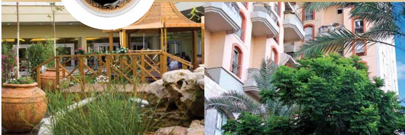
אחוזת צהלה - תל אביב