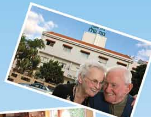
עם נסיון מעל 25 שנים