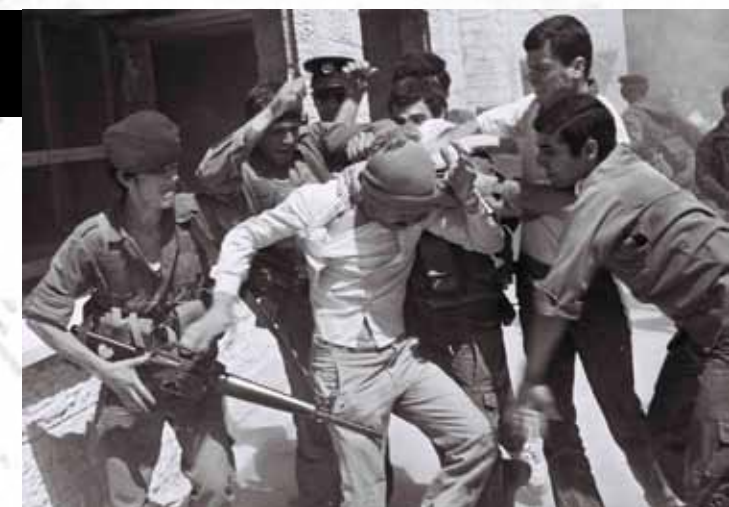
התמונה צולמה ב- 2/4/1984, על ידי צלם מעריב יוסי זמיר ומבעלי סוכנות צילום פלאש 90.

בברכת חג פסח שמח אלי בן שם יור ארגון יד לבנים.