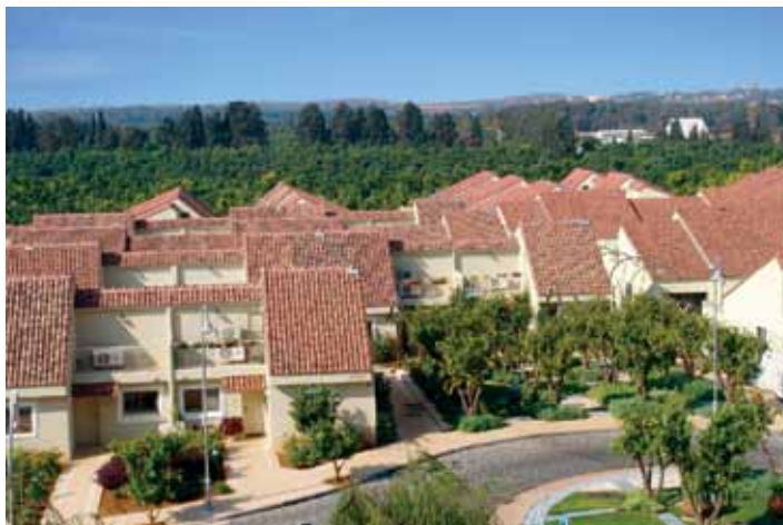
אחוזת פולג - קיבוץ תל יצחק

ביטאון ה-20 של ארגון יד לבנים המוגש לכם, המשפחות השכולות, הינו פרי עבודה מאומצת של החודשים האחרונים. כפי שתבחינו, הביטאון עבר שינוי ברמת התוכן, העריכה ואופן ההגשה. ארגון יד לבנים קיבל החלטה הרואה חשיבות רבה בטיפול הקשר של המשפחות השכולות לנעשה בארגון, באמצעות הביטאון שיראה אור אחת לרבעון, באופן קבוע. בכוונתי להוביל יחד עם חברי המערכת קו חדש, הרואה את הביטאון כשחקן מרכזי במדיה והתקשורת בישראל. בכוונתי לפתוח את הביטאון לזירה בה נפגשים ומתכתבים על גבי נייר העיתון, אנשי רוח, תרבות וספר, לצד דמויות מפתח בהנהגה הישראלית ובארגון יד לבנים. אני ארצה לפתח גאווה יחידה בעיתון שלכם. עיתון ששייך לכם ויבטא את הלכי הרוח והמדיניות של הארגון והמשפחות. גם בעיתון הזה הקמנו מדורים נפרדים, כמו "התחנה הצבאית", מדור "אחד על אחד" בה מראיין יו"ר הארגון דמות מפתח, מדור המיועד לגיל ה-3, מדור צרכני