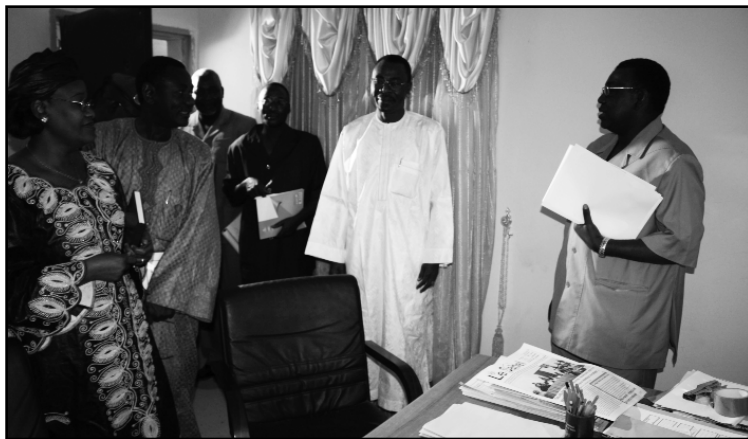
Le ministre lors de sa visite

Parmi ces problèmes devait-il ajouter, il y a celui de 3 ème cycle lié entre autres aux difficultés en terme de reconduction de bourses et de la prise en compte du système LMD, et aux difficultés d'inscription surtout à l'Université de Niamey, où les frais d'inscription au 3 ème cycle sont particulièrement élevés. « Ces difficultés ont été aussi exposées à la mission que j'ai conduite récemment au Maroc. Je considère que ce sont des questions prioritaires. A l'issue de la présente visite, j'ai invité le directeur général de l'ANAB à une réunion à mon cabinet, cet après-midi, pour nous permettre d'avoir ensemble une vision plus claire de cette problématique », a ajouté le ministre. Il devait indiquer qu'il y'a des questions structurelles qui ne peuvent être réglées instantanément puisqu'elles nécessitent un travail en terme de refonte des textes. Il a ajouté qu'il y'a