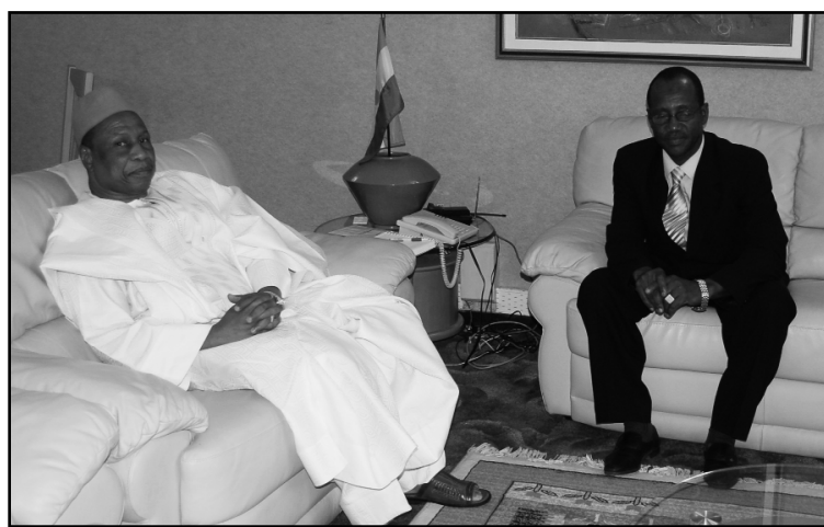
Le Premier ministre avec le directeur général de l'Autorité du Liptako Gourma

bénéficié de la part de SEM. Mahamadou Danda, d'utiles conseils pour conduire l'organisation commune, et surtout, des remarques pertinentes en ce qui concerne l'engagement des nouvelles autorités nigériennes pour accompagner ce qui marche, que ce soit au niveau national ou international, et leur disponibilité à faire en sorte que les actions que mène l'Autorité, aussi bien au niveau national qu'inter-étatique, soient porteuses pour les populations des trois pays.