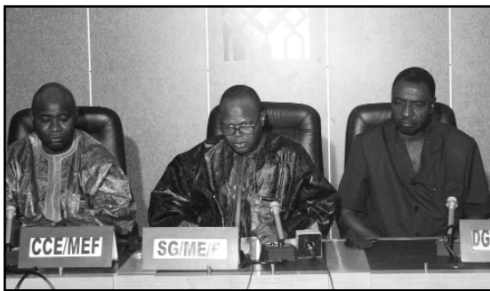
Une vue de la table de séance à l'ouverture de l'atelier

et des Finances. L'opération d'inventaire des systèmes financiers décentralisés s'est déroulée du 1 er juillet au 30 novembre 2006 à l'initiative du Ministère de l'Economie et des Finances (MEF). Depuis quelques années, l'on a assisté à une floraison de systèmes financiers décentralisés (SFD) et d'établissements de micro finance au Niger. Environ 167 structures, exerçant de manière formelle, ont été répertoriées. Il faut ajouter à celles-ci, d'autres qui interviennent de manière non formelle comme les