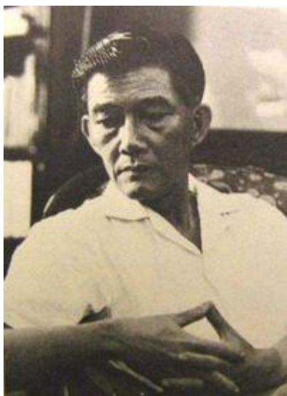
Ngô Đình Nhu (1911-1963)

- Thắng rồi! Thừa Cụ, thừa ông cố vấn, quân ta chiếm được Đại bản doanh Bảy Viễn rồi.