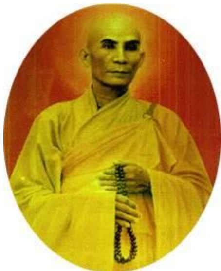
Đại đức Thích Quảng Đức