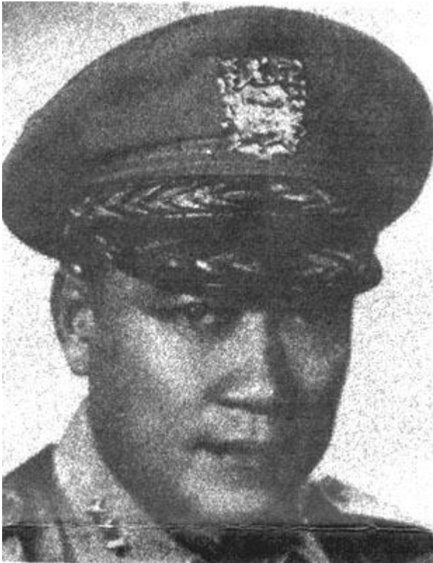
Trung tướng Trần Văn Đôn

Tướng Đôn nhìn thẳng vào mặt tướng Đính: