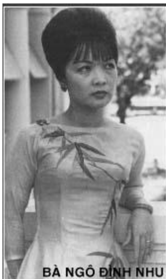
BÀ NGÔ ĐÌNH NHU