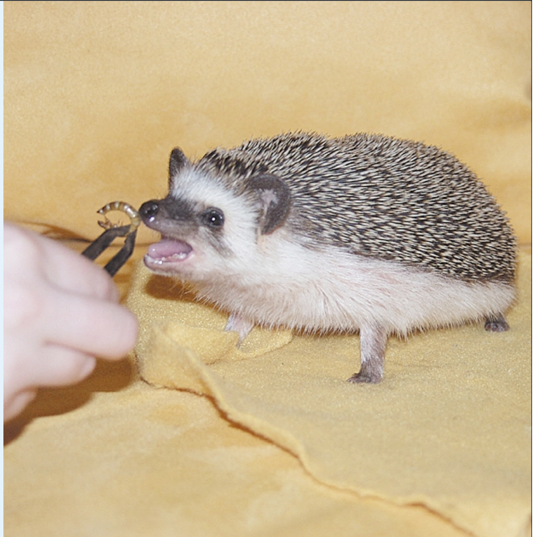
Siili tarvitsee päivittäin yhteensä noin 20 grammaa ravintoa. Siitä 60-80 % tulisi täyttyä hyönteisistä ja loput muusta ruoasta.