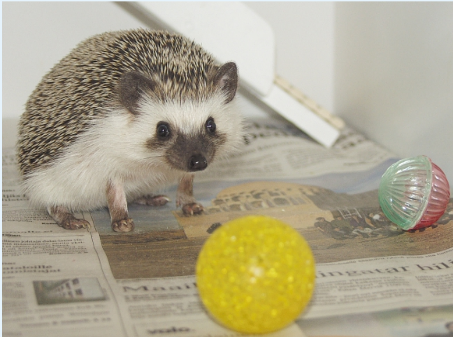
Shanyn viisaat ,kirkaat silmät eivät jätä ketään kylmäksi.