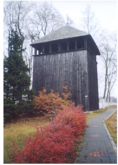
Kościół parafialny p.w. Św. Wawrzyńca z 1848 r. oraz drewniana dzwonnica z 1725 r.