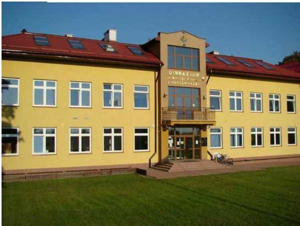
Obiekt Publicznego Gimnazjum w Karczmiskach im. Mikołaja Kopernika wybudowano w 2003 r.