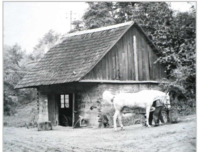
Zawód kowala i stare kuźnie przeszły już do historii Karczmisk.