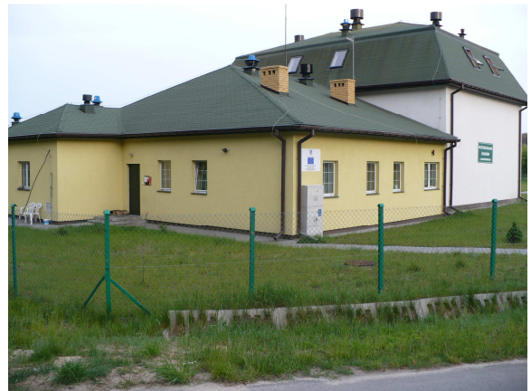
Oczyszczalnia ścieków Karczmiskach z 2004 r.