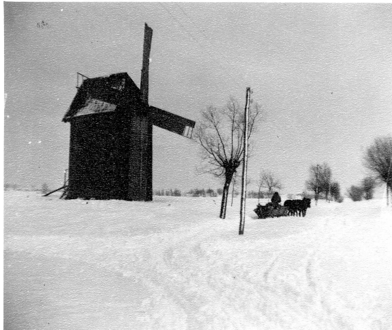
Zimy w Karczmiskach w okresie międzywojennym były mroźne i śnieżne. Charakterystyczny wiatrak oraz sanie ciągnięte przez konie.