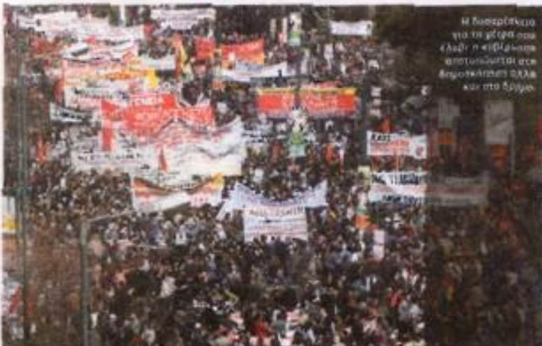
Η διασπάρση για τα μέτρα που ελάττ η κίβηματα αποτιμωμένα από τους πολίτες αλλά και στο βόρειο