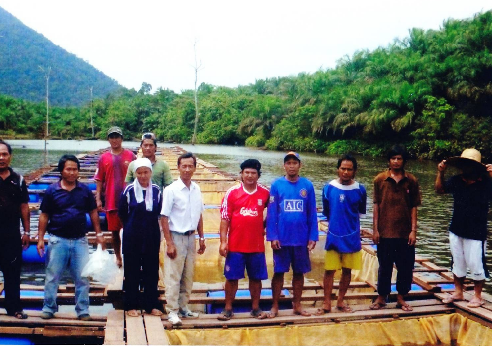
Peserta Projek – Kg. Tenaga Baru Tahun 2009