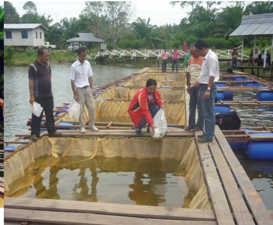
Pelepasan Benih Ikan Talapia ke Sangkar