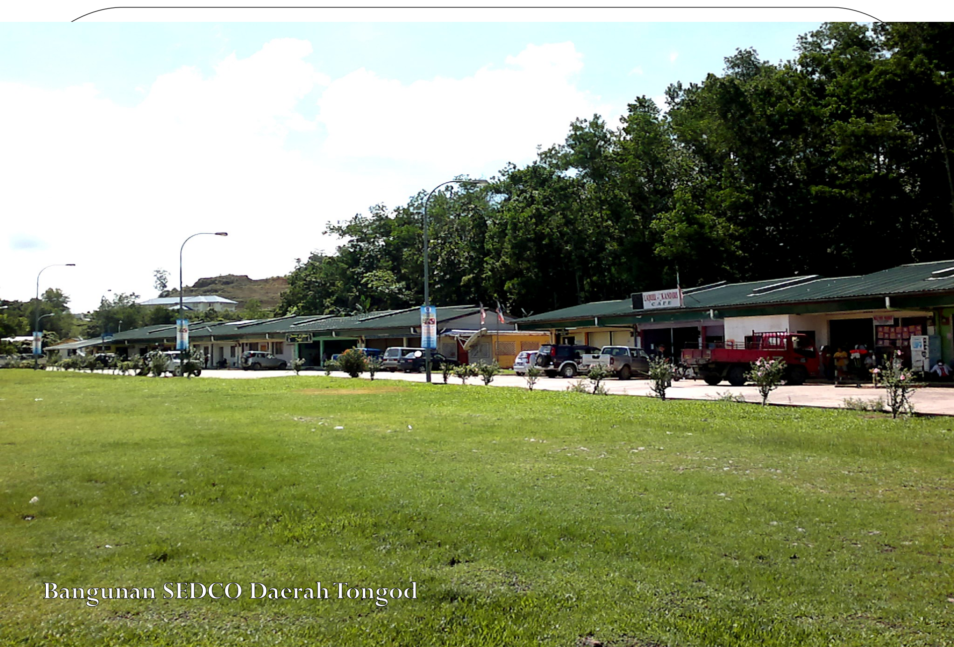
Bangunan SEDCO Daerah Tongod