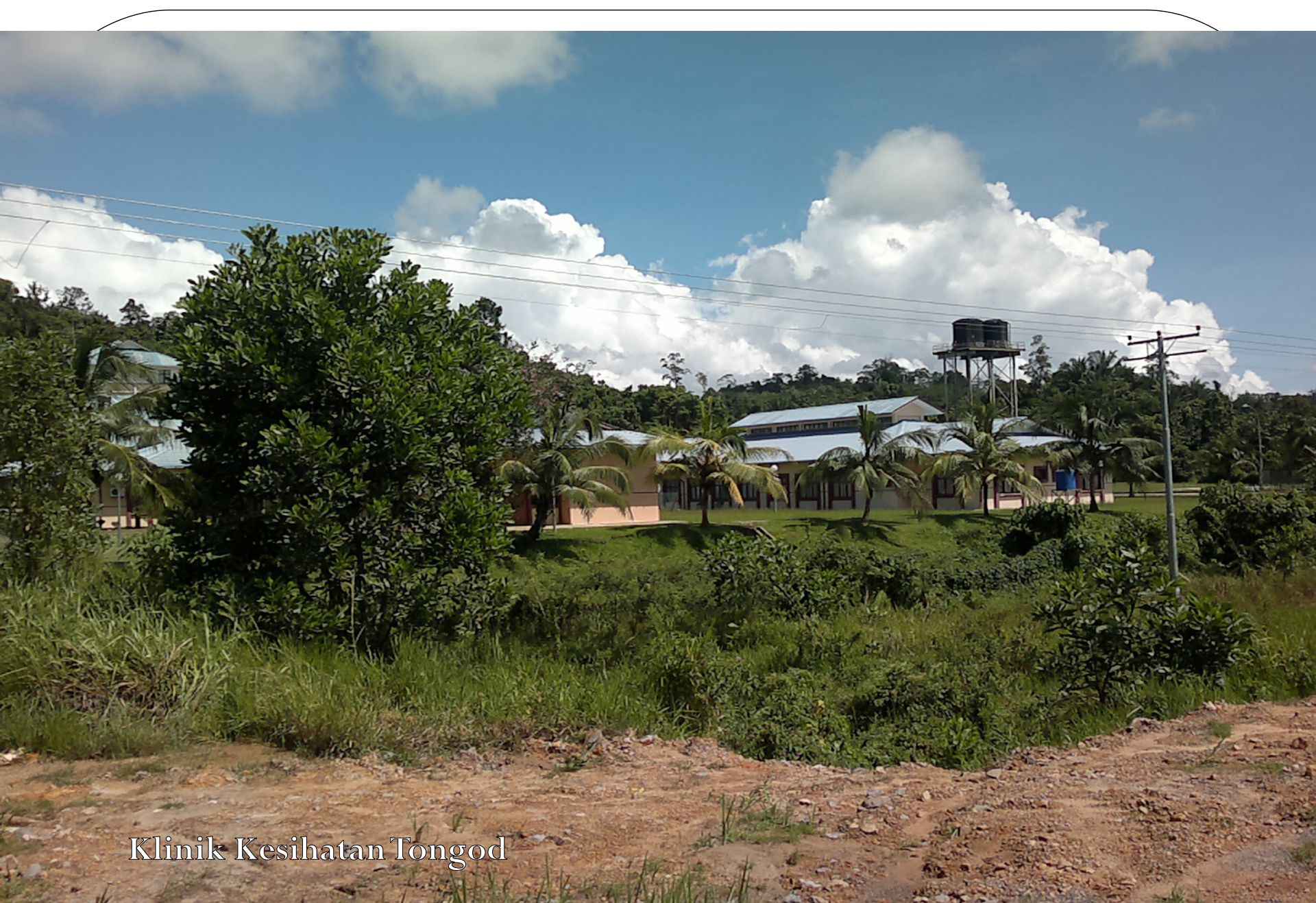
Klinik Kesehatan Tongod