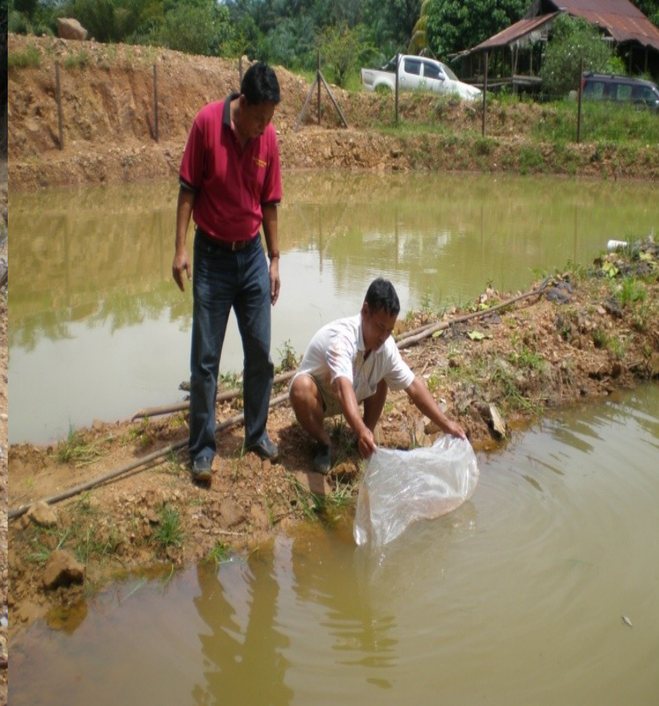
PROJEK KOLAM TAHUN 2007- PELEPASAN BENIH IKAN