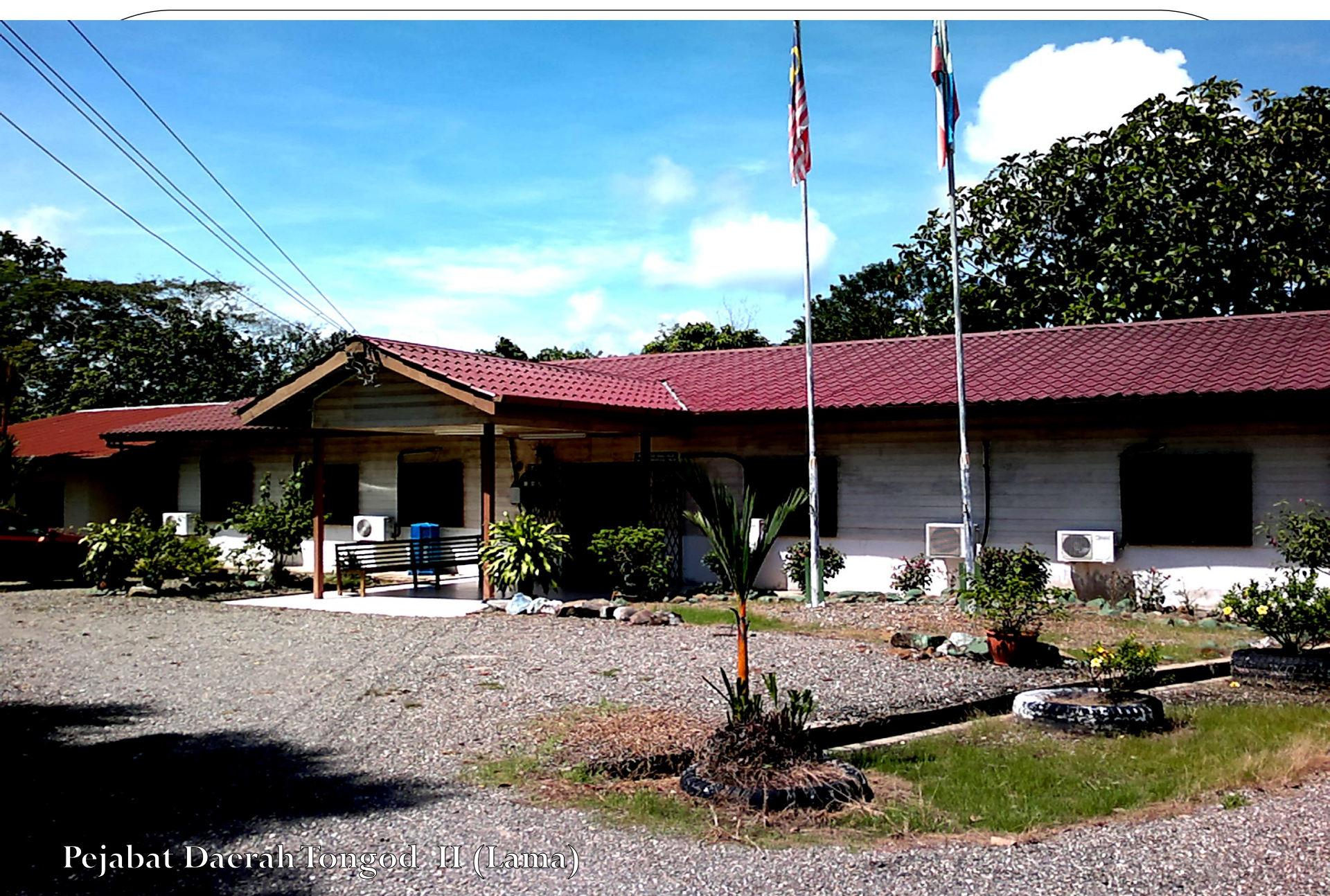
Pejabat Daerah Tongod II (Lama)