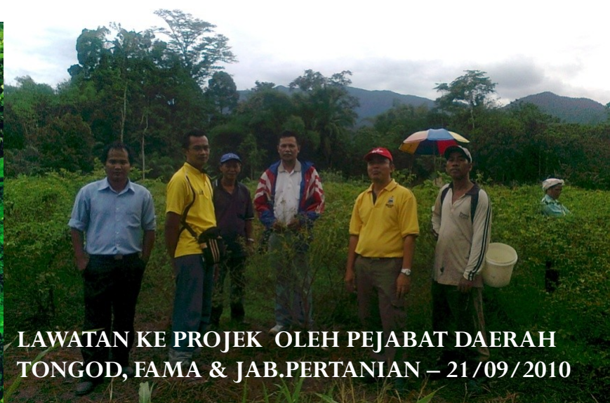
LAWATAN KE PROJEK OLEH PEJABAT DAERAH TONGOD, FAMA & JAB.PERTANIAN - 21/09/2010