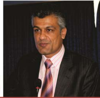
عبدالله احمدزی رئیس دارالانشاء کمیسیون مستقل انتخابات

کمیسیون مستقل انتخابات منحیث یک نهاد تازه تشکیل در ساختار دولت جمهوری اسلامی افغانستان، در جریان سال های گذشته توانسته است گام های اساسی را در زمینه نهادینه ساختن پروسه انتخابات و تعمیم فرهنگ آن در سطح کشور بردارد. راه طی شده در جریان سال های گذشته را میتوان منحیث نخستین گام ها در راستای تعمیم فرهنگ دیموکراسی در کشور تلقی نمود و باید به خاطر داشت که افغانستان بعد از سه ده جنگ، که باعث تضعیف ادارات دولتی، اقتصاد کشور و از همه مهمتر پائین بودن سطح سواد گردیده است، هنوز هم به سالیان متمادی و تلاش های متداوم ملی و بین المللی جهت تحکیم پایه های حکومتداری و نظام سازی دارد.