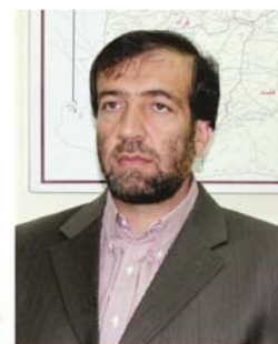
قضاوتپوه فضل احمد معنوی رئیس کمیسیون مستقل انتخابات

انجام هر کاری که انتظار پیروزی و موفقیت در فرجام آن را داشته باشیم نیازمند یک پلان و برنامه‌ی مدون و طراحی شده‌ای از پیش است، که انتخابات به دور از این قاعده بوده نمی‌تواند. این یک موفقیت بزرگ است که توفیق آن را یافته‌ایم تا پلان استراتژیک پنج ساله‌ی کمیسیون مستقل انتخابات را تدوین و بر مبنای آن امور مربوط انتخابات را یک پی‌دیگری عملی‌سازیم و بتوانیم آرزوی‌های دیرینه مردم را که داشتن یک نظام قانونی و دیموکراتیک بر اساس تفکیک قوا از مجرای نهاد‌های انتخاباتی است، برآورده کنیم.