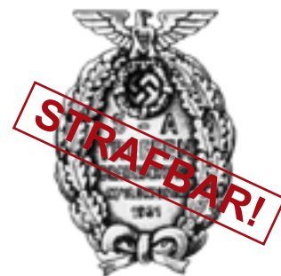
SA -Treffen Braunschweig 1931