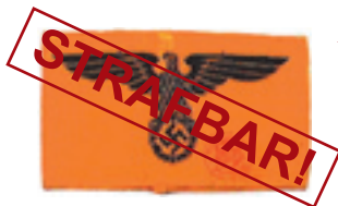
Armbinde mit Adler und Hakenkreuz