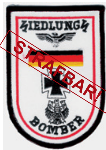
Abzeichen mit Sigrunen