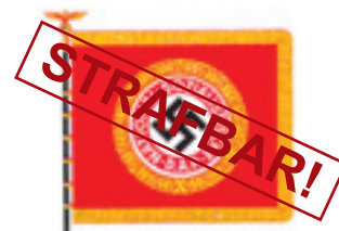
Fahne der alten Garde