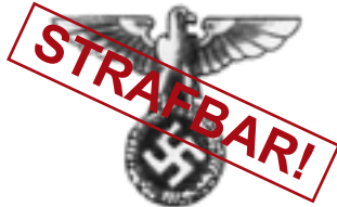
Hoheitszeichen (alte Ausführung)