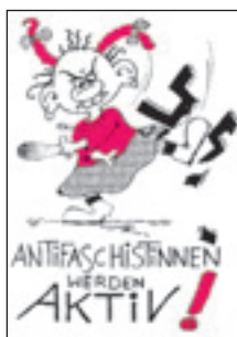
Ablehnung des Nationalsozialismus

Die Verwendung von unter §§ 86, 86a StGB fallenden Kennzeichen wird überwiegend dann als nicht strafbar angesehen, wenn der unbefangene Betrachter in der Art der Darstellung eine Ablehnung der NS-Ideologie erkennen kann. 25