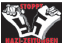
Ablehnung des Nationalsozialismus