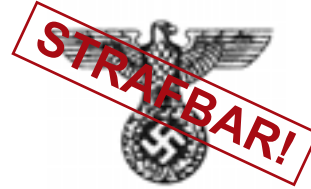
Hoheitszeichen (neue Ausführung)