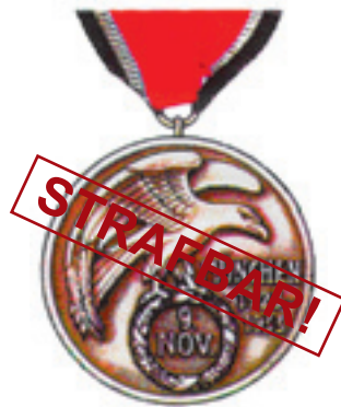
Abzeichen am Band vom 9. Nov. 1923 (Blutorden)