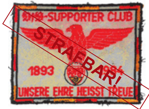
Fan-Abzeichen mit SS-Losung