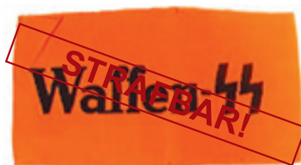
Armbinde der Waffen-SS