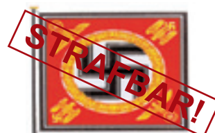
Standarte des Führers