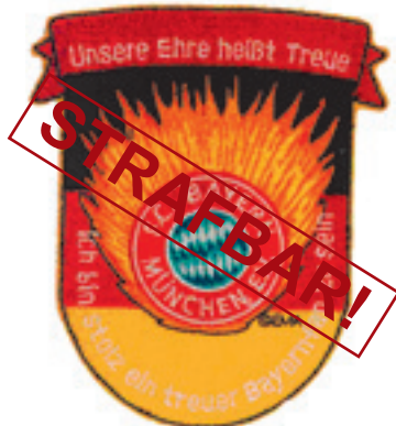
Fan-Abzeichen mit SS-Losung