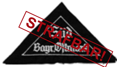
Gaubzeichen (2-zeilig silber)