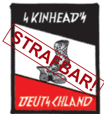
Skinhead-Abzeichen mit Sigrunen