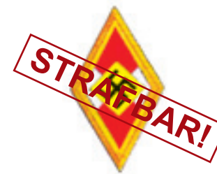
Ehrenzeichen der HJ