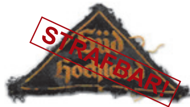
Gaubzeichen (2-zeilig gold)