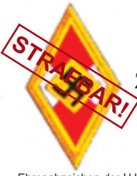
Ehrenabzeichen der HJ