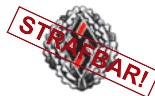
Ehrenzeichen des NSD-Studentenbundes