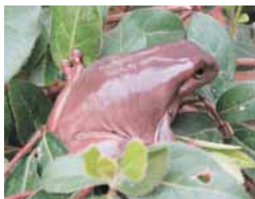
אילנית מצויה.

האילנית המצויה ( Hyla savignyi ) היא הקטנה ביותר בגודלה בקבוצת הדו-חיים הקיימים בארץ-ישראל ושייכת למשפחת האילניתיים. מצבה מוגדר כפגיע בלבד, אך עקב היעלמותן של שלוליות החורף וזיהום מקורות מים, מצבה עלול להחמיר בשנים הקרובות, והיא עלולה למצוא את עצמה ברשימת בעלי החיים הנמצאים בסכנת הכחדה. האילנית דומה לצפרדע, אך היא קטנה ועדינה יותר. האילנית ניכרת באצבעותיה מסתיימות בכפתורי הצמדה, המפרישים חומר דביק שבעזרתו היא נצמדת לעלים, גבעולים ואילנות - ומכאן שמה.