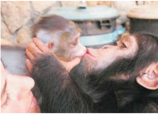
התמונה הזוכה בתחרות הצילום.

מהספארי סיפרה במושב חינוך על "ערב חלומי בגן החיות" ובאותו מושב, דיבר יהודה גת על מערכת החינוך החדשה בגן גורו. במושב טיפול ווטרינריה סיפר דניאל אבו חיר מגן החיות הלימודי חיפה על התערבות צוות הגן בקבוצת הבבונים. כחלק מרעיון החיבור בין גני החיות, התקיימה גם תערוכת צילום בנושא "יום בגן החיות". כל גן חיות הציג שלוש תמונות שתיארו את הקשר החזק בין העובדים והמבקרים ובין בעלי החיים. התמונות היפהפיות הטיבו לתאר את האהבה והמחויבות של העובדים למטרות גן החיות: טיפול הולם בבעלי החיים, חינוך, ואהבה. לאחר המושבים המקצועיים הזמנו המשתתפים