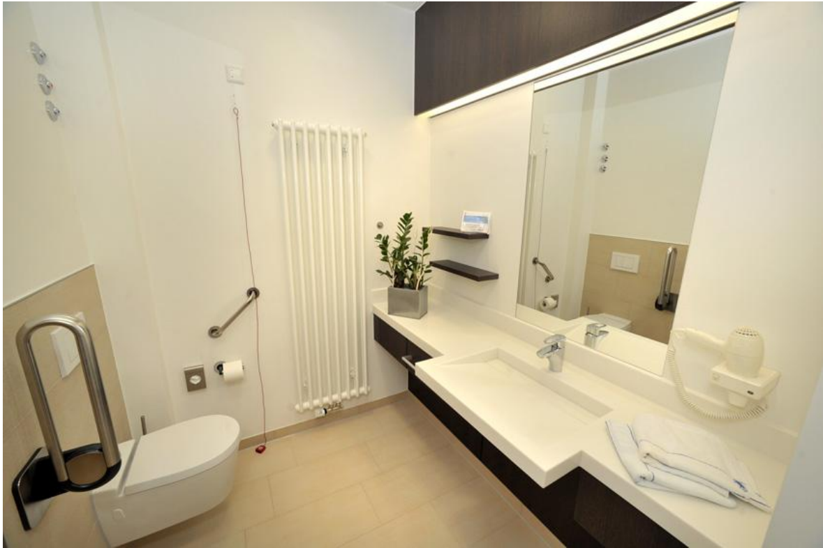
Nasszelle im Neubau.