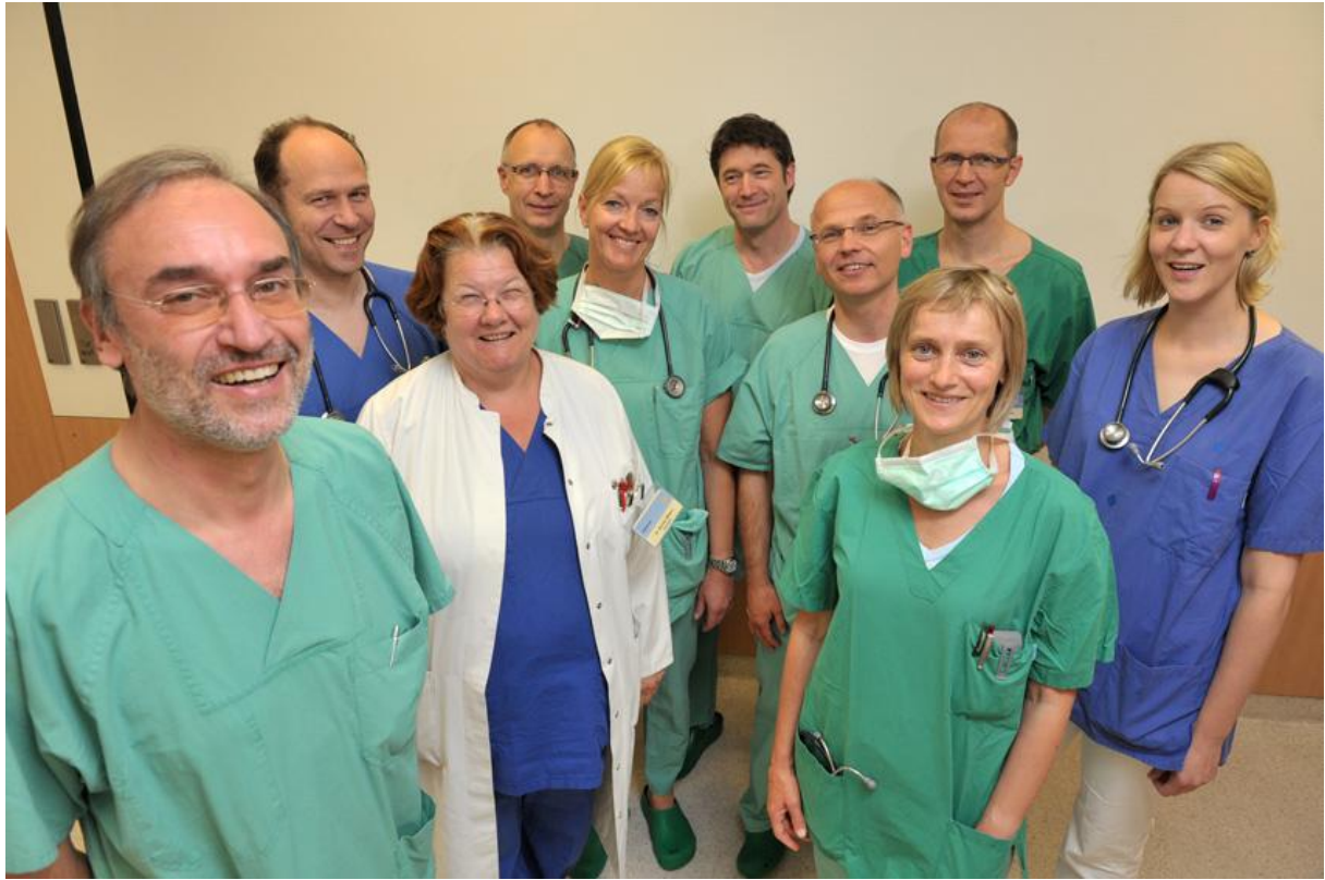
Ärzteamt der Anästhesie.