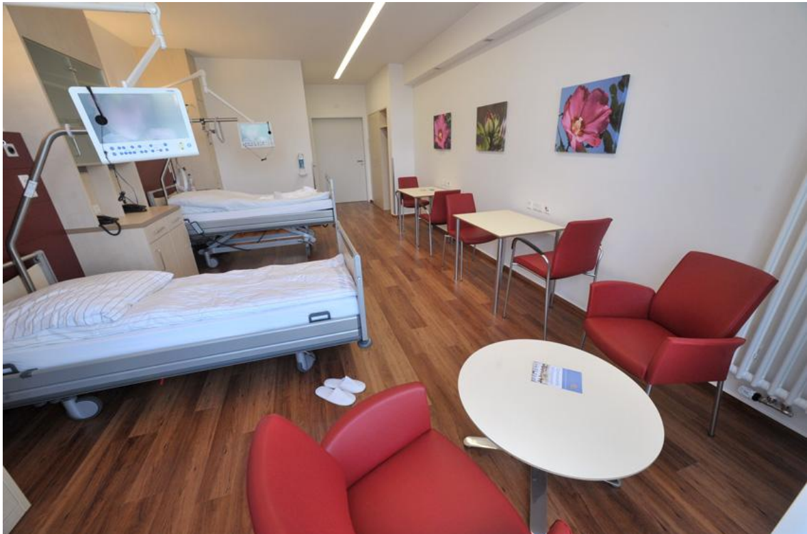
Doppelzimmer im Neubau.