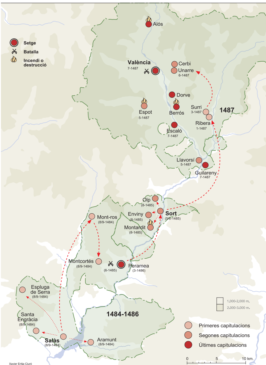
Itinerari de l'exèrcit reial durant la guerra del Pallars (1484-1487) i comptes de despeses de manutenció, cura i enterrament del comte Hug Roger III durant el seu captiveri al castell de Xàtiva des del 1503 fins al 1508, any de la seva mort.

De fet, aquesta significació és la que hauria volgut tenir el comte. Més d'un cop m'he imaginat el nostre heroi presoner immòbil, tenia foc a les cames, segons diuen les cròniques. Els ferros, les cadenes que el subjectaven li impedien la correcta circulació de la sang, l'ompliren de nafres i l'abocaren a una mort anunciada d'ençà que el Gran Capitán el féu presoner mentre era governador del Castell Nou de Nàpols. En la penombra trista de la cel·la del castell de Xàtiva el comte planyia la dissort, fitava, ferit de mort però altiu, la història i ens interrogava: mi-reu-me ara, veieu aquests ossos que ja no m'aguanten la còrpora? Aquesta pell flàccida mig coberta per quatre parracs, aquestes cames nafrades que ja no caminen, aquesta cara escolorida, clivellada pels solcs de la tragèdia, aquest ulls enfonsats i tristos que us observen des d'un altre món perquè han