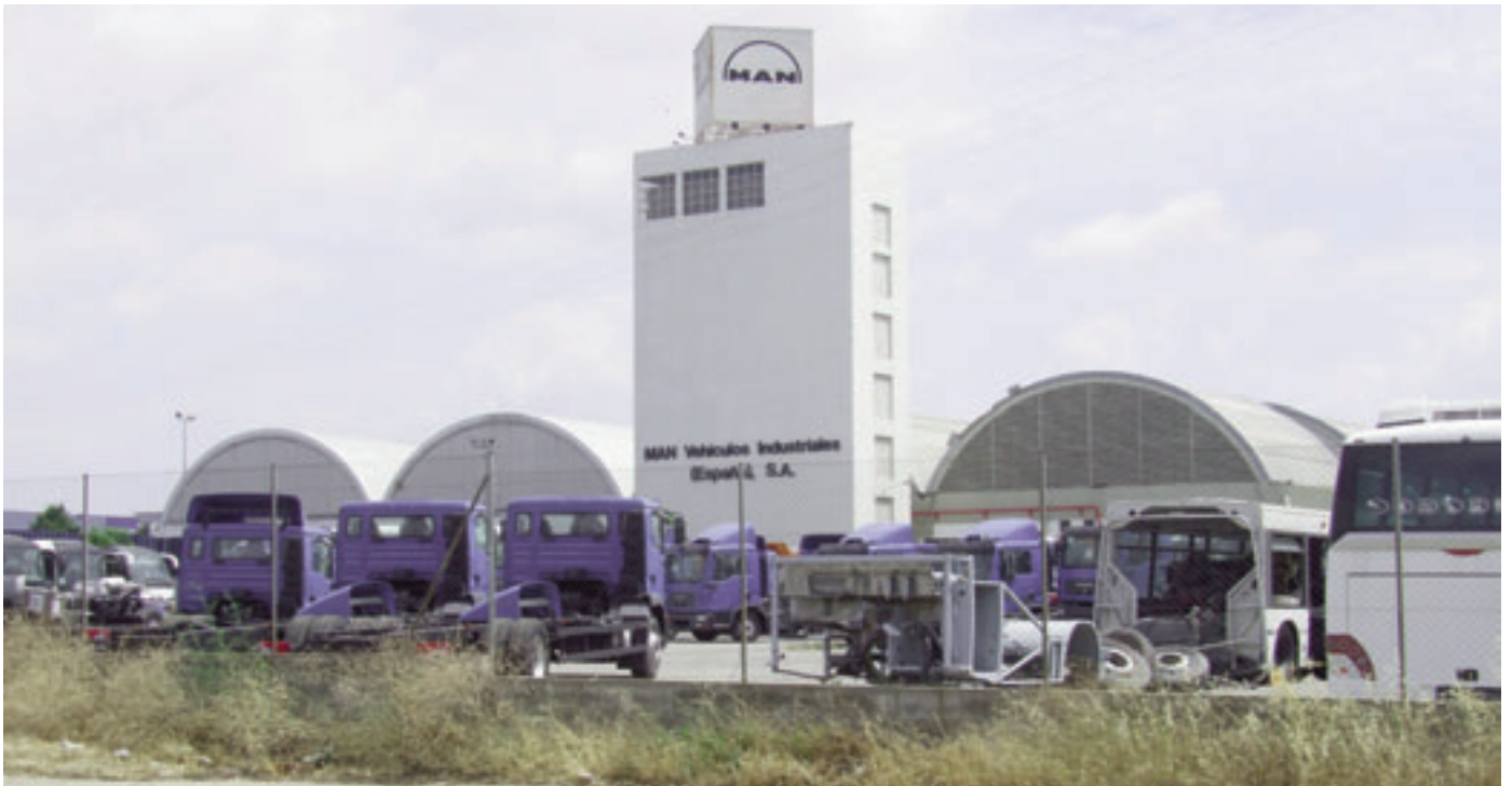
Antiga fàbrica de Cervezas Moritz, avui MAN

instal·lacions, sinó que han estat reocupades per a d'altres activitats industrials. El setembre es presentava per part de l'empresa un expedient de crisi a la Delegació de Treball de Barcelona per tal de reduir la plantilla de treballadors de 653 a 150, fet que va originar l'inici del conflicte laboral que es va resoldre amb una indemnització global de 100 milions de pessetes per a 80 treballadors 3 que no acceptaren les condicions que l'empresa els oferia i que havien aguantat la protesta fins el juliol de 1978.