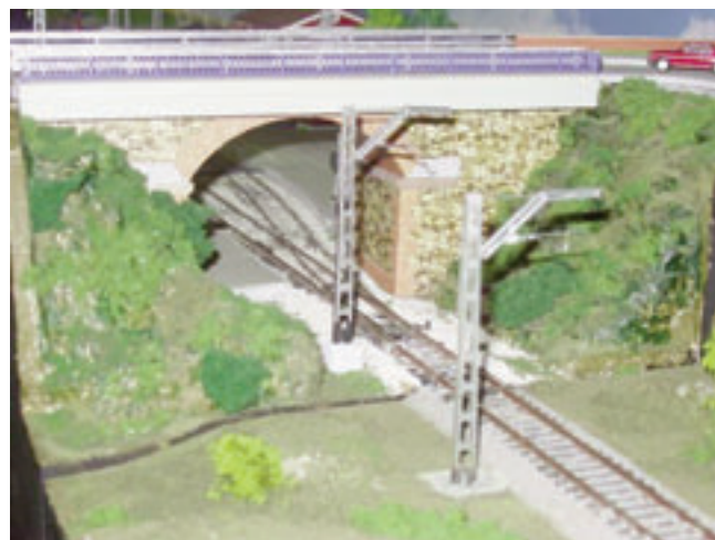
Vista del pont que creua la via i que era l'única entrada i sortida de Parets a la antiga N-152.