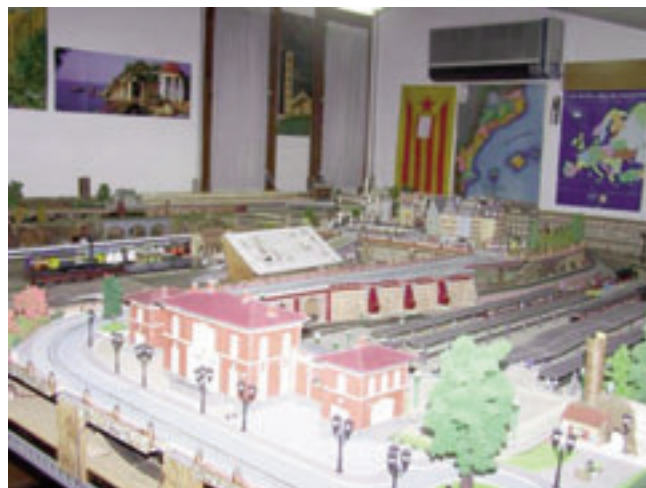
Si tenim em compte que hi poden circular més d'una desena de trens a l'hora ,podríem dir que aquesta maqueta és una obra d'enginyeria.