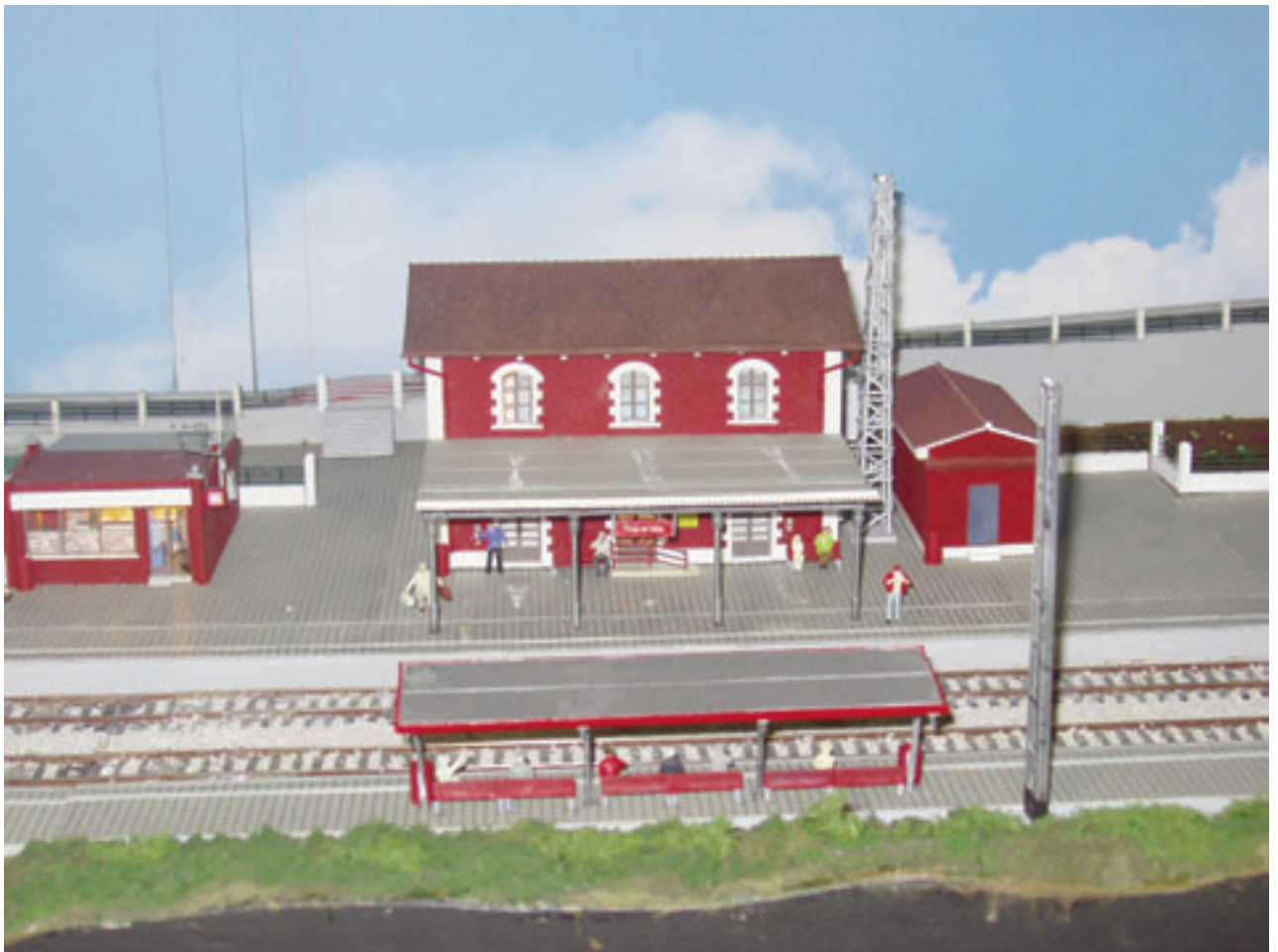
Maqueta de l'estació de Paret, presentada en el Saló del Hobby l'any 2007.