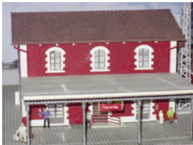
Fins i tot va reproduir amb molta exactitud la caseta del cap d'estació