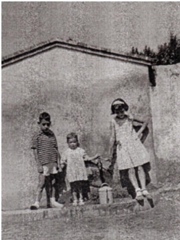
Font d'aigua potable, carrer Sant Josep

L'aigua per alimentar aquests nous serveis, procedia de la mina de la fàbrica. Aquest nous equipaments estaven situats en la confluència dels carrers de Sant Josep i Ponent, a la banda nord.