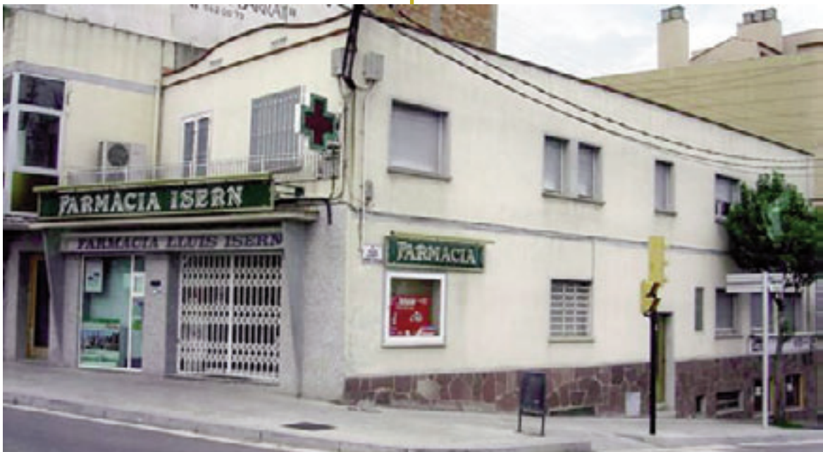
FARMÀCIA ANTIGA AV. CATALUNYA 84

Va ser Alcalde de Parets del Vallès de l'any 1962 al 1966, període en què es va construir l'Institut Patronat Pau Vila, on es farien estudis de Batxillerat.