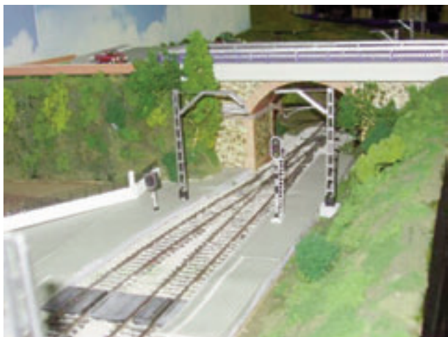
En Josep va cuidar cada detall de la maqueta per que fos el més real possible