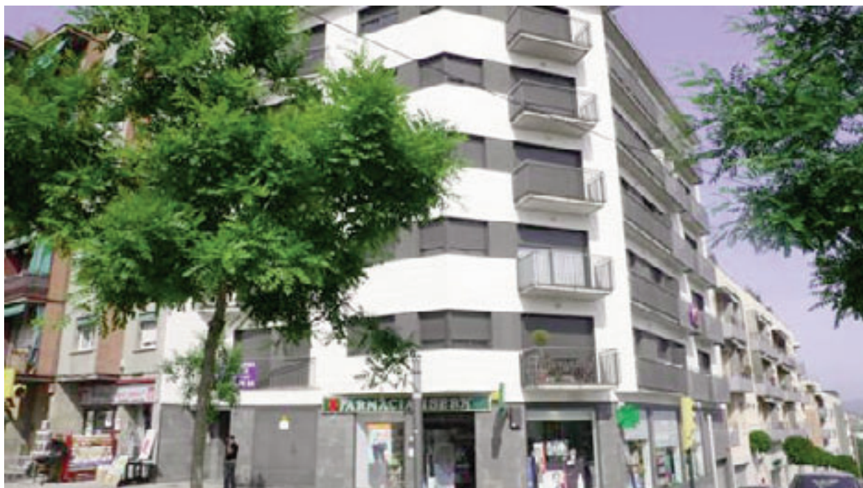
FARMÀCIA NOVA AV. CATALUNYA 84