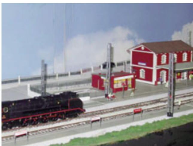
La seva gran passió eren els trens i es per això que hi va dedicar més d'un any a la construcció d'aquesta maqueta.