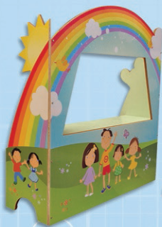
תאטרון בובות וספסל בונה