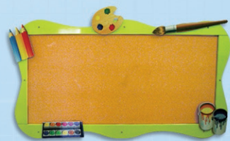
לוח מודעות משולב אלמנטים