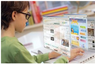
הילדים של היום בעולם של מחר - העולם הדיגיטלי של מטח.

ספרי דעת (אנציקלופדיות ברשת) ומערך כלים המסייע להבנת החומר הנלמד.