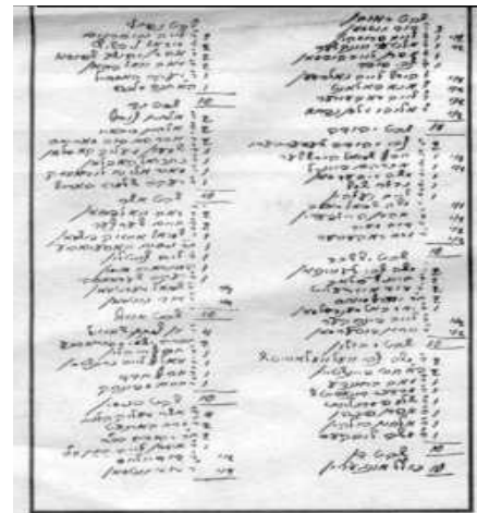
רשימת חלוקת הנחלות לפי השבטים