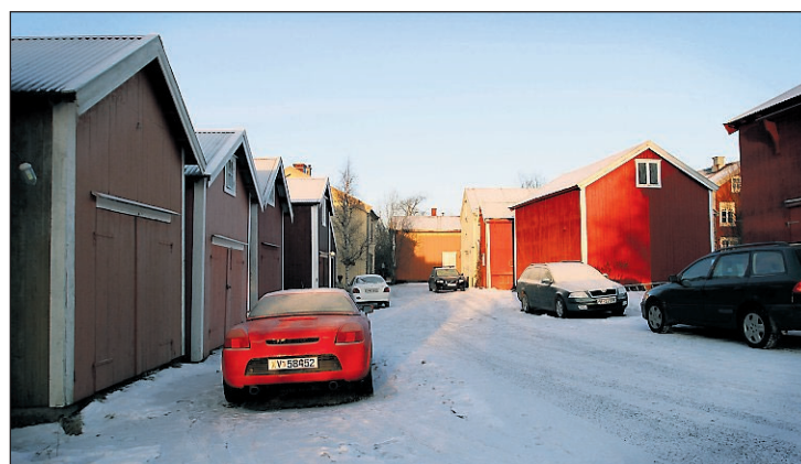
Januarsol i Nergato