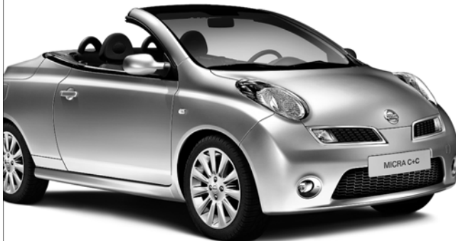
Abb. zeigt MICRA C+C <acenta>.