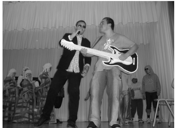
Die AG Tanz der „Schule an der Weida“ rockt zu „Amadeus“

Besonders gefeiert wurde die AG Tanz, die mit ihrem Mix aus Menuett und Modernem Tanz für Stimmung sorgte.