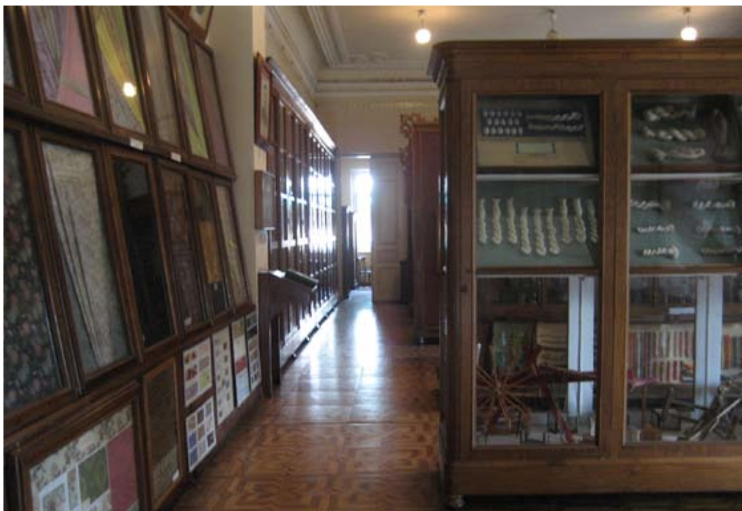
Tbilisi. Budynek Muzeum Jedwabnictwa, wnętrze. Projekt A. Szymkiewicz. Fotografia z roku 2007.