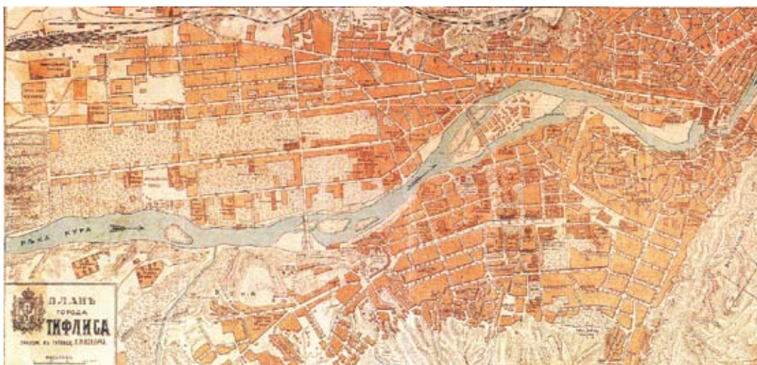
Plan Tbilisi, 1890 r.

Nowe dzielnice charakteryzowały się regularną siecią komunikacyjną i zabudową o cechach rosyjskiego klasycyzmu – w I połowie XIX w. oraz wprowadzonym w okresie późniejszym bogactwem detali prezentujących neostylową dekorację fasad.