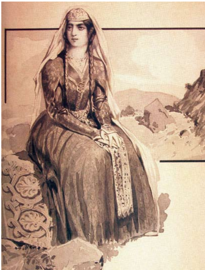
Henryk Hryniewski, „Matka Gruzji”. Tusz na papierze; ilustracja wykonana do „Dzieł zebranych Ilii Czawczawadzego” Państw. Muz. Lit. Gruzji 2 .