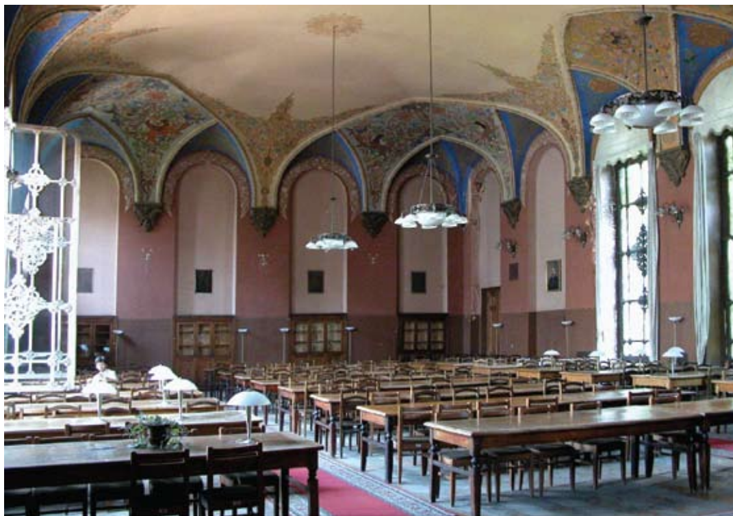
Tbilisi, ulica Gudiaszwili 3. Budynek Narodowej Biblioteki Parlamentu Gruzjińskiego, Czytelnia główna. Fot. z roku 2009.