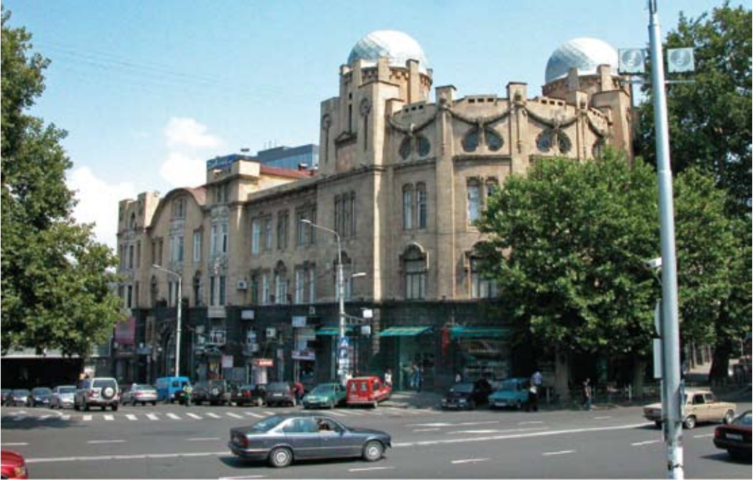
Tbilisi. Dom (czynszowy) Melika Azarjanta wybudowany w latach 1912–1915 wg proj. Mikołaja Obolońskiego. Fotografia z roku 2007.