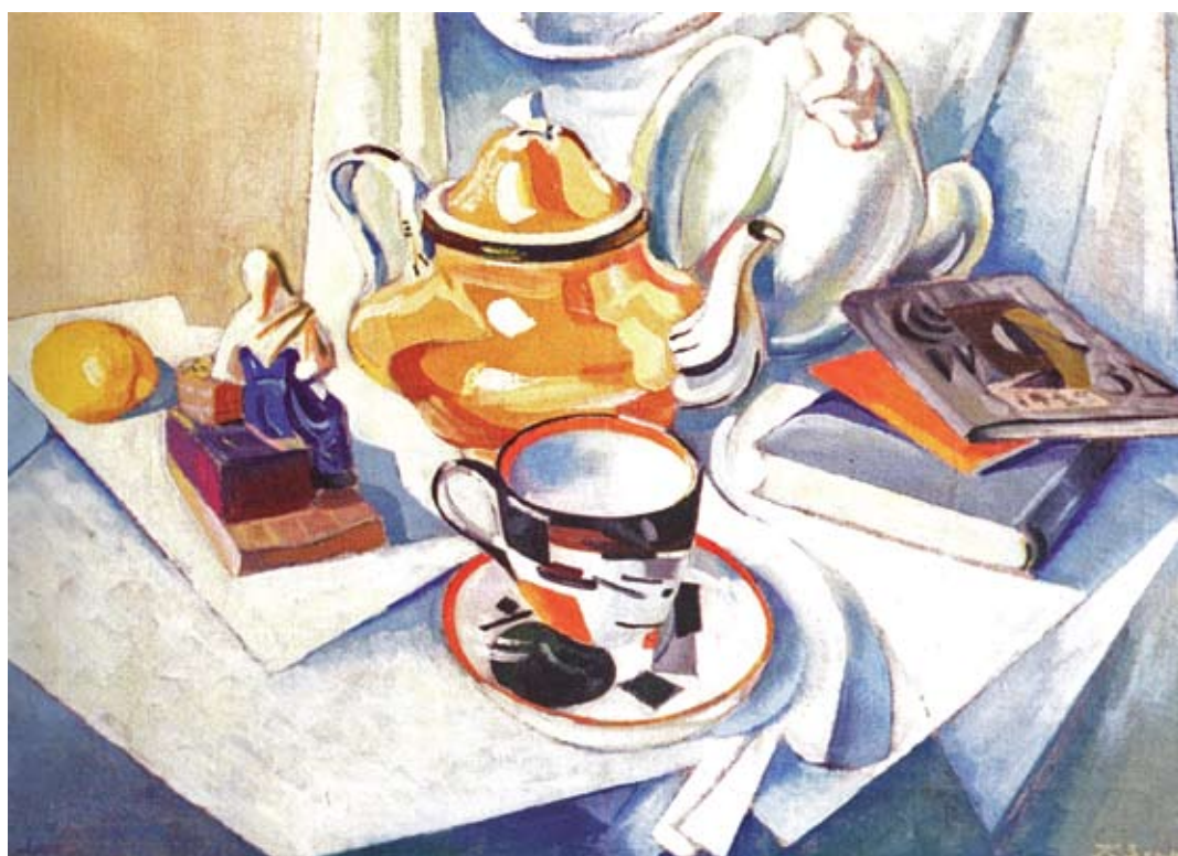
Cyryl Zdaniewicz, „Martwa natura z czajnikiem”. Olej na płótnie, 82 x 65cm, 1919 rok. Gruzjińskie Narodowe Muzeum Sztuki.

Dokonywania artystyczne Polaków w Gruzji obejmujące II połowę XIX w. i dużą część wieku XX pokazane zostały poprzez działania poszczególnych architektów, malarzy, rzeźbiarzy. Brak jest opracowań syntetyzujących zjawiska artystyczne na Kaukazie w okresie ostatnich dwustu lat. Konieczne są pogłębione badania archiwalne i dokumentacyjne 4 . Zainteresowanie Gruzją i innymi krajami Kaukazu wzmagane wydarzeniami politycznymi w tym rejonie powoduje publikacje coraz to nowych prac odslania-