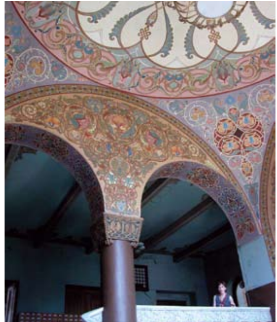
Tbilisi, ulica Gudiaszwili 3. Budynek Narodowej Biblioteki parlamentu gruzjińskiego, dekoracja głównej klatki schodowej. Fot. z roku 2009.