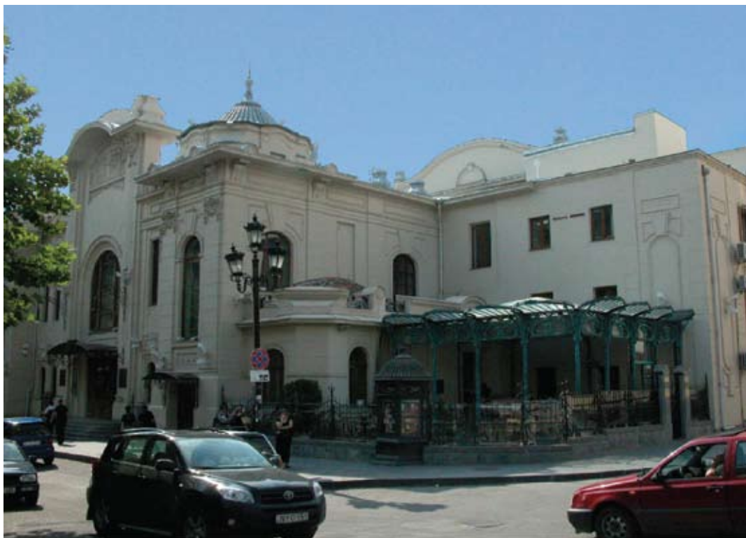
Tbilisi. Państwowy Akademicki Teatr Marjaniszwili. Projekt – Stefan Kryczyński. Fotografia z roku 2009.