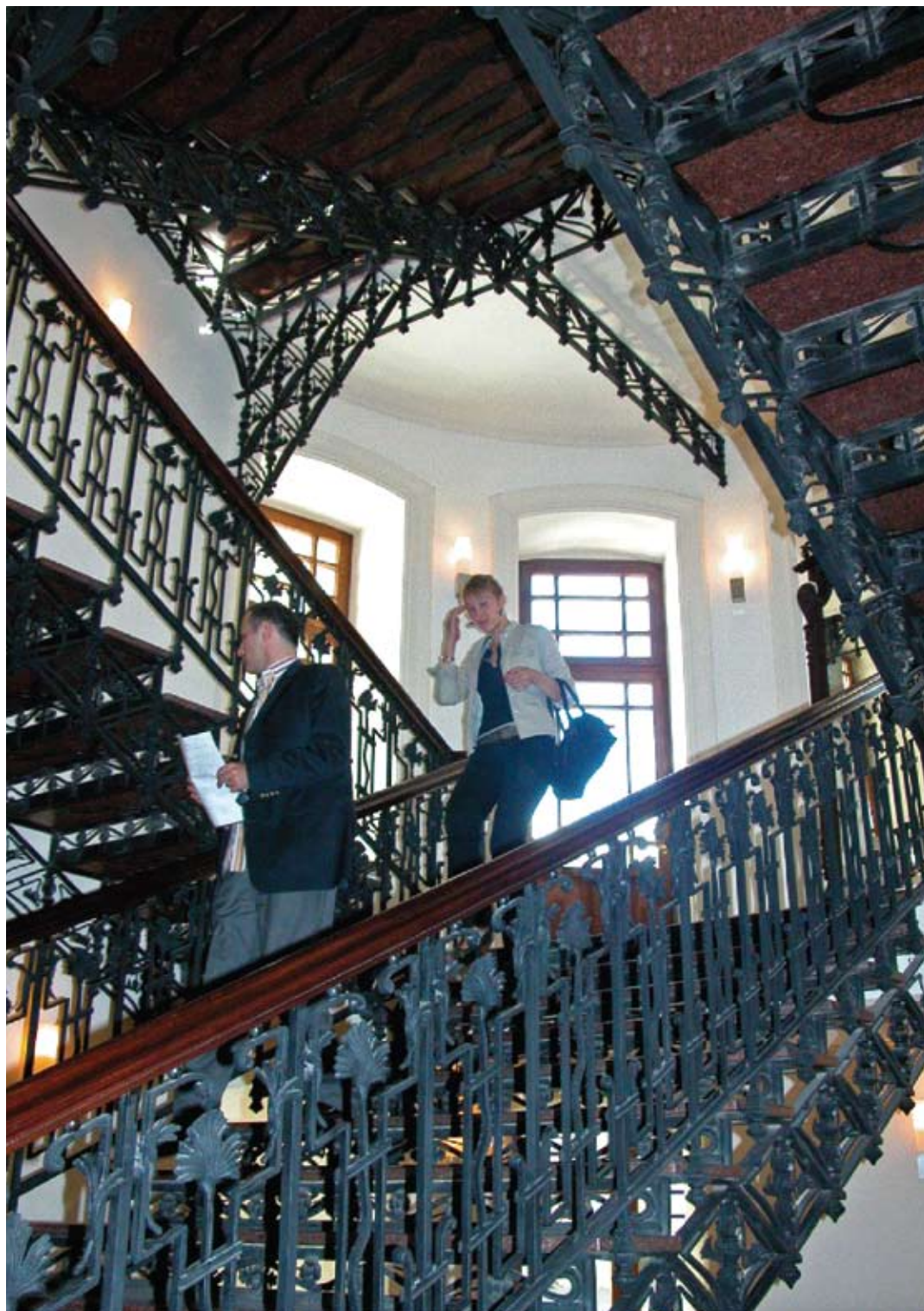
Tbilisi. Budynek Banku TBC – główna klatka schodowa. Fotografia z roku 2007.