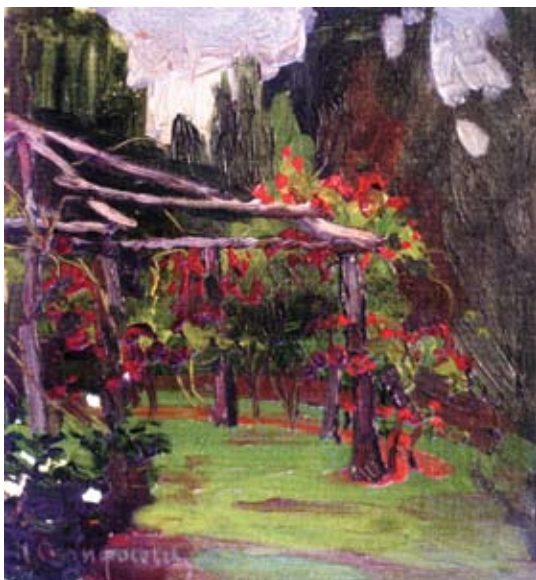
M. Sklifasowski, „Altanka”, 32 x 20,5 cm. Gruz. Muzeum Narodowe Sztuki.

Brał udział w spotkaniach, także międzynarodowych (w Dreźnie w 1913 r), na których udowodnił potrzebę powszechnego nauczania technik artystycznych.