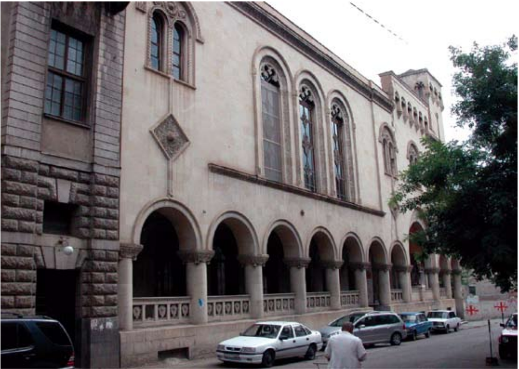
Tbilisi, ulica Gudiaszwili 3. Budynek Narodowej Biblioteki Parlamentu Gruzjińskiego, projekt Anatolij Kalgin i Henryk Hryniewski, wzniesiony w latach 1913 – 1916. Fotografia z roku 2007.