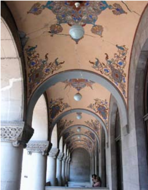
Tbilisi, ulica Gudiaszwili 3. Budynek Narodowej Biblioteki Parlamentu Gruzjińskiego, dekoracja podcieni. Fot. z roku 2009.