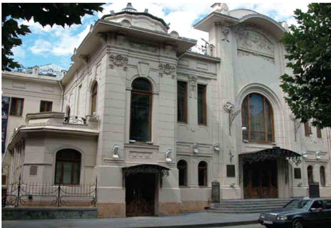
Tbilisi. Państwowy Akademicki Teatr Marjaniszwili, elewacja frontowa. Projekt – Stefan Kryczyński. Fotografia z roku 2009.