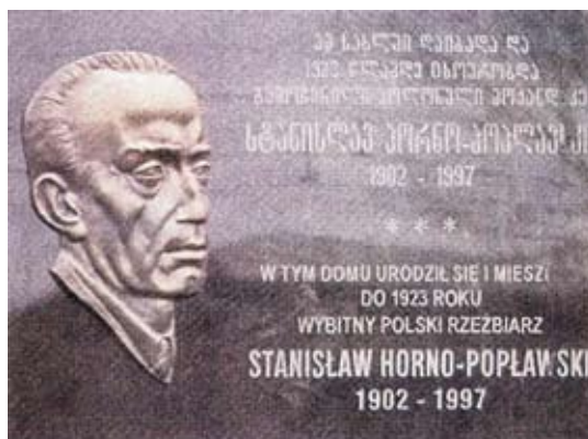
Tablica pamiątkowa w Kutaisi.