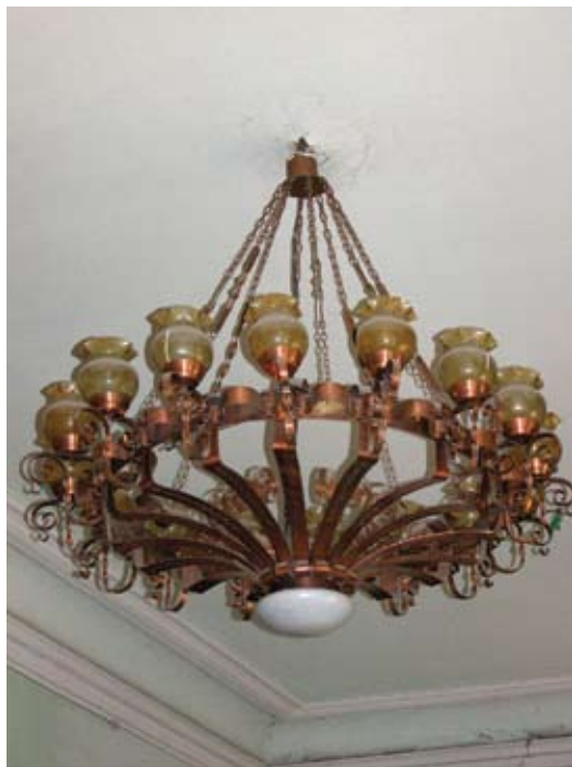
Tbilisi. Budynek Muzeum Jedwabnictwa, wnętrze. Projekt A. Szymkiewicz. Fotografia z roku 2007.