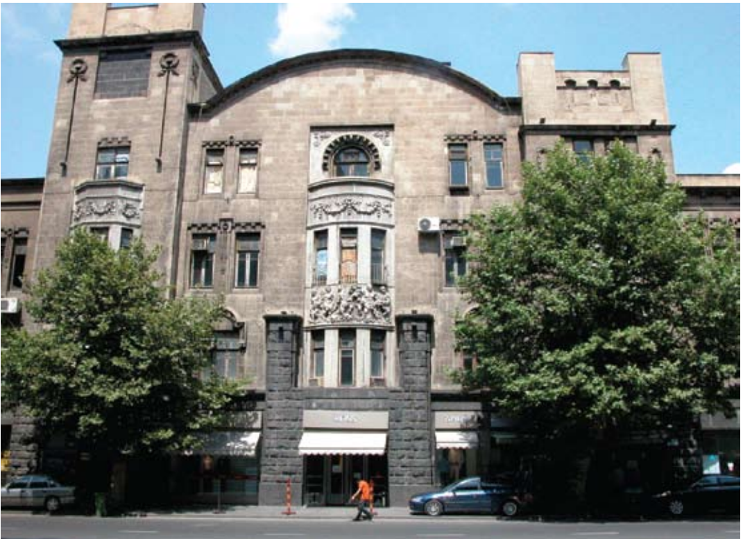
Tbilisi. Dom (czynszowy) Melika Azarjanta wybudowany w latach 1912–1915 wg proj. Mikołaja Obolońskiego. Fragment fasady od strony Alei Rustawelego. Fotografia z roku 2009.