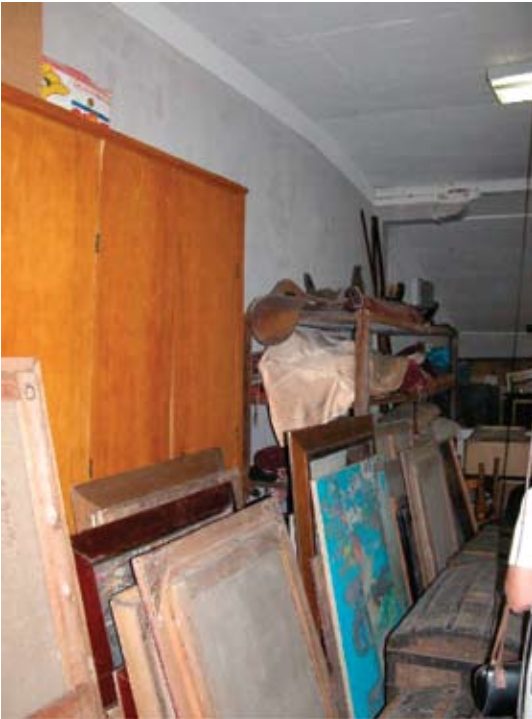
Muzeum Historyczne Miasta Tbilisi, jedno z pomieszczeń, gdzie przechowywane są obrazy i inne muzealia. Fot. z roku 2007.