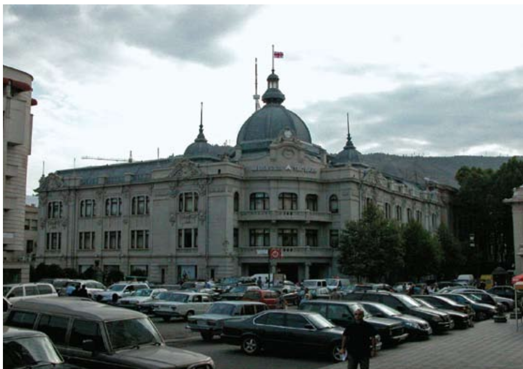
Tbilisi. Pierwotnie budynek przeznaczony na siedzibę Towarzystwa Ekonomicznego Oficerów Kaukaskich, obecnie Bank TBC, wzniesiony w latach 1911 – 1913 według projektu Aleksandra Rogojskiego. Fotografia z roku 2009.

Rogojski był też autorem projektów budynków Seminarium Teologicznego – obecnie mieści się tutaj Szpital Miejski nr 9 oraz Szkoły Położnych (na ulicy Kostawa). Budowle wzniesiono w 1903 roku. Budynek Szkoły Położnych Rogojski zaprojektował w stylu Art Nouveau.