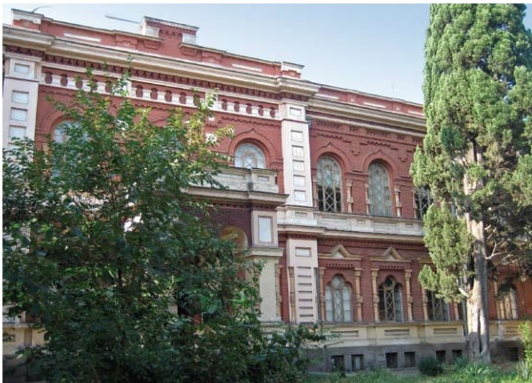
Tbilisi. Budynek Muzeum Jedwabnictwa. Projekt A. Szymkiewicz. Fotografia z roku 2007.