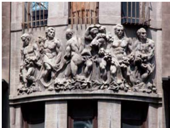
Tbilisi. Dom (czynszowy) Melika Azarjanta wybudowany w latach 1912–1915 wg proj. Mikołaja Obołońskiego. Fragment fasady z dekoracją figuralną. Fotografia z roku 2009.

Mikołaj Obołoński był zainteresowany działalnością w Gruzji (podobnie jak inni architekci). Świadczy o tym jego udział w konkursie na budynek Banku Gruzińskiego ogłoszonym w roku 1913. Projekt Obołońskiego zajął jednak II miejsce i dom Przy Alei Rustawelego pozostał jego docenianą, znakomitą, acz jedyną realizacją.