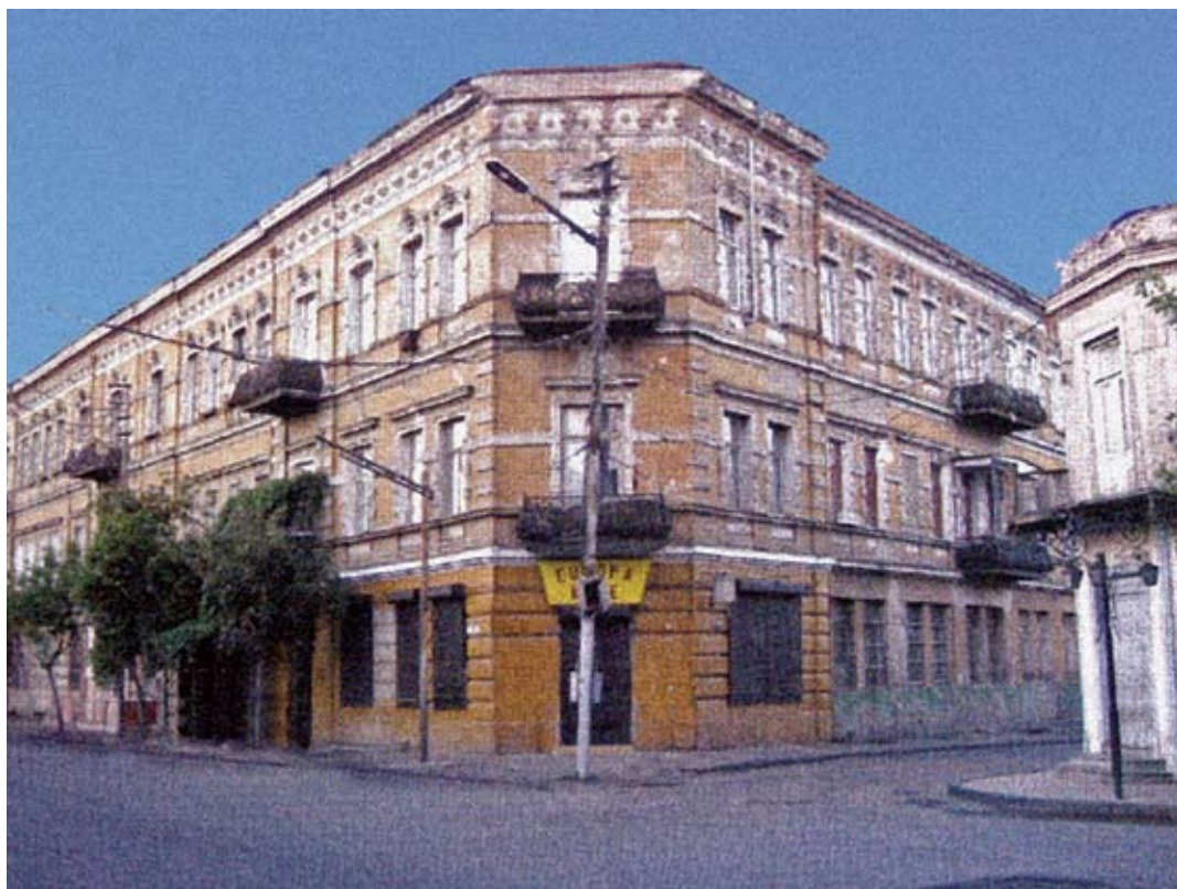
Tbilisi. Kamienica z mieszkaniami na wynajem zaprojektowana przez A. Rogojskiego. Fotografia z roku 2006.

W Tbilisi wykształcił się typ kamienicy ze ściętym narożnikiem, kilkoma bramami dla ułatwienia komunikacji i malowniczymi balkonami usytuowanymi na wszystkich elewacjach. Zwykle są to budowle dwukondygnacyjne bądź trójkondygnacyjne z dużą ilością detali architektonicznych.