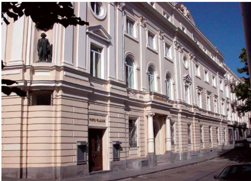
Tbilisi. Szkoła Muzyczna. Projekt – Aleksander Szymkiewicz. Fotografia z roku 2007.