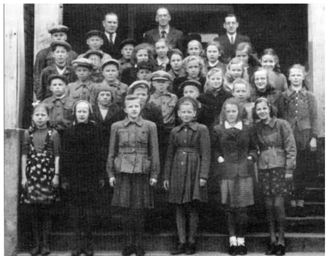
”Rantasalmen yhteiskoulun luok- kakuva syksyllä 1946 Manttaalikun- nan (ent. Suojeluskunnan) portailla.

Rantasalmella toimi kunnallinen kokeilukeskikoulu ja keskikoulu vuosina 1953-1975 peruskoulu-uudistukseen saakka.