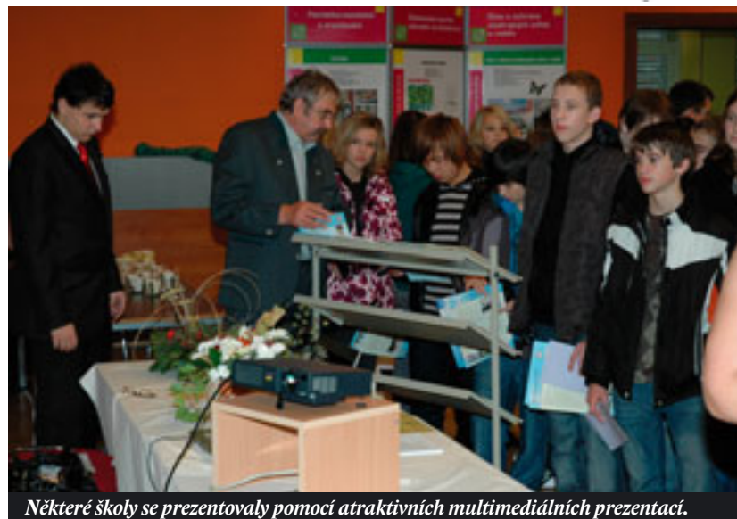
Některé školy se prezentovaly pomocí atraktivních multimediálních prezentací.

Dělnický dům se opět zaplnil stánky středních škol převážně z širšího regionu, které zde žákům základních škol představily svou nabídku učebních a studijních oborů. Škol, které mají zájem se v Dělnickém domě prezentovat, každým rokem přibývá. Letos jich bylo již 27, což je o dvě víc než v loňském roce.