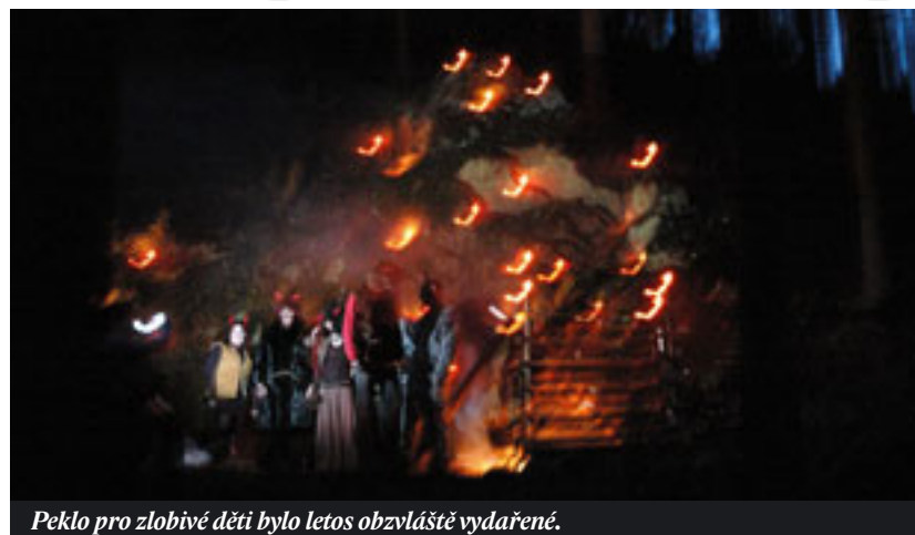
Peklo pro zlobivé děti bylo letos obzvláště vydařené.

Trasa se každý rok trochu mění. Letos se podepsala těžba po polomech v okolních lesích na kvalitě cest, a možnosti tím byly velmi omezené. Nešlo využít známé trasy nad Palavou ani dál v lesích. Pořadatelé tak provedli všechny lesem nad sídlištěm Zborovce, jen kousek od bytových