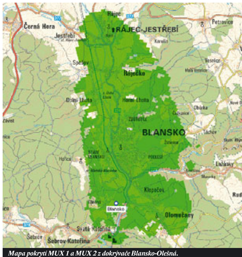
Mapa pokrytí MUX 1 a MUX 2 z pokrýváče Blansko-Olešná.

K vypnutí na konci ledna se mohou, ale nemusí, přidat i televizní stanice z II. multiplexu. Je proto nanejvýš vhodné zajistit si do konce roku 2010 kompletní technologii pro bezproblémový příjem digitálního televizního vysílání. To může pro někoho znamenat jen dokoupení settop boxu, pro bytové domy se společnými televizními anténami (STA) i odborné zásahy na anténách a anténních svodech. red