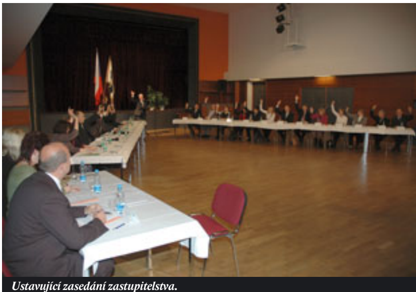
Ustavující zasedání zastupitelstva.