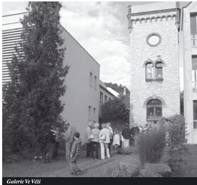
Galerie Ve Věži