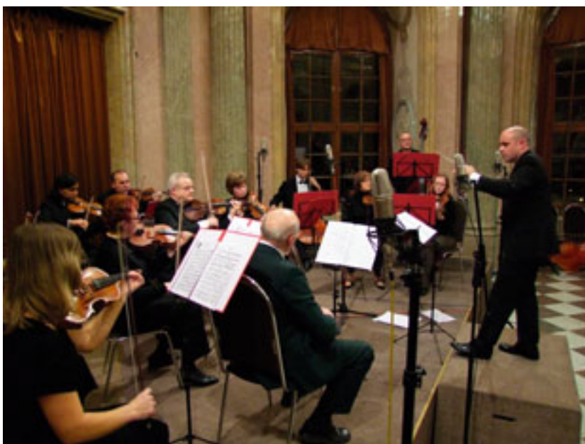
Komorní orchestr města Blanska na festivalu Setkání 2010.

Jubilejní 10. ročník mezinárodního festivalu neprofesionálních komorních orchestrů se konal v období 2.–14. listopadu v koncertních sálech Klášterního Hradiska, Paláce Bohemia a sídla MFO v Redutě v Olomouci. Festival s názvem Setkání 2010 si nenechal ujít ani Komorní orchestr města Blanska (dále KOMB) pod taktovkou svého nového dirigenta Zdeňka Nádenička.