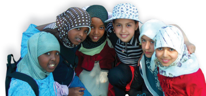
► Bild: Römosseskolan i Göteborg