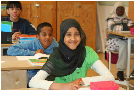
► Bild: Al Azharskolan i Stockholm