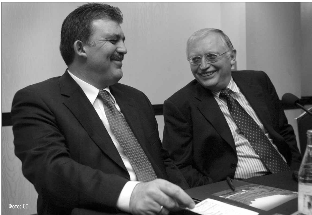
Міністр закордонних справ Туреччини Абдулла Гюль (на фото ліворуч) намагається переконати Комісара Гюнтера Ферхойгена в тому, що його країна заслуговує на членство в ЄС

Втім, оглядачі зазначають, що Туреччині не слід розраховувати на вступ до ЄС у найближчій перспективі. Навіть найзапекліші оптимісти кажуть, що це