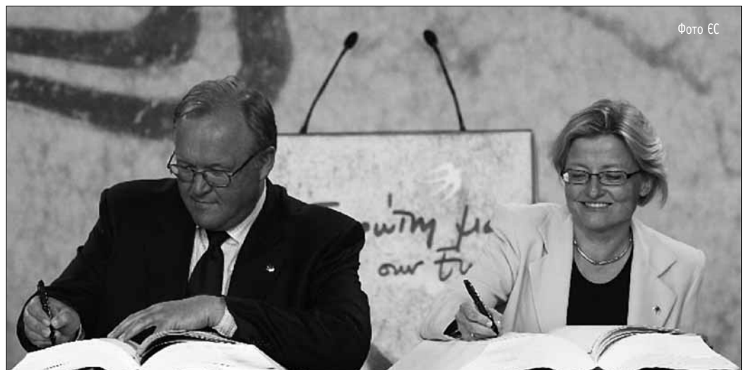
Багато людей були переконані, що через кілька років Анна Лінд змінить лідера шведських соціал-демократів Йорана Перссона і стане першою жінкою на посаді прем'єр-міністра Швеції