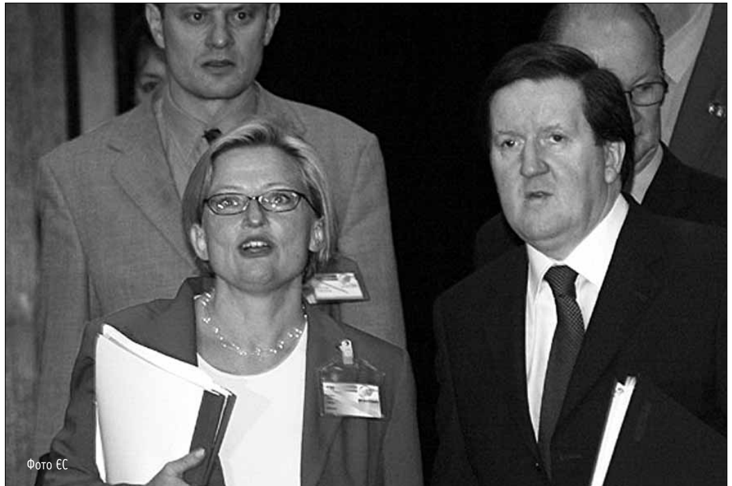
Міністр закордонних справ Анна Лінд з Генеральним секретарем НАТО Лордом Джорджем Робертсоном

Рік тому в стокгольмській клініці Karolinska від отриманих у торгівельному центрі ножових ран померла міністр закордонних справ Швеції Анна Лінд. Померла за три дні до пропагандованого нею референдуму про приєднання Швеції до єврозони. Вона була, є і залишиться однією із найяскравіших зірок на політичному олімпі Швеції. Анна Лінд була талановитим, енергійним, компетентним міністром закордонних справ. Жінкою, якій на піці своєї політичної кар'єри вдавалося поєднувати неймовірне службове навантаження, жіночу привабливість та материнство.