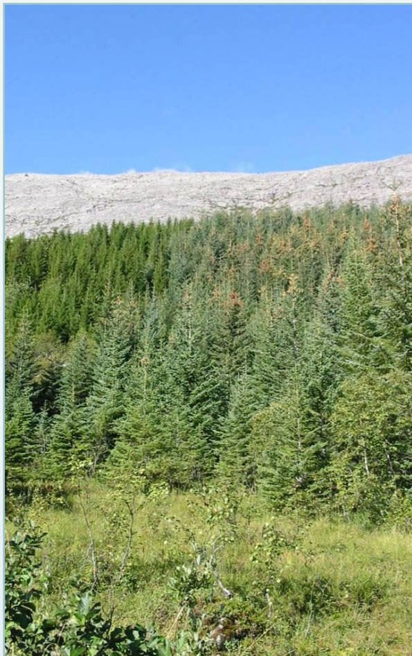
Vanlig gran (venstre) og sitkagran med rikelig konglesetting (høyre) i plantefelt. Hamnes, Alstadhaug kommune, Nordland.

gjør også at sitkagran har større følsomhet for frost og tørke. Sitkagrana er vind- og salttolerant, og har derfor god konkurransevne i havnære områder. I unge, tette plantninger er lystilgangen til bakken så liten at felt- og bunnvegetasjon er svært dårlig utviklet. Mikroklimaet endres, og det naturlige artsmangfoldet påvirkes betydelig. Arten synes å ha noenlunde samme innvirkning på jordsmonnet som vanlig gran. Sitkagran utvikles best på noe næringsrik mark med god drenering, men kan også trives godt på veldrenert torvmark. Den beste utviklingen for sitkagranbestand i Vest-Norge er i lune og friskt fuktige fjordlier i midtre fjordstrøk.