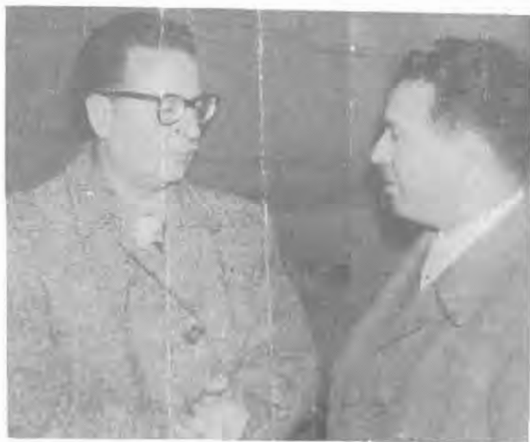
Salvador Allende y Nelson Salinas. Valparaíso. 1958.

Nació en Rilán, Chiloé, en 1921. Contador. Ingresó al PS en 1937. Dirigente seccional y regional del partido. Alcalde de Viña del Mar durante el gobierno del Presidente Allende. Elegido diputado en 1973. Una de las figuras más prestigiosas del socialismo porteño.