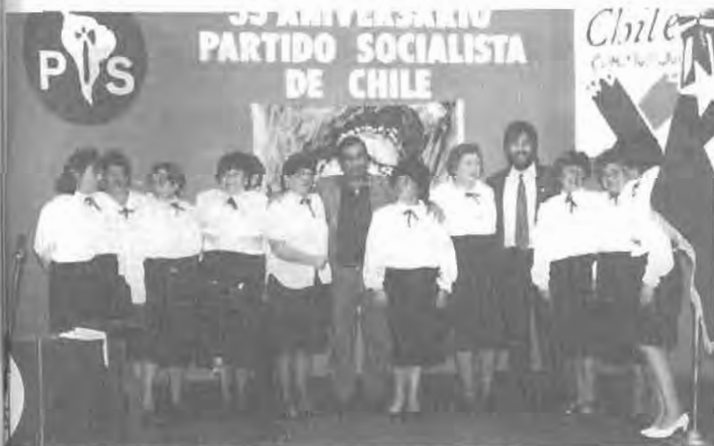
Mujeres socialistas de Rancagua junto a los diputados Héctor Olivares y Juan Pablo Letelier.

Nació en 22 de agosto de 1924 en Rancagua, donde realizó todos sus estudios primarios y secundarios. Posteriormente, ingresó a la Universidad de Copiapó, titulándose de Ingeniero de ejecución en minas. Se inició en la empresa minera Sewell, donde llegó a presidir el sindicato y más adelante, asumió un importante papel en la Confederación de Trabajadores del Cobre. Ha sido diputado por O'Higgins en tres períodos (1965, 1969 y 1973). Después del golpe militar, fue detenido y enviado a la Isla Dawson. Luego partió exiliado a Venezuela. Diputado, Distrito 32, O'Higgins.