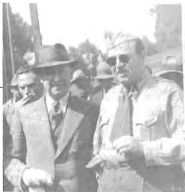
Marmaduke y Eduardo Grove.