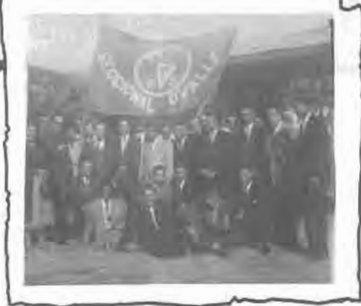
Ovalle: una seccional de significativa trayectoria en el Norte Chico. vista de una reunión de finales de los años 30.