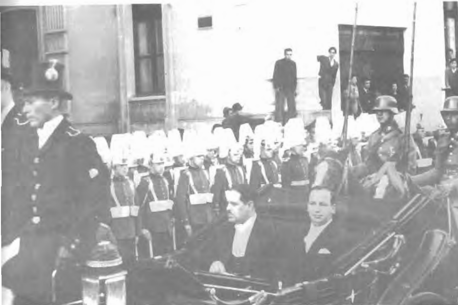
Pedro Poblete Vera , ministro de Tierras y Colonización en el primer gabinete del Presidente Juan A. Ríos.