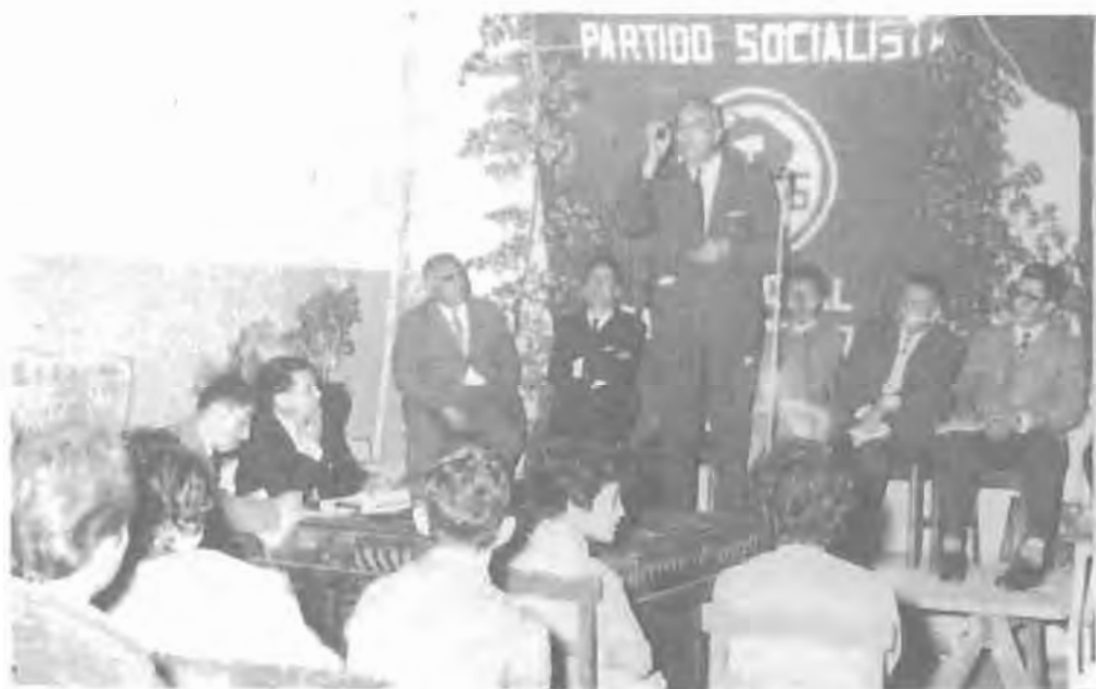
Congreso PSCH en Valparaíso. 1959. En los extremos Aniceto Rodríguez y Salvador Allende; en el centro, Salomón Corbalán; a sus lados delegados extranjeros y más a la derecha, Luis Corvalán.