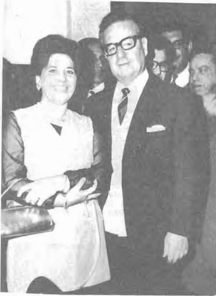
Salvador Allende y Silvia Vandorsee. Campaña presidencial 1970.