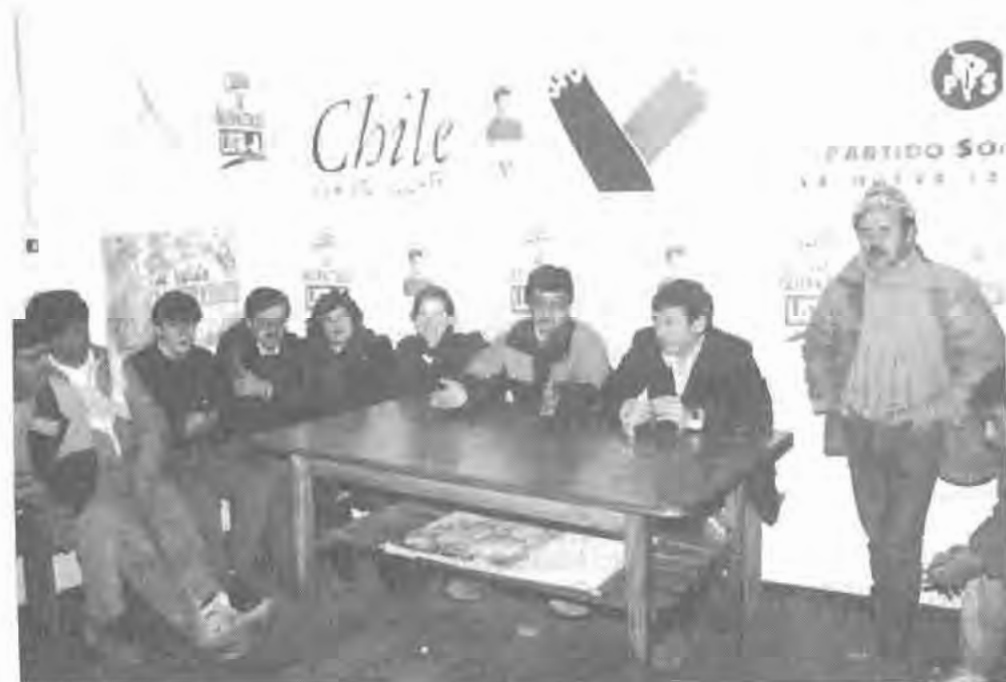
Francisco Melendez y Senador Jaime Gazmuri en campaña municipal de 1992

Nació en Santiago el 1-V-1951. Abogado. Ingresó al PSCH en 1987. Dirigente regional en Curicó. Gobernador de Curicó: 1990. Alcalde de Curicó elegido: 1992. Miembro del CC del PSCH por la VII Región.