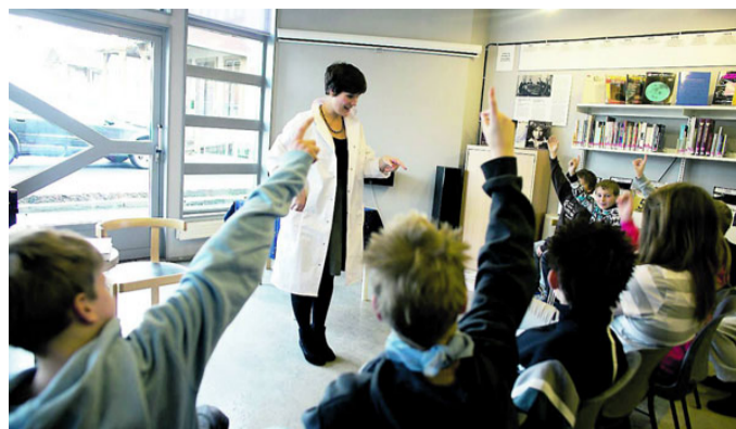
ENGASJERTE ELEVER: Syvendeklassingene ved Gamlegrendåsen skole i Kongsberg sluker kombinasjonen av magi og vitenskap.

medisin og allerede bevist at de som ikke trodde på meg tok feil. Jeg har også vist at det lønner seg å satse på rehabilitering.