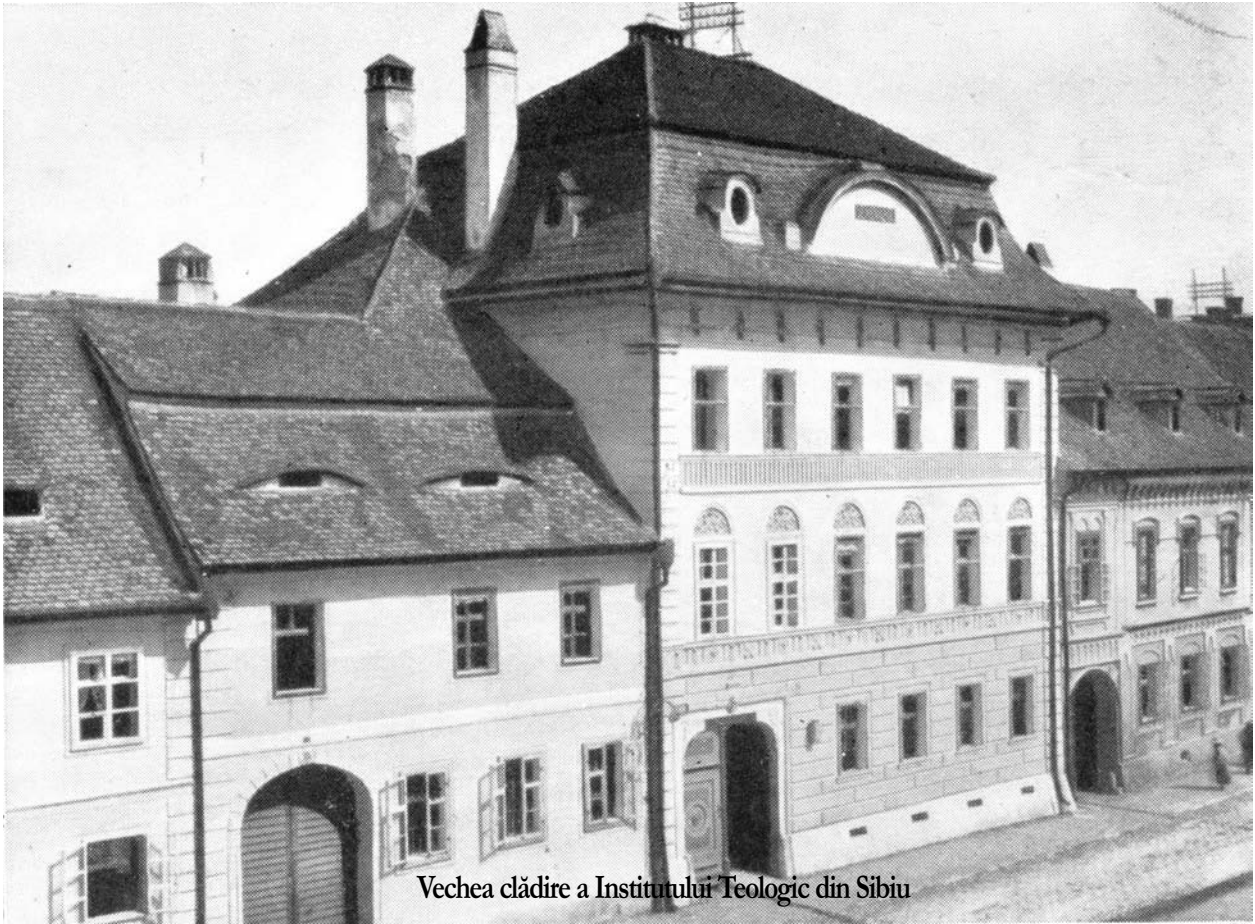
Vechea clădire a Institutului Teologic din Sibiu

mai mare, cu cât, ajunși în cadrul României întregite, vedem Biserica noastră încâtușată într-o măsură mai mare decât toate celelalte confesiuni minoritare”. În al doilea rând, afirma Lupaș, în constituția din 1923 “lipsește cu desăvârșire ... cuvântul de autonomie sau autodeterminare sau autolegislățiune bisericească”, deoarece Vintilă Brătianu “a declarat în mod hotărât că este în contra introducerii acestui cuvânt în textul Constituțiunii. Astfel a rămas cuvântul eliminat” 120 .