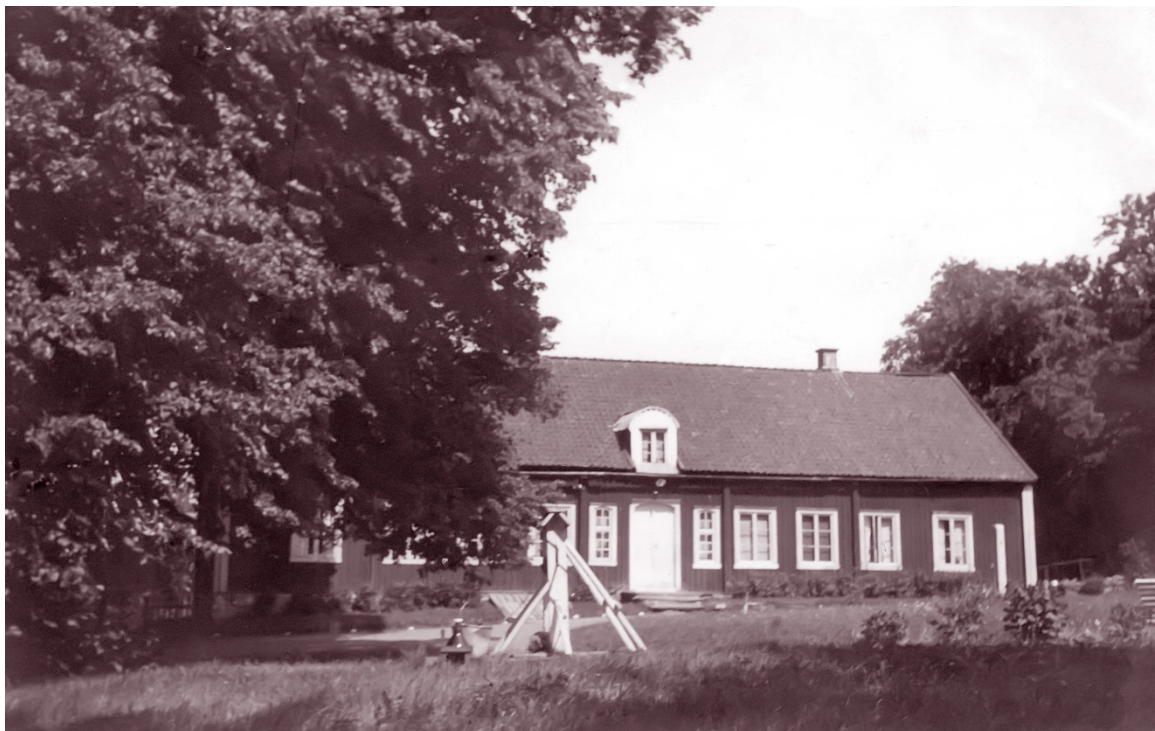
Alfhems Kungsgård 1940