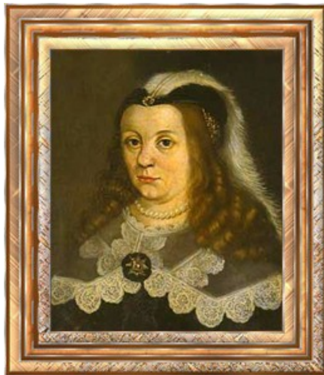
Katarina Stenbock Gift med Gustav Wasa den 22 augusti 1552

Alfhem förlänades till Gustav Olofsson Stenbock , vars dotter Katarina blev Gustav Vasas tredje hustru.