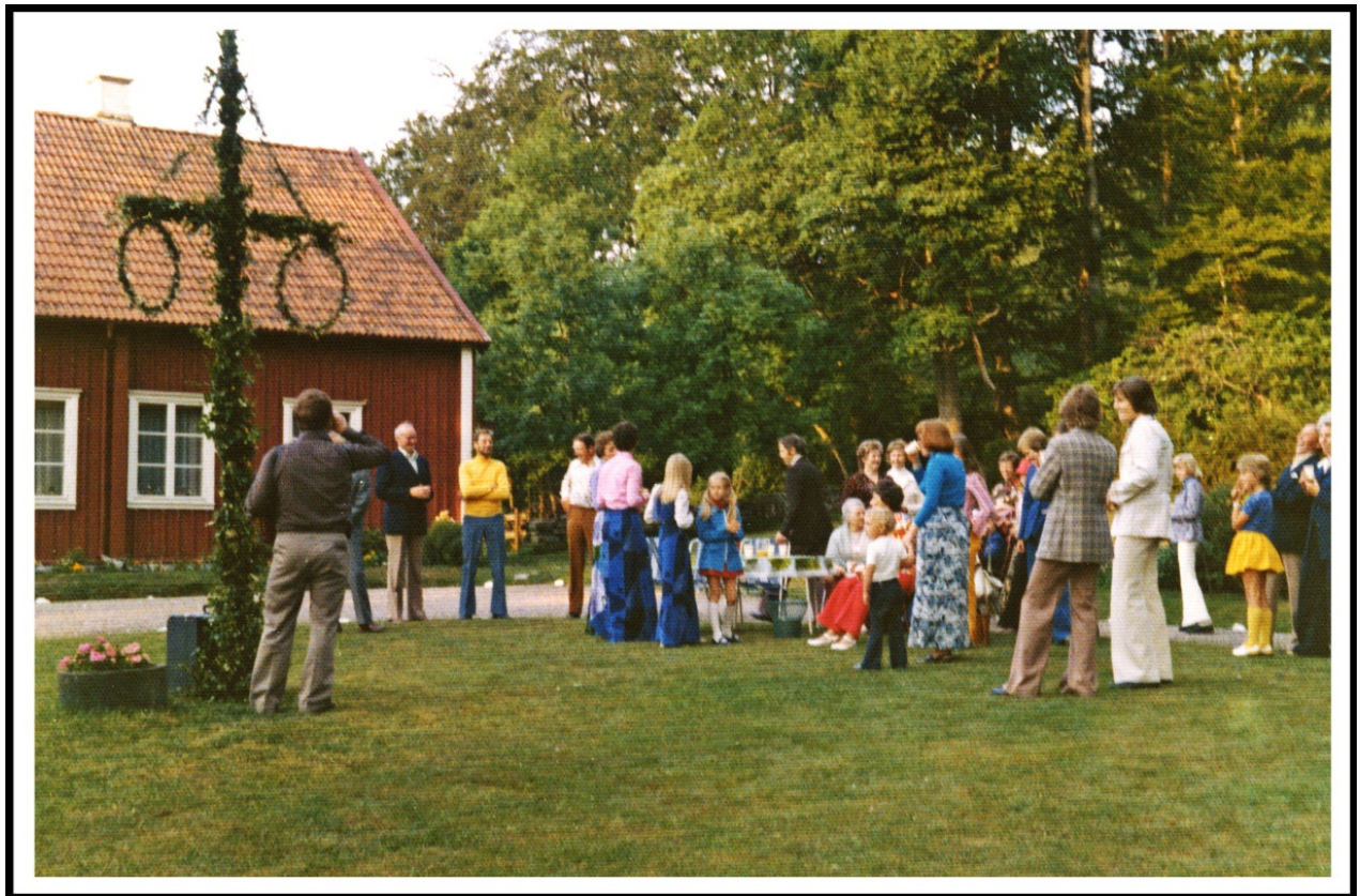
Midsommarafton med fest och dans i magasinets andra våning.