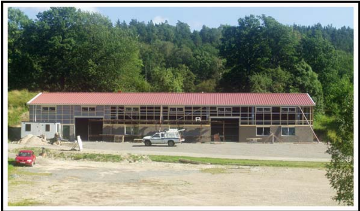
Ny maskinhall uppförs. Kostnad 2,2 mkr.