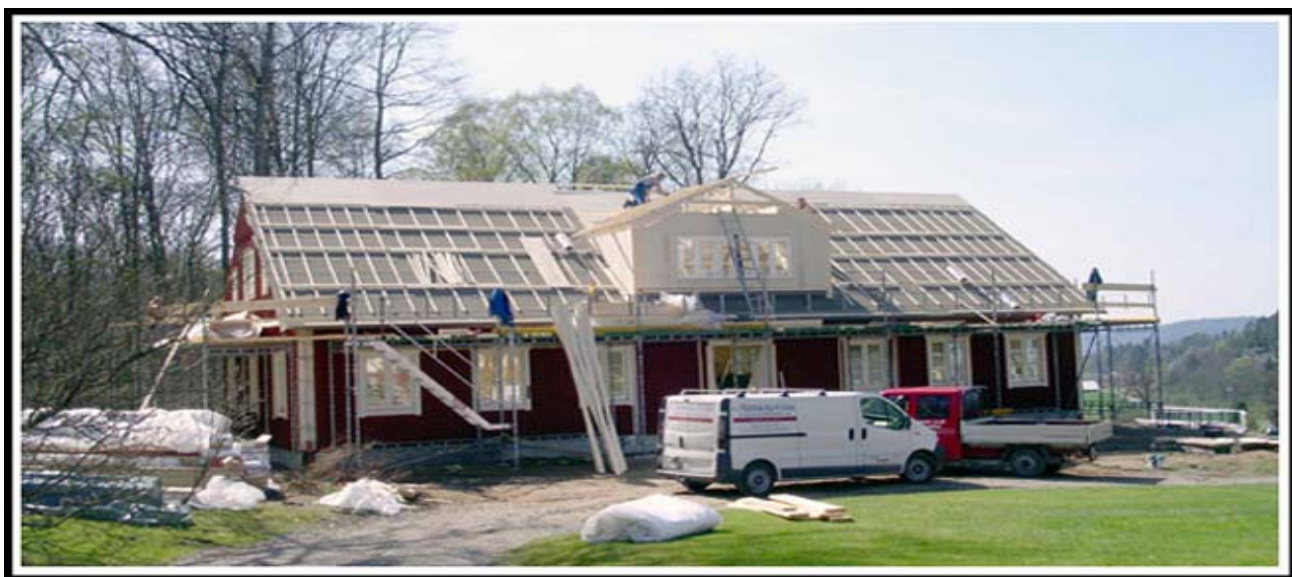
Ale GK bygger nytt klubbhus februari 2004 - april 2005. Kostnad c:a 4 mkr.