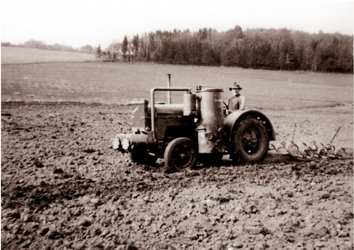
Bertil Frössling med sin gengasdrivna traktor harvar 1940. Här på nuvarande driving-rangen med ekekullen i bakgrunden.