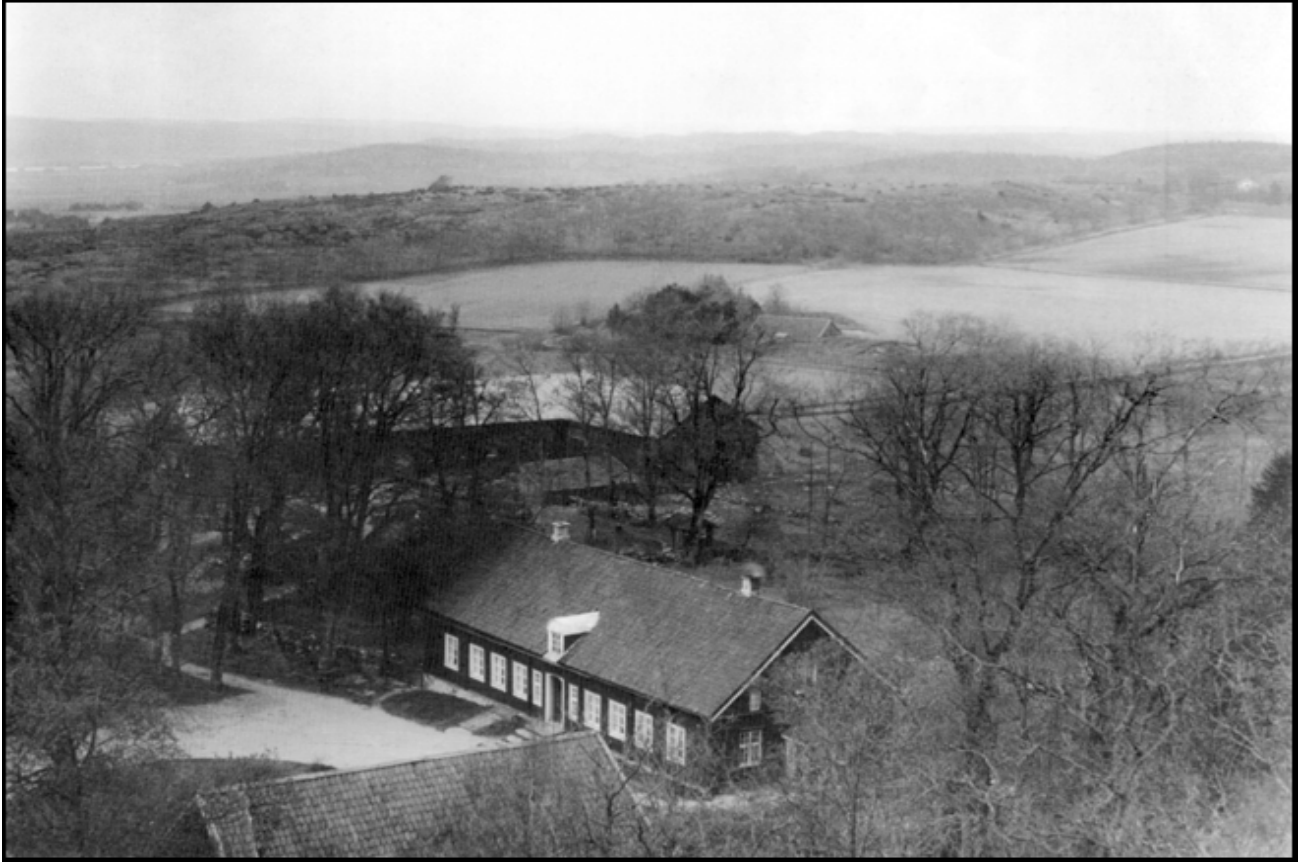
Alfhems Kungsgård 1921

(Kungsgård: Större gård i svenska kronans ägo.)