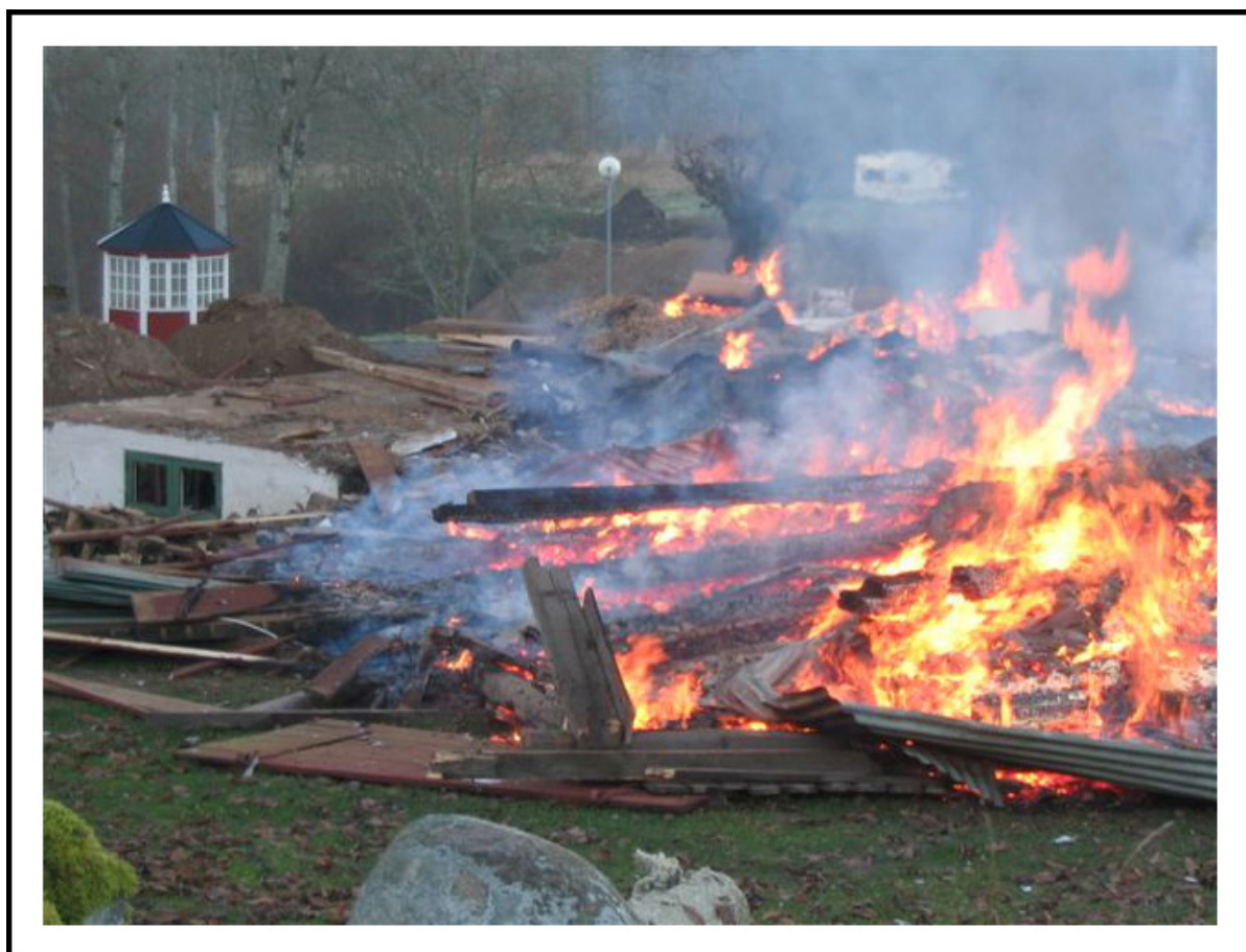
Gamla verkstaden och garaget rivs och eldas upp 2004.