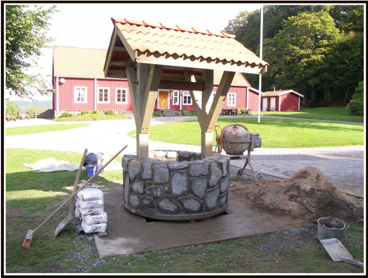
Gamla brunnen på gårdsplanen tas fram och förses med överbyggnad.