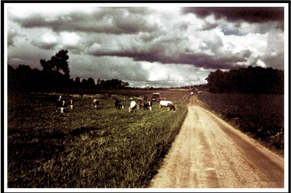
Alfhems Kungsgårds sista kor.