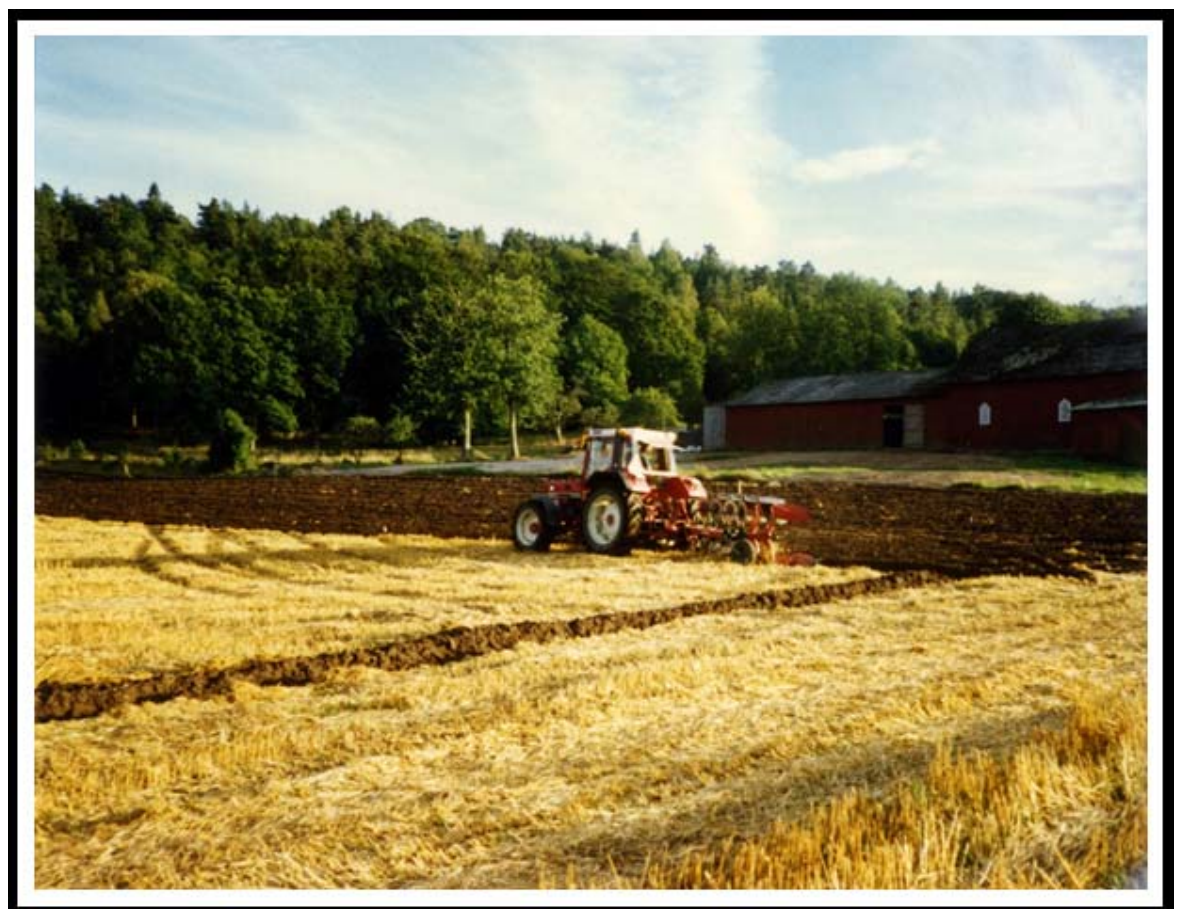
Sista plöjningen 1990.