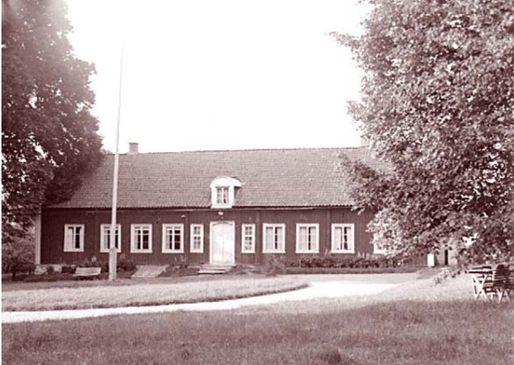
Alfhems Kungsgård 1931