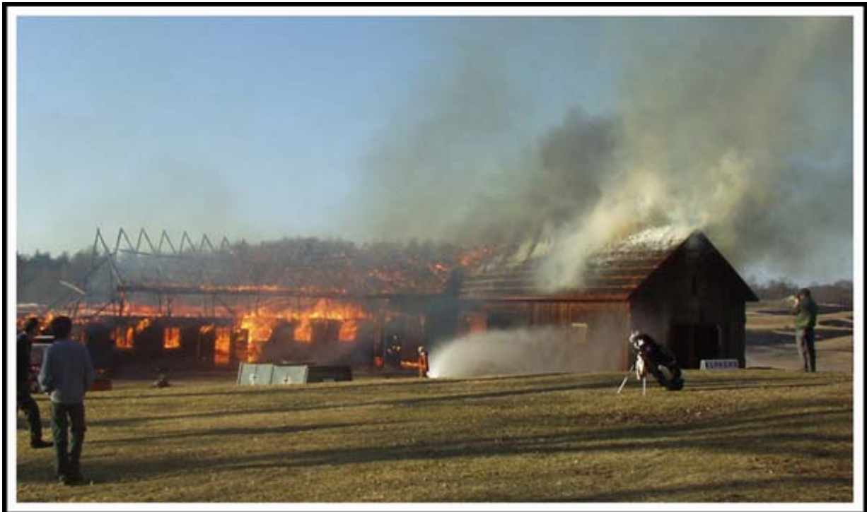
Ladan, byggd 1917, bränns ner för att göra plats för den nya golfparkeringen. Ale Räddningstjänst bränner ner byggnaden som övningsobjekt.