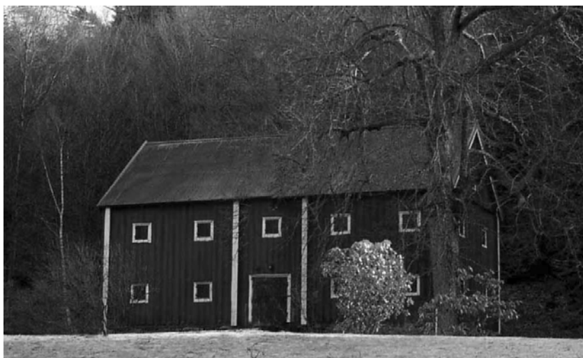
Spannmålsmagasinet intill berget vid gårdsplanen byggs.