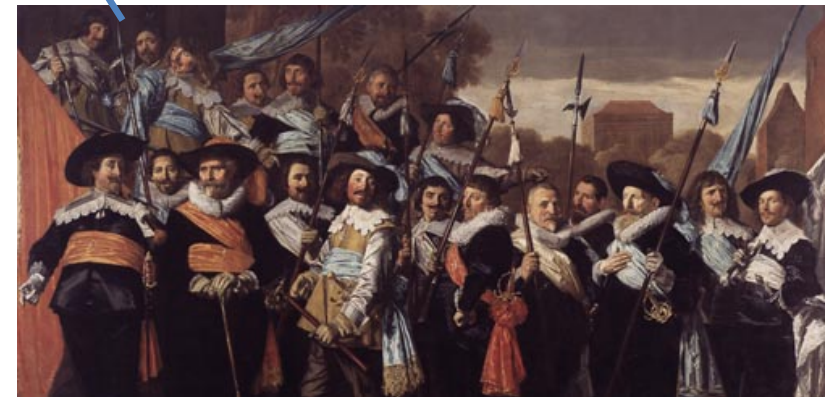
Officieren en onderofficieren van de Sint-Jorisschutterij, 1639