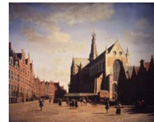
Grote Markt met Bavo geschilderd door Gerrit Berckheyde in 1696