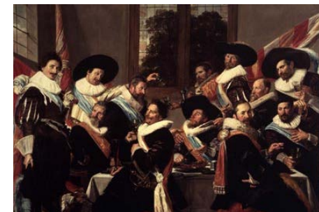
Maaltijd van de officieren van de Cluvenierschutterij, 1627