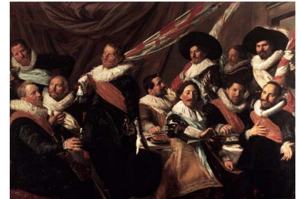
Maaltijd van de officieren van de Sint-Jorisschutterij, 1627

Vier burgemeesters zorgden voor het dagelijks bestuur. Zij werden bijgestaan door 32 mannen in de 'vroedschap'. Dat was een soort gemeenteraad. De rechtspraak werd door de schout en zeven schepenen gedaan. Al de genoemde mannen kwamen uit rijke families.