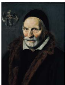
Portret van Jacobus Zaffius geschilderd in 1611.