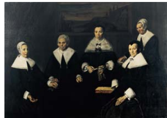
Regentessen van het Oudemannenhuis, 1664