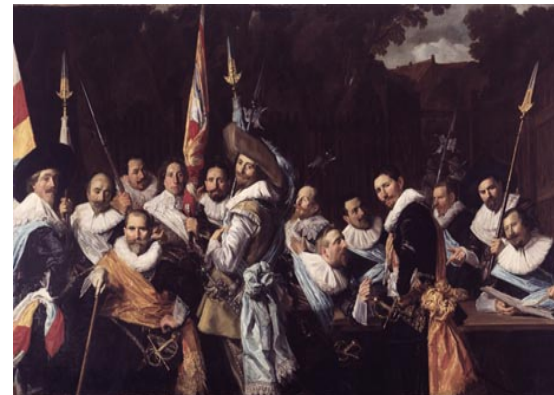
Vergadering van officieren en onder-officieren van de Cluveniersschutterij, 1633