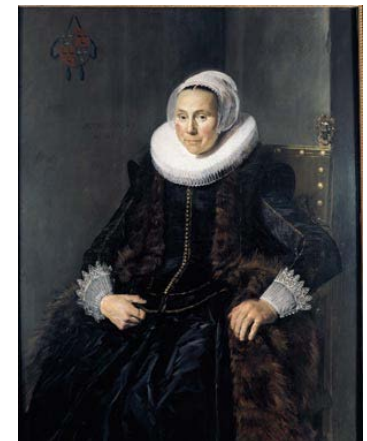
Cornelia Vooght, 1631