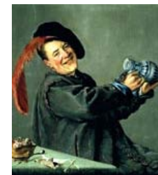
De vrolijke drinker, geschilderd door Judith Leyster in 1629

Judith Leyster was de eerste vrouwelijke schilder in Haarlem. Ze was een leerling van Frans Hals. Haar schilderij lijkt erg op die van haar leermeester. Hiernaast zie je een van haar schilderijen, "De vrolijke drinker", een figuur die veel in toneelvoorstellingen voorkwam.