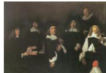
Regenten van het Oudemannenhuis, 1664