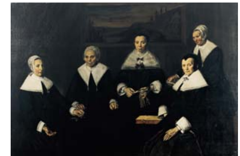
Regentessen van het Oudemanshuis, 1664