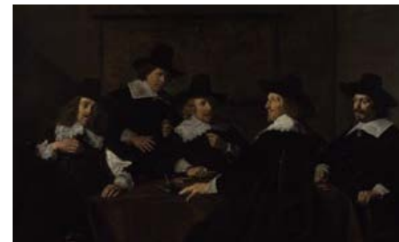
Regenten van het Sint-Elizabethsgasthuis, 1641.