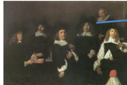
Regenten van het Oudemanshuis, 1664

Het Oudemanshuis is nu het Frans Hals Museum. Op het regentenstuk van het Oudemanshuis staat één man er een beetje raar op. Heel lang dacht men dat Frans Hals de man belachelijk maakte en hem dronken had afgebeeld. Nu weet men dat de man een ziekte had, waardoor de helft van zijn gezicht verlamd was. Frans Hals schilderde de mensen dus zoals ze echt waren.