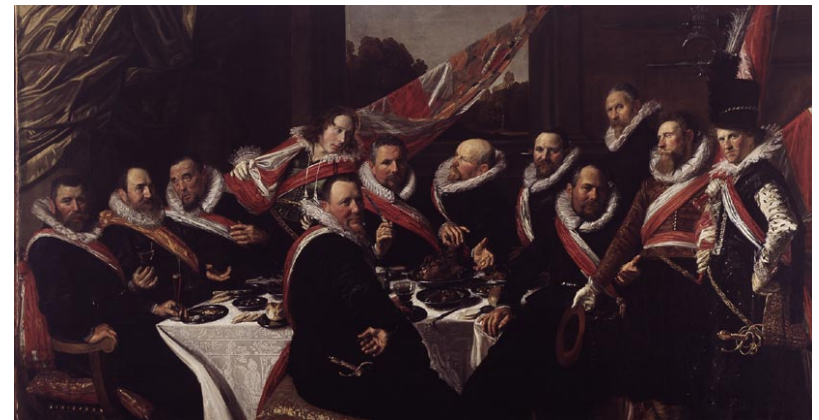
Schutters van de Sint-Jorisschutterij, 1616