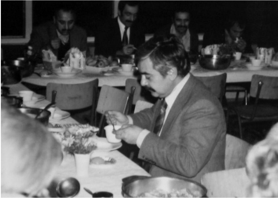
Feestelijke maaltijd in het woonoord.

stoffelijk overschot naar vrouwen en kinderen in Turkije. Een arbeider van het bedrijf Durisol overleed nadat hij op de Achthovenerweg in Leiderdorp tegen een boom was gereden. Opnieuw begeleidde Kücüksen een stoffelijk overschot naar Turkije, naar de familie in Trabzon in het Oosten bij de Zwarte Zee.