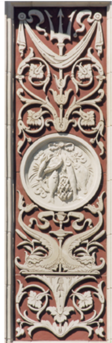
Das fertige Rekonstruktion in Terrakotta an der Fassade