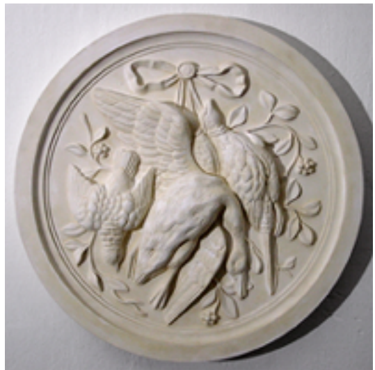
Abbildungen der Tondi aus dem Katalog der Firma March (1866)