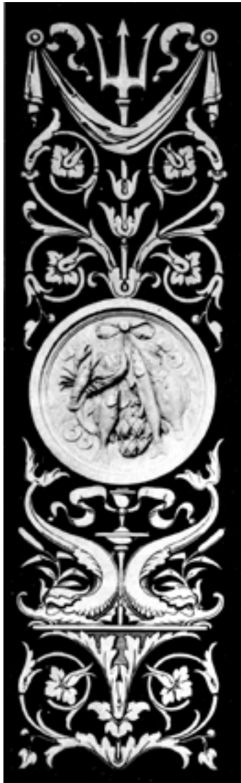
Originalvorlage des Herstellers aus dem Jahr 1866