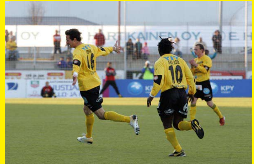
Berat harjoittelee lentoon lähtöä. Kauden ensimmäinen liigaosuma on isketty Kotkan nuottaan.