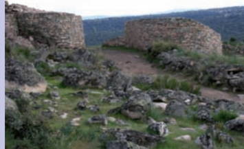
Las Cogotas. Puerta de la muralla