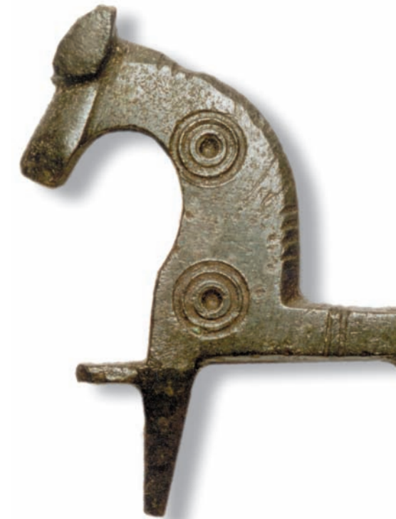
Fibula de Las Cogotas.