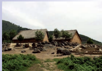
El Freillo. Casas reconstruidas