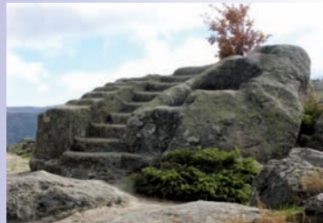
Ulaca. Altar de sacrificios