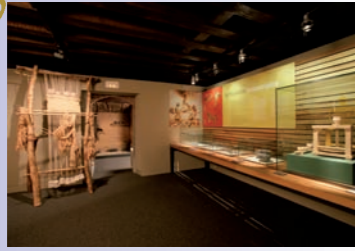
Centro de Interpretación de la Cultura Véttona