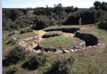
La Mesa de Miranda. Tumbas monumentales