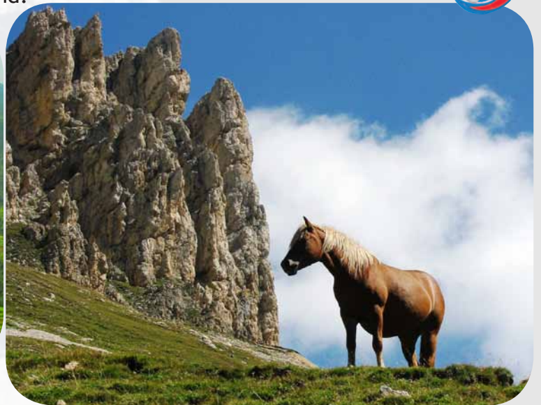
Abb. 117.3–4: Gunst- und Ungunsträume 2

Beispiel Gebirge auf 1 600 m Seehöhe: intensive Landnutzung mit Reisterrassen in Südchina (links) und karge Vegetation in den Alpen (rechts). In der gemäßigten Zone reichen die Möglichkeiten der Landnutzung nicht in so große Höhen wie in den Tropen und Subtropen.