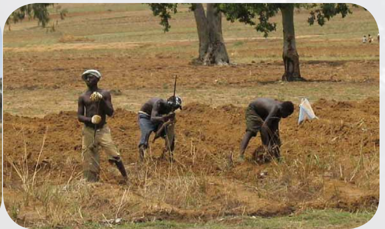
Abb. 118.5–6: Gunst- und Ungunsträume 6

Beispiel Ackerbau: Landwirtschaft mit Maschinen in einem reichen Industrieland und Bestellung des Feldes in einem tropischen Land Afrikas. Reiche Länder haben die Möglichkeit, mit Geld und Technik Leben und Wirtschaften auch in ungünstigen Gebieten zu ermöglichen oder zu verbessern.