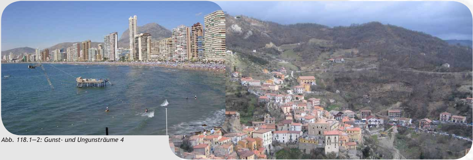
Abb. 118.1–2: Gunst- und Ungunsträume 4

Beispiel Meeresküste: Badeorte am Meer und Landleben 20 km hinter der Küste. Der Tourismus schafft Arbeitsplätze. Hotels, Appartements und Restaurants werden gebaut, die Grundstückspreise steigen. Im landwirtschaftlich geprägten Hinterland leben Kleinbauern/bäuerinnen in bescheidenen Verhältnissen.