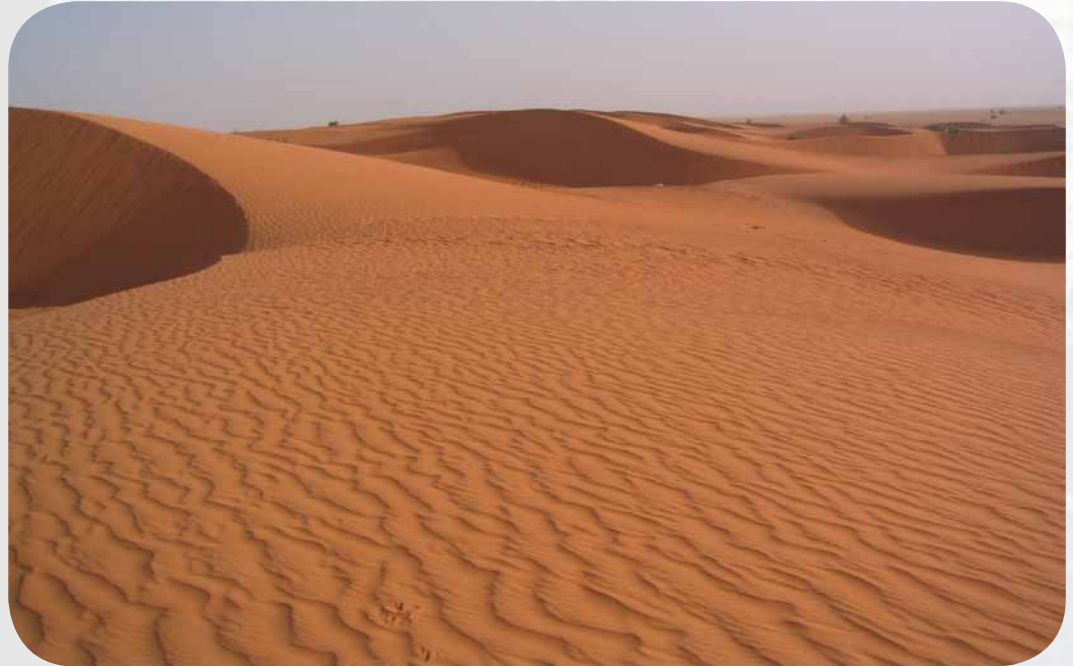
Abb. 116.2: Ein Ungunstraum

In manchen Teilen der Welt herrschen von Natur aus lebensfeindliche Bedingungen. Extremes Klima, schlechte Böden, wenig oder zuviel Wasser, steiles Gelände, schlechte Verkehrerschließung erschweren Leben und Wirtschaften in diesen Gebieten. Man bezeichnet sie deshalb als Ungunsträume . Sie sind meist nur dünn besiedelt.