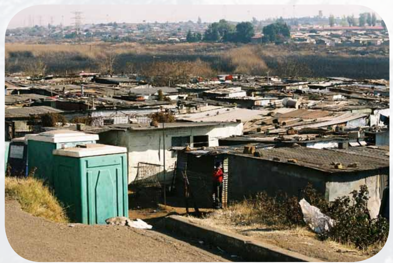
Abb. 118.3–4: Gunst- und Ungunsträume 5

Beispiel Stadtrand: Leben in der Millionenstadt Toronto (links) und in einem Elendsviertel einer südafrikanischen Großstadt (rechts). Städte wachsen. Die Zugewanderten bringen einmal Geld, Beruf und Bildung, das andere Mal oft nichts als die Hoffnung auf ein besseres Leben mit.