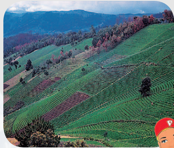
Abb. 117.1–2: Gunst- und Ungunsträume 1

Beispiel Tropen: wenig besiedelter Regenwald im Tiefland (links) und intensiv genutztes tropisches Hochland in Guatemala mit schmalen Terrassen für den Anbau von Mais (rechts). Die Höhenlage ist entscheidend.