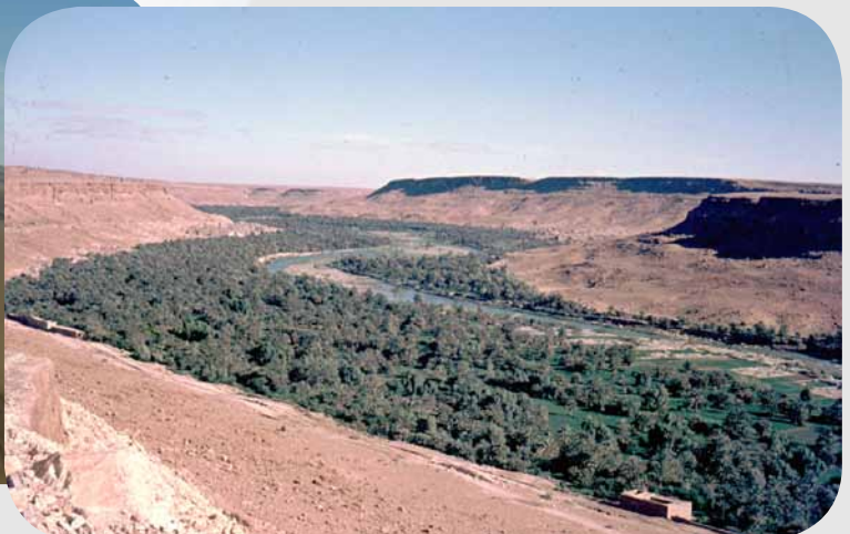
Abb. 117.5–6: Gunst- und Ungunsträume 3

Beispiel Wüste: Endlose Meere aus Sand (links) und Flussoase (rechts). Die Wüsten sind im Vormarsch. Sie erobern Oasen und breiten sich in die angrenzenden Zonen aus. Ursache dafür sind Dürreperioden und die Übernutzung der Steppen und Savannen durch den Menschen und seine Tiere.