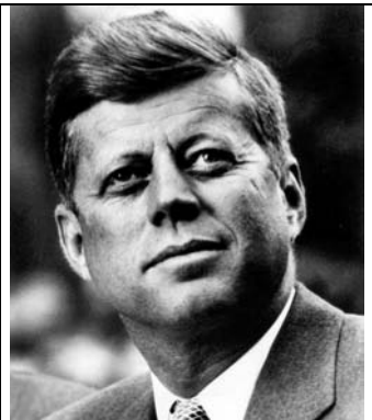
John F. Kennedy Präsident von 1961 bis 1963