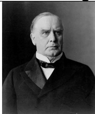
William McKinley Präsident von 1897 bis 1901