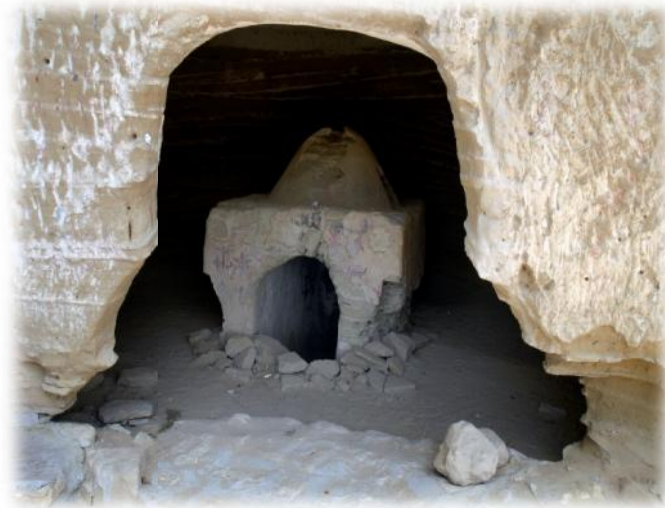
شکل ۱: تصویری از معبد بان مسیتی

در دامنه کوه شهباز بند، حدود ۲۵ متر بالاتر از زمین، دو غار مصنوعی و یک غار طبیعی در کنار هم قرار دارند که این سه غار (غار بان مسیتی یا غار مقدس، غار زائران، غار پناهگاه) را در زبان مردم بومی تیس (بان مسیتی) گویند به نظر می‌آید که این غارها، در زمره یک واحد تأسیساتی و ساختمانی بوده و به منزله توقف‌گاه‌های معبد یا مذبح یا پرستشگاه بوده‌است که سکویی برای انجام اعمال مذهبی یا تشریفات دیگر در سراسر پهنه جلوی هر سه غار ساخته بوده‌اند. تصویر زیر یکی از غارهای سه گانه را نشان می‌دهد (طرح گردشگری روستای تیس: ۱۳۸).