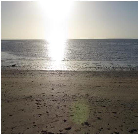
شکل ۵: نمای از پلاژ ساحلی روستای تیس