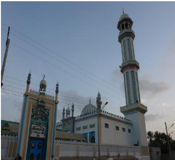
شکل ۳: نمای از معماری منحصر به فرد مسجد جامع روستای تیس

بنای اولیه مسجد جامع تیس یا مسجد طویی به صدر اسلام بر می گردد. این مسجد قدیمی به مسجد تک مناره نیز معروف می باشد سبک معماری و تزئینات داخلی آن همانند مساجد کشور اسلامی پاکستان می باشد این مسجد نمایی کاملاً سنتی دارد و شبیه مساجد اهل تسنن کشور هند و پاکستان ساخته شده است ( http://miras-chabahar.blogfa.com ). وقتی وارد این مسجد می شوی برای لحظه ای فکر می کنی که در مکان های مقدس احمدآباد هندوستان و شهرهای جنوبی پاکستان ایستاده ای با همان معماری قدیمی ای که به نوعی خاص تمام رنگ ها را در درون خود جای داده است. مناره و گنبد های سفید که با رنگ های قرمز و سبز به شکل های مختلف تزئین شده، درهایی که بی محابا در آن شیشه های الوان به کار رفته است. این تمام شکل ظاهری مسجد تیس است که به هر طرف آن نگاه می کنی می بینی که در معماری آن رنگ حرف اول را می زند.