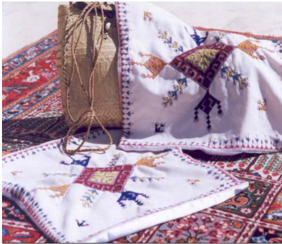
شکل ۷: نمای از صنایع دستی روستای تیس