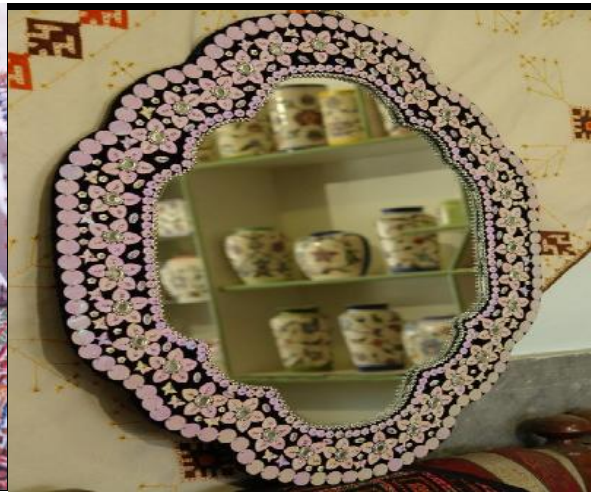
شکل ۶: نمونه ای از سکه دوزی