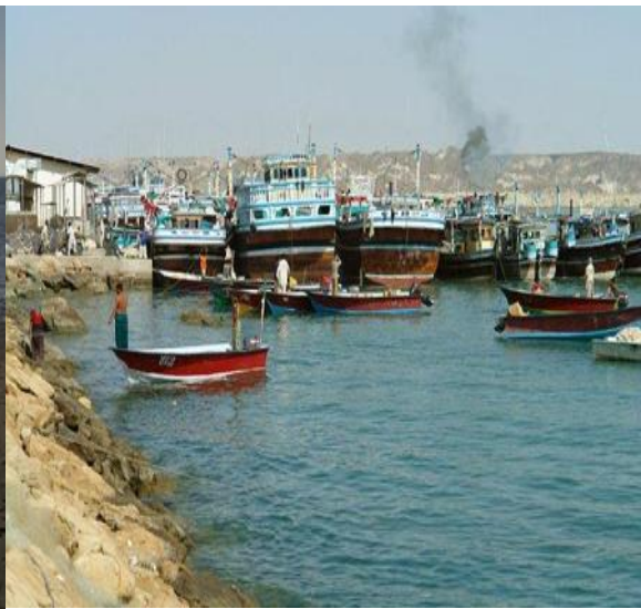
شکل ۴: نمای از اسکله صیادی تیس