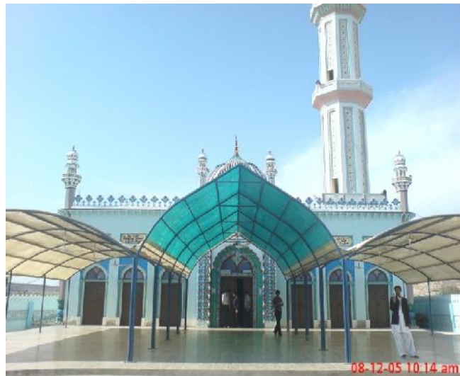
شکل ۲: نمای از مسجد جامع زیبای تیس