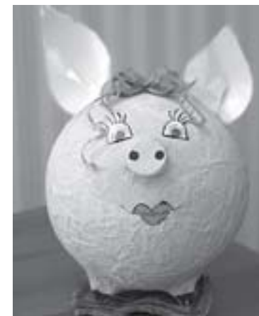
На фото: игрушка, изготовленная руками детей.

го века, и первый взгляд на них рождает отнюдь не радостное настроение. Но как ни странно, многие дети буквально прикипели к «Березке», не хотят отдыхать в другом месте. Причина? Педагогические работники воспринимают реальность таковой, какая она есть, и программы детского отдыха составляют в соответствии с этим. Взять ту же зимнюю смену, которая длилась с 29 декабря по 10 января. Ежедневно дети первую половину дня были на улице, катались на горке, веселились (как уже было сказано, под присмотром врачей), а вторую проводили в столовой, оборудованной как небольшой театр. Программа ка-