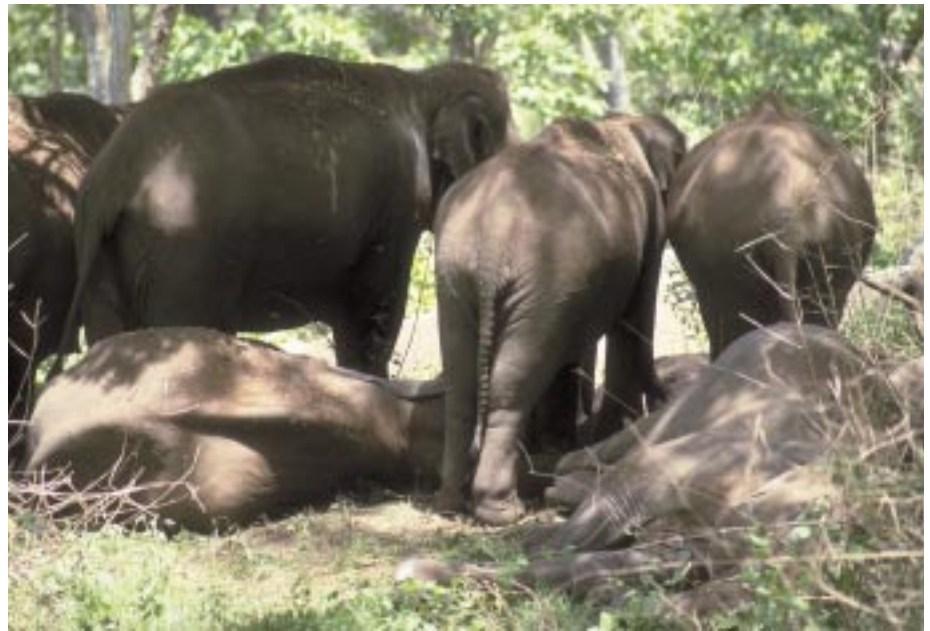
Abb. 6: Mittags ruhen wilde Elefanten im Schatten und Jungtiere legen sich hin. Mudumalai, Tamil Nadu, Südindien. Wild elephants rest at noon in the shade and young ones lay down. Mudumalai, Tamil Nadu, South India.

Obwohl wilde Elefanten viel Zeit mit Nahrungssuche und Fressen verbringen, kennen sie noch andere Aktivitäten. Die wichtigsten ethologischen Funktionskreise ihres Verhaltensmusters sind Sozialverhalten, Fortpflanzung, Ruhen, Entdecken, Fressen und Spielen. Diese grobe Unterteilung kann je nach Fragestellung verfeinert werden. Sozialverhalten lässt sich auf-