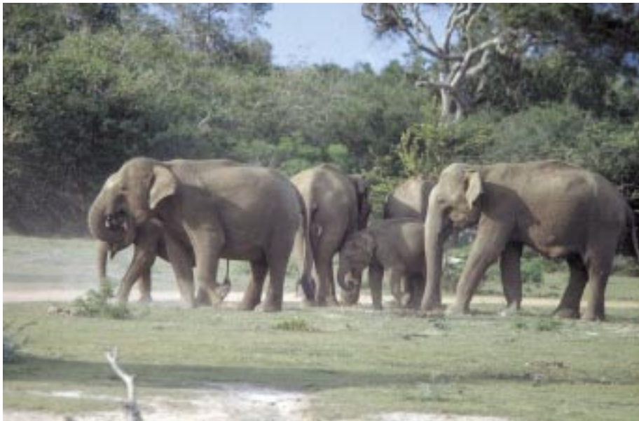
Abb. 8: Junge Elefanten müssen die effektiven Methoden zur Futtersuche, z.B. Abtrennen und Putzen von „Kurzgras“ lernen. Ruhuna Nationalpark, Sri Lanka. Young elephants have to learn the most effective methods to prepare food plants, as e.g. short grasses. Ruhuna National Park, Sri Lanka.

obwohl sie nachts ungefähr sechs Stunden lang schlafen (WYATT & ELTRINGHAM, 1974; TOBLER, 1992). Deshalb kann es für sie sehr frustrierend sein, wenn sie angebunden oder isoliert werden. WYATT & ELTRINGHAM (1974) wiesen nach, dass Afrikanische Elefanten in Uganda drei Gipfel der Fressaktivität haben, am frühen Morgen, späten Nachmittag und um Mitternacht. Ihre Hauptschlafzeiten finden nach Mitternacht statt, während sie nach der Abenddämmerung meist gehen.