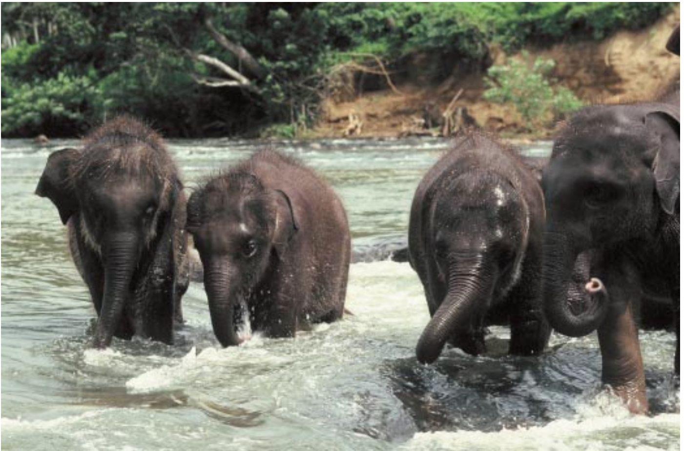
Abb. 3: Jungtiere bilden Untergruppen. Pinnawela Elephant Orphanage, Sri Lanka. Young elephants form sub groups. Pinnawela Elephant Orphanage, Sri Lanka.