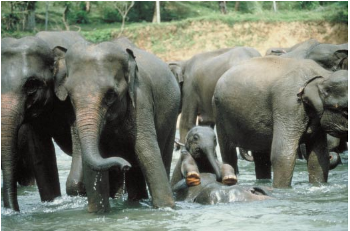
Abb. 2: Jungtiere halten sich im Zentrum des Verbandes auf. Pinnawela Elephant Orphanage, Sri Lanka. Young elephants stay in the centre of the groups. Pinnawela Elephant Orphanage, Sri Lanka.