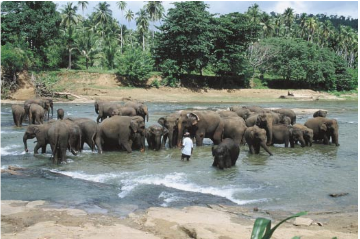
Abb. 1: Die Herde in der Pinnawela Elephant Orphanage auf Sri Lanka setzt sich aus verschiedenen Alters- und Geschlechterklassen zusammen. The herd of the Pinnawela Elephant Orphanage in Sri Lanka consists of different age and sex classes.