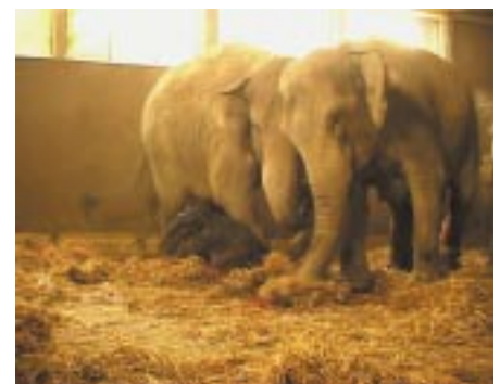
Abb. 7: In modernen Zoos, wie hier im Tierpark Hagenbeck, Hamburg, erfolgen die Geburten in Gruppen von kettenfrei gehaltenen Weibchen. In modern zoos, as e.g. the Tierpark Hagenbeck in Hamburg, parturition takes place in the presence of several unchained females.

Viele Zoos binden ihre Elefanten nachts an Ketten oder halten sie in Einzelboxen und nur wenige erlauben ihnen freien Zugang zu den Gehegen während 24 Stunden. Möglicherweise sind Elefanten aber nachts aktiver,