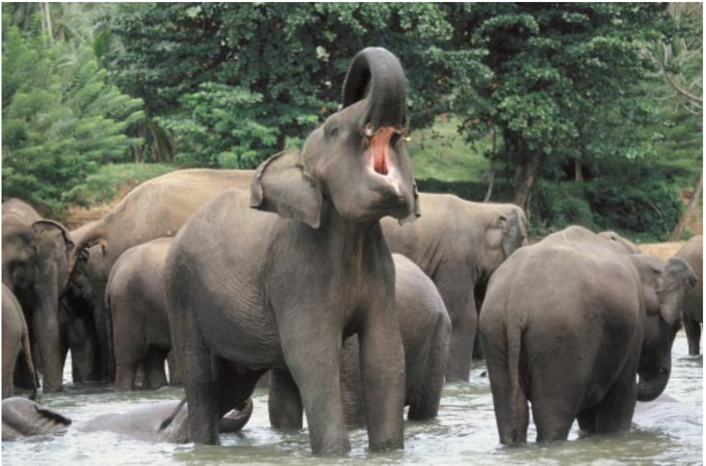
Abb. 4: Körperpflege gehört zum Alltag der Asiatischen Elefanten. Pinnawela Elephant Orphanage, Sri Lanka. Skin care belongs to the daily routine of Asian elephants. Pinnawela Elephant Orphanage, Sri Lanka.