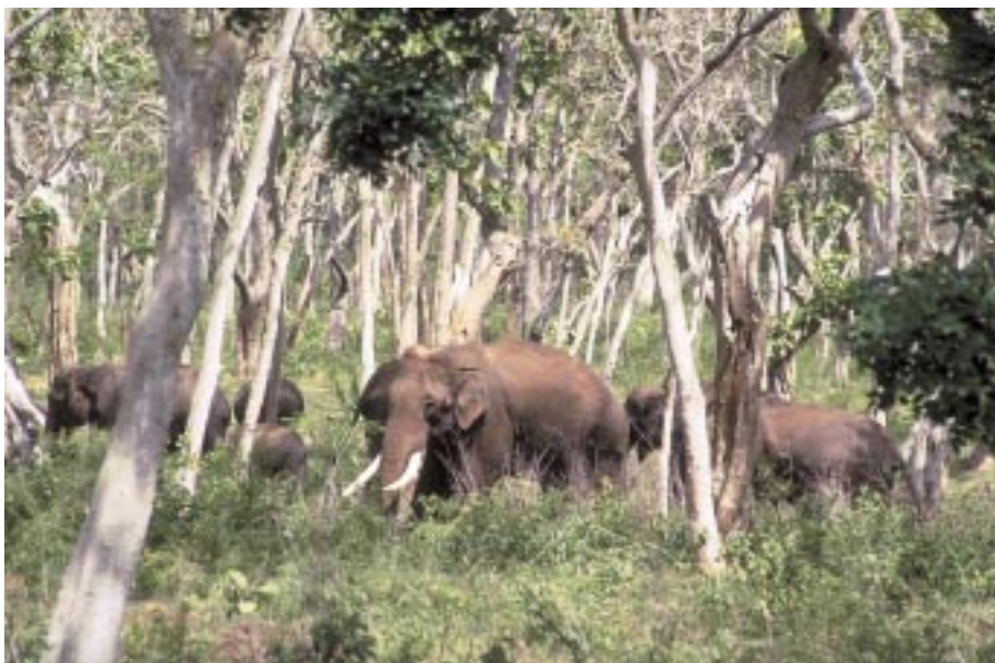
Abb. 9: Musth-Bullen sind sozial extrem aktiv und halten sich häufig in Weibchen-Jungtier-Gruppen auf. Mudumalai, Tamil Nadu, Südindien. Musth bulls are extremely social and are often found in groups of females and offspring. Mudumala, Tamil Nadu, South India.

Das bedeutet, dass Zooelefanten die Möglichkeit der Wahl haben müssen, wie sie ihr Aktivitätsmuster während des 24-Stunden-Tages auslegen wollen. Deshalb müssen sie auch nachts Futter erhalten, besonders stillende Mütter, die viel Nahrung und Ruhe brauchen und frei entscheiden sollten, wann. Bei wilden Elefanten entlasten Tanten die Mutter (Abb. 6). So gesehen, ist Einzelhaltung während der Nacht schädlich für die Mutter, wenn sie mit ihrem Säugling allein gelassen wird. Es sei denn, das