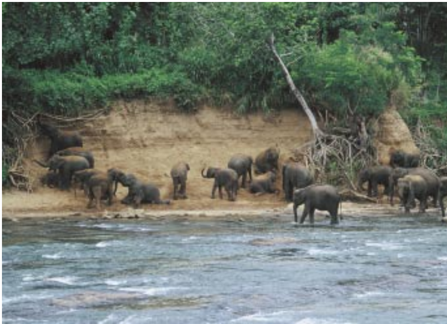
Abb. 5: Sandbaden und Körperscheuern sind wichtig für die Hautpflege. Pinnawela Elephant Orphanage, Sri Lanka. Sand bathing and body scratching are important for skin care. Pinnawela Elephant Orphanage, Sri Lanka.

Musthperioden durch Konkurrenz zwischen erwachsenen Bullen. Dabei unterdrücken ältere Bullen mit bereits etablierten Musthperioden jüngere (POOLE, 1987 & 1989; KURT & TOUMA, 2001). So gesehen kann Musth reguliert werden und Weibchen haben die Möglichkeit, einen Fortpflanzungspartner auszuwählen. Bullen sind offenbar auf das Vorkommen fortpflanzungsfähiger Weibchen angewiesen. Wenn diese nicht in genügender Zahl vorkommen, können Bullen ihre Angriffslust erhöhen, wie Beispiele aus einigen kleineren Reservaten in Südafrika deutlich machen. In ihnen leben normalerweise lediglich ein Weibchen-Jungtier-Verband und zwischen einem bis drei Bullen. Diese sind zu bestimmten Zeiten aggressiver und/oder neigen dazu, entlang der Einzäunungen zu patrouillieren oder gar auszubrechen, wobei weder die Ausbruchversuche noch die erhöhte Kampfbereitschaft mit Nahrungskonkurrenz zu korrelieren scheinen. So lässt sich vermuten, dass sie einem natürlichen Fortpflanzungsdrang folgend der Suche weiterer Weibchen-gruppen gelten.