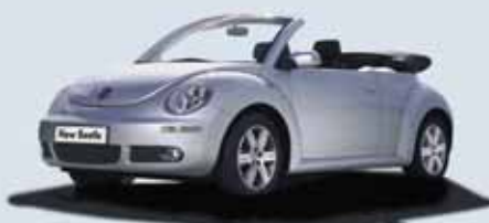
New Beetle Cabrio