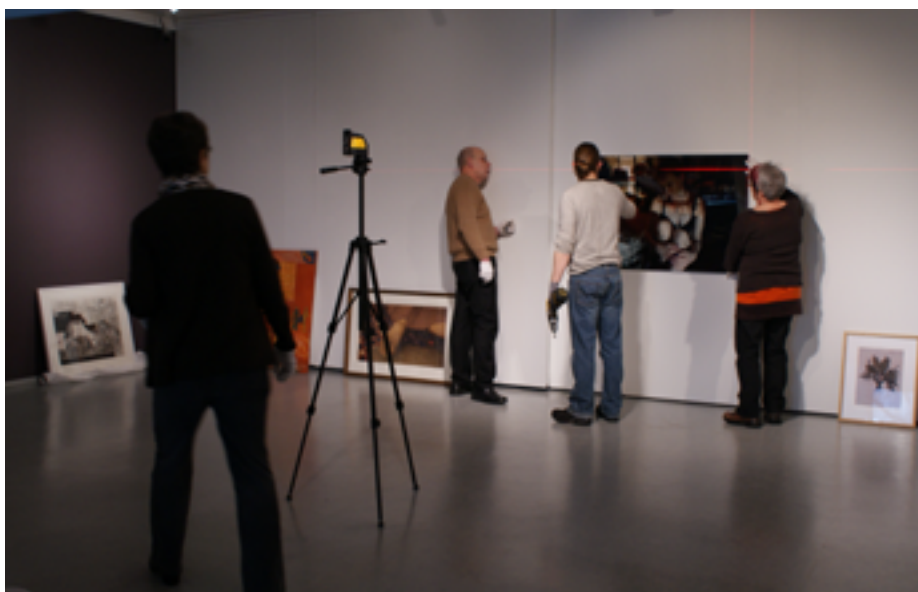
Ripustaminen on tarkkaa puuhaa.