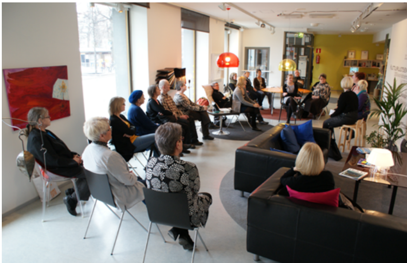
Museolehtorit kertovat työstään Teemahetkessä 28.3. 2012.

Eräs luotsattavista ehdotti, että saisi arvata luotsin mieliteoksen näyttelystä, kun luotsi kertoi, että näyttelyyn oli valittu luotsien suosikkiteoksia. Luotsin yllätykseksi näyttelykierroksen lopussa luotsattava olikin sitten