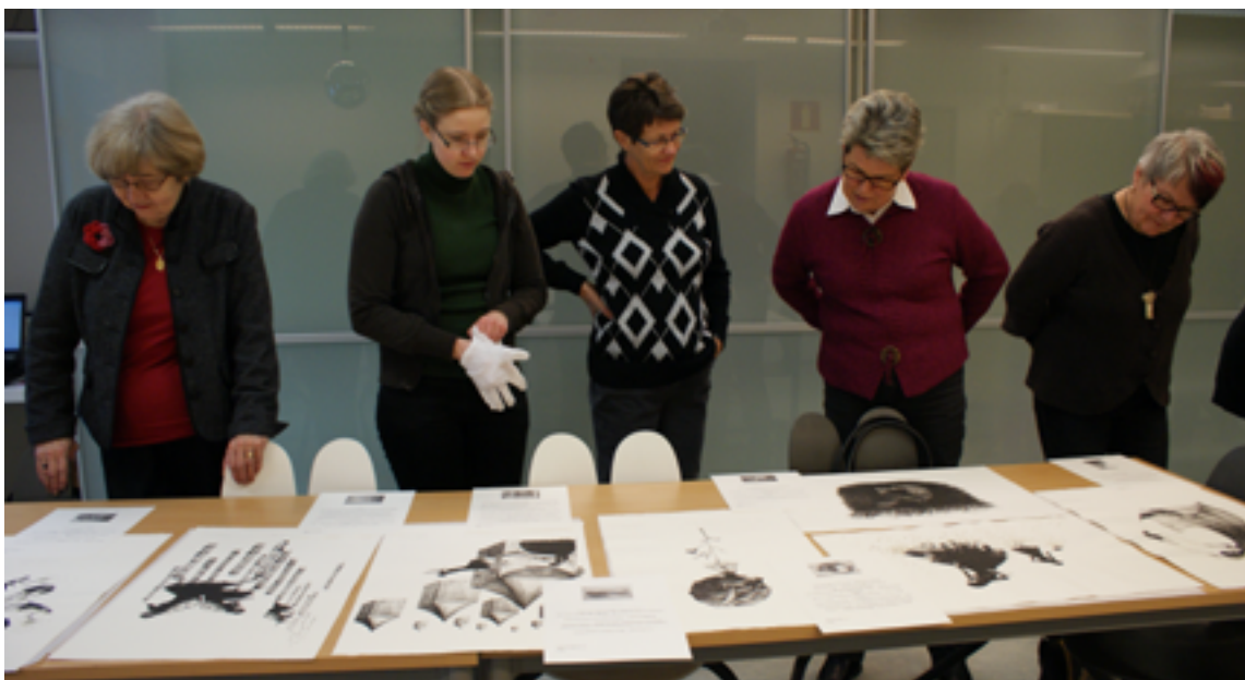
Veronique La Perrierin vedokset herättivät uteliaisuuden.

Hanne Laitinen kulttuuriluotsikoordinaattori