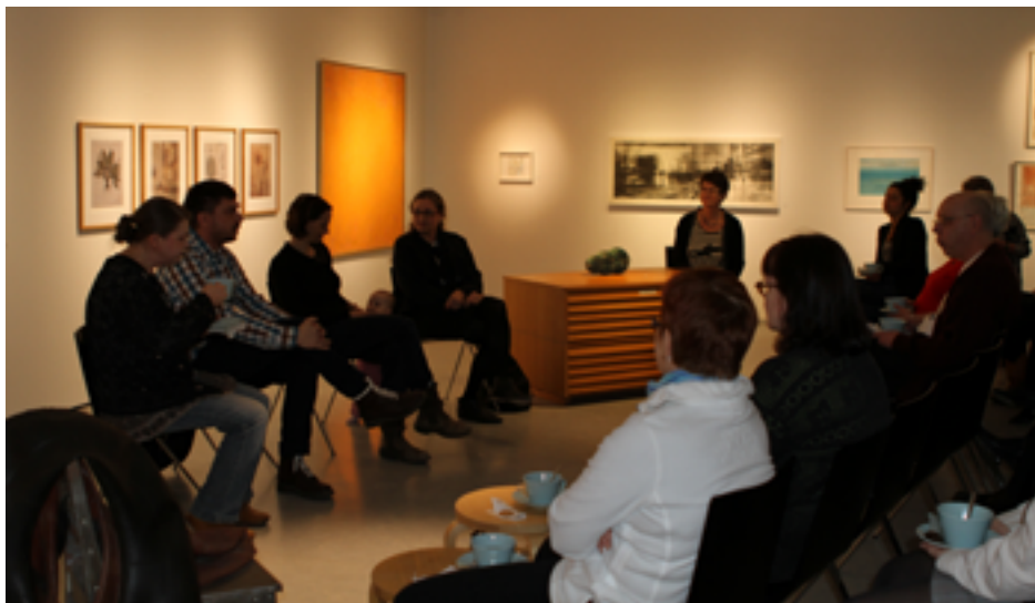
Taiteilijat Teehetkessä 13.04.2012.