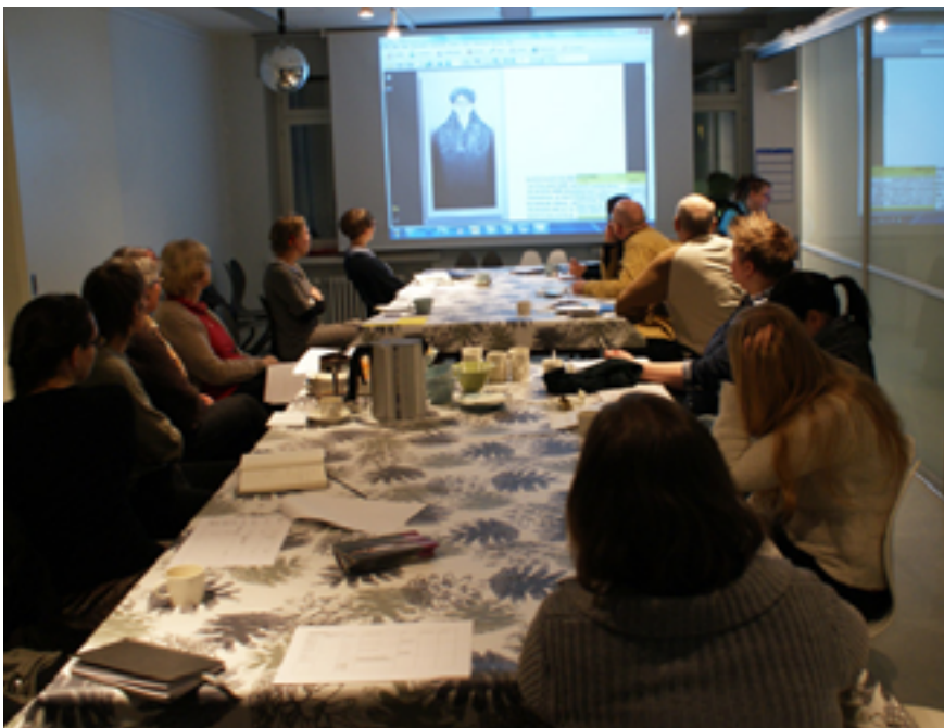
Taiteenkuluttajat teoksia valitsemassa.

Nettikeskustelussa meitä kannustettiin valitsemaan näyttelyyn teoksia, joilla on sanottavaa ja jotka puhuttelevat luotseja. Toisena lähtökohtana oli ajatus, että valitaan luotsien mieliteoksia kuitenkin ottaen huomioon eri valmistustekniikat: grafiikassa puupiirros, syväpaino ja litografia, akvarelli, öljy- ja akryylimaalaukset sekä video- ja käsitäide. Sillisalaattiajattelu teosten valinnassa oli saanut alkunsa.