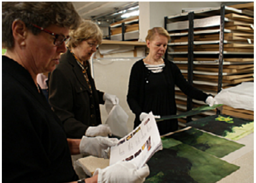
Teoksia tutkimassa.

Sijoitustoiminnan ansiosta kokoelmateokset ovat useiden ihmisten nähtävillä. Teokset tuovat yksiköiden tiloihin