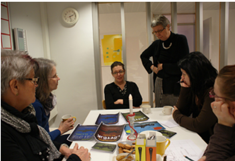
Julisteen suunnittelupalaveri.