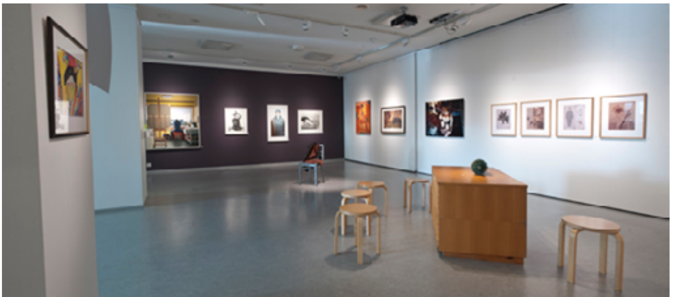
Kulttuuriluotsien löytöjä -näyttely Jyväskylän taidemuseon galleriassa.

Päivimarjut Raippalinnalla museotoimenjohtaja