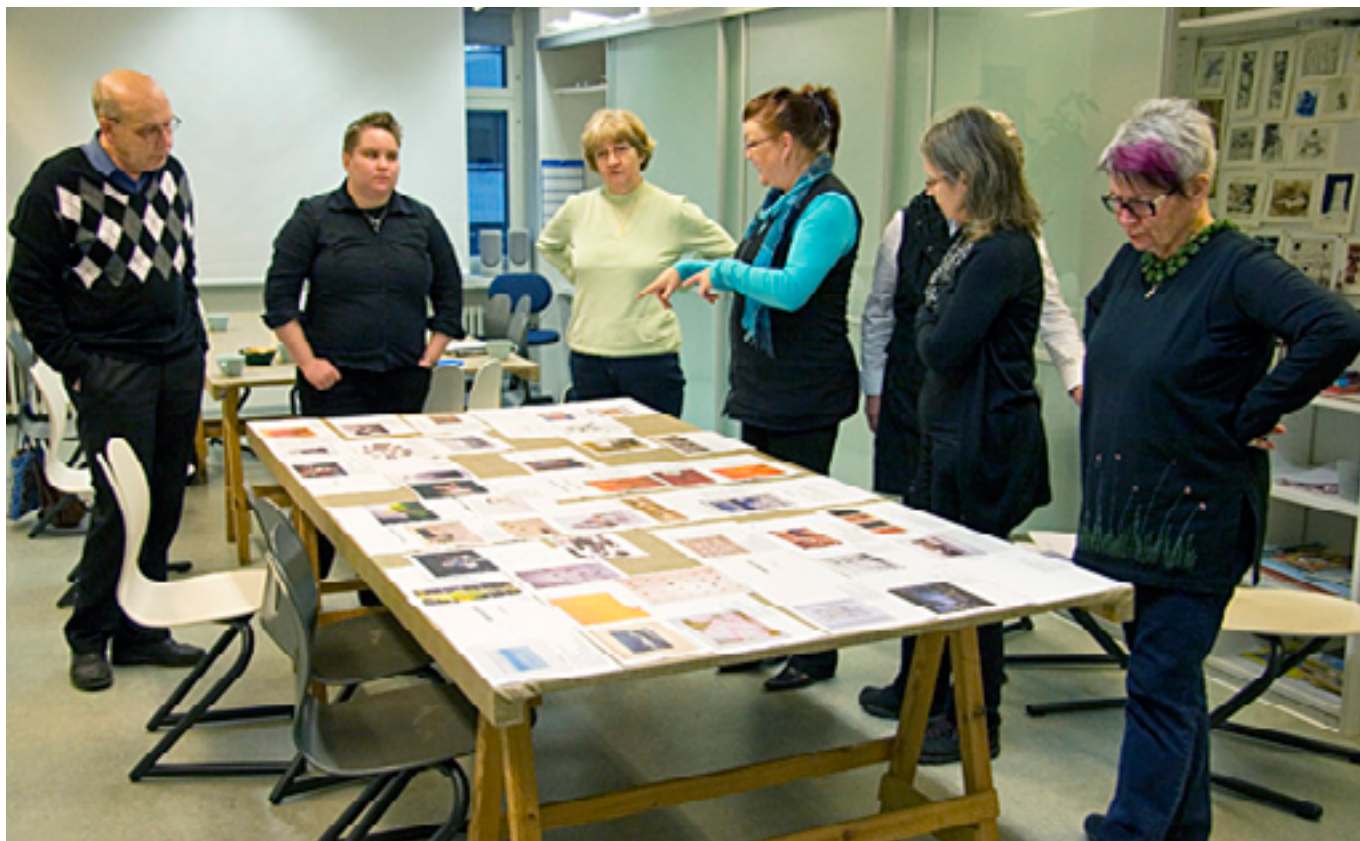
Näyttelyprosessi – teemojen tarkastelua.

”Jyväskylän museot luovat kansalaisille mahdollisuuksia osallistua taiteeseen, kulttuuriin ja museotyöhön. Omaehtoisen toiminnan tukeminen pohjautuu sosiokulttuurisen innostamisen periaatteelle. Kokemukselliseen oppimiseen perustuva työpajatoiminta, keskusteluopastukset ja -tilaisuudet, toiminnalliset tuokiot, prosessidraama sekä taiteiden väliset menetelmät luovat yleisölle mahdollisuuden osallistua. Museot antavat koulutusta kulttuuriluotseille ja muille vapaaehtoisille sekä toteuttavat heidän kanssaan erilaisia projekteja, tapahtumia ja tilaisuuksia.”