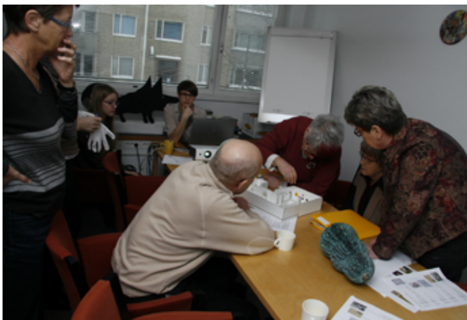
Ripustussuunnitelman kimpussa.

Näyttely alkoi elää omaa elämäänsä ”piskipaitojen” nauttiessa työn tuloksista ja monista mielenkiintoisista, rikkauttavista ja yllättävistä keskusteluista kävijöiden kanssa perjantaiporinoissa ja luotsaustilanteissa sekä museon ja luotsien järjestämissä teema- ja tehetkissä.