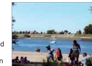
Ebbe und Flut am Stover Strand – fast wie an der See

...dass die Nordsee mit Ebbe und Flut bis an das Wehr zwischen Rönne und Geesthacht massiven Einfluss hat?