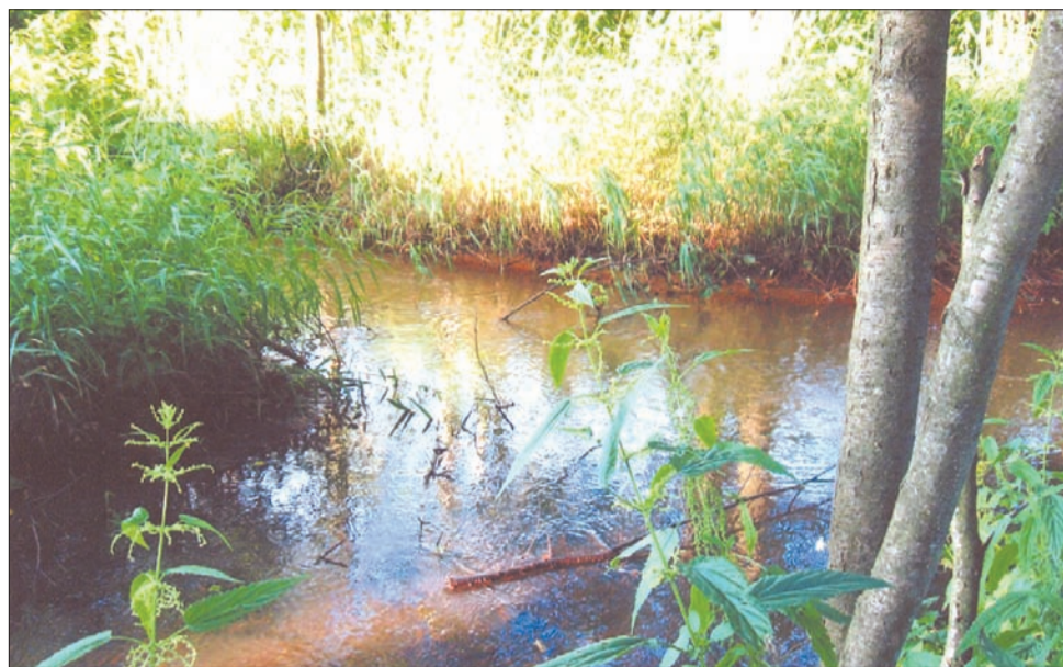
► Экспедиция по малым рекам

Бывает, Лавровка выходит из берегов, подтопляя значительную территорию до карьера. Но почему-то не впадает в него, а образует открытое затопленное пространство, поросшее корявым ивняком, осинником и чахлым березняком. Кстати, возведенные плотины – выпуклые,