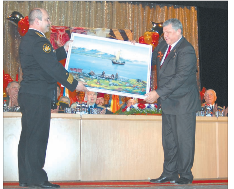
Подарок от моряков Северного флота