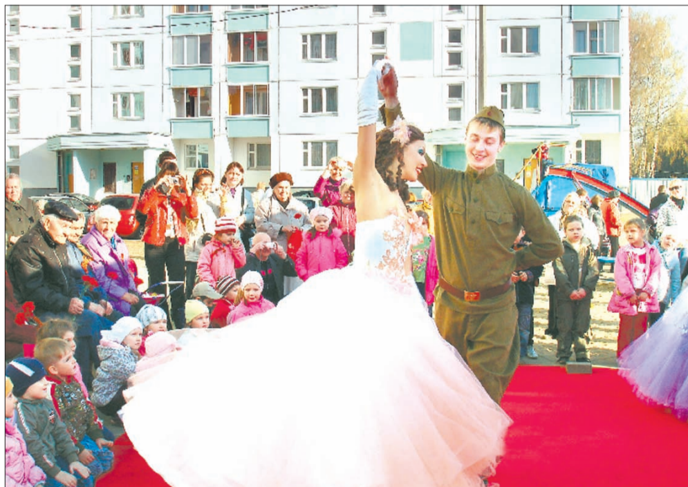
Концерт понравился всем