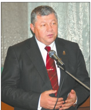
Глава района тепло пообщался с ребятами