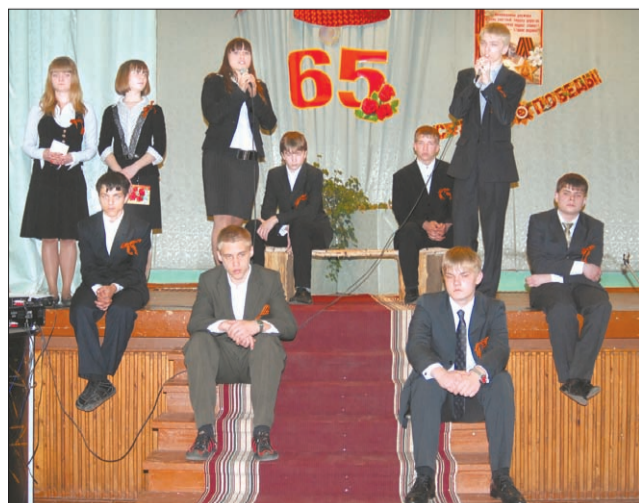
Сценка из спектакля