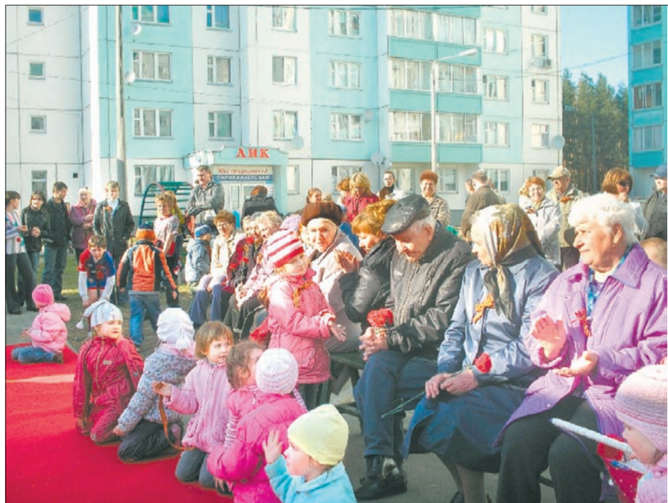
Малыши тоже радовались празднику