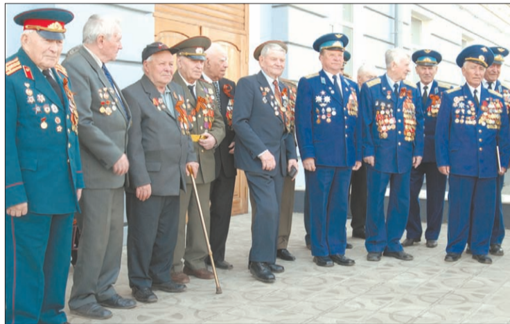
Ветераны снова в строю