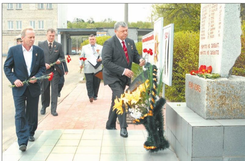
Возложение цветов к обелиску