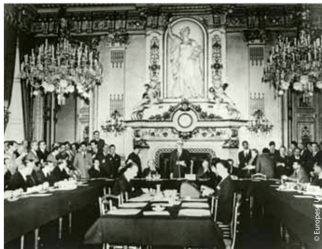
Schuman houdt zijn beroemde toespraak op 9 mei 1950, de dag die nu wordt gevierd als de verjaardag van de EU.

Schumans inzet ging echter nog verder. Hij werd een groot voorstander van verdere integratie door middel van een Europese defensiegemeenschap en werd in 1958 de eerste voorzitter van de voorloper van het huidige Europees Parlement. Toen hij zijn werkzaamheden neerlegde, verleende het Parlement hem de titel van “Vader van Europa”. Vanwege het enorme belang van