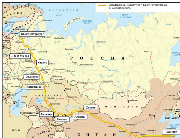
Проект «Международный транспортный коридор «Европа-Западный Китай»

Окончание статьи в Сборнике «Евразийская экономическая интеграция: достижения и проблемы»