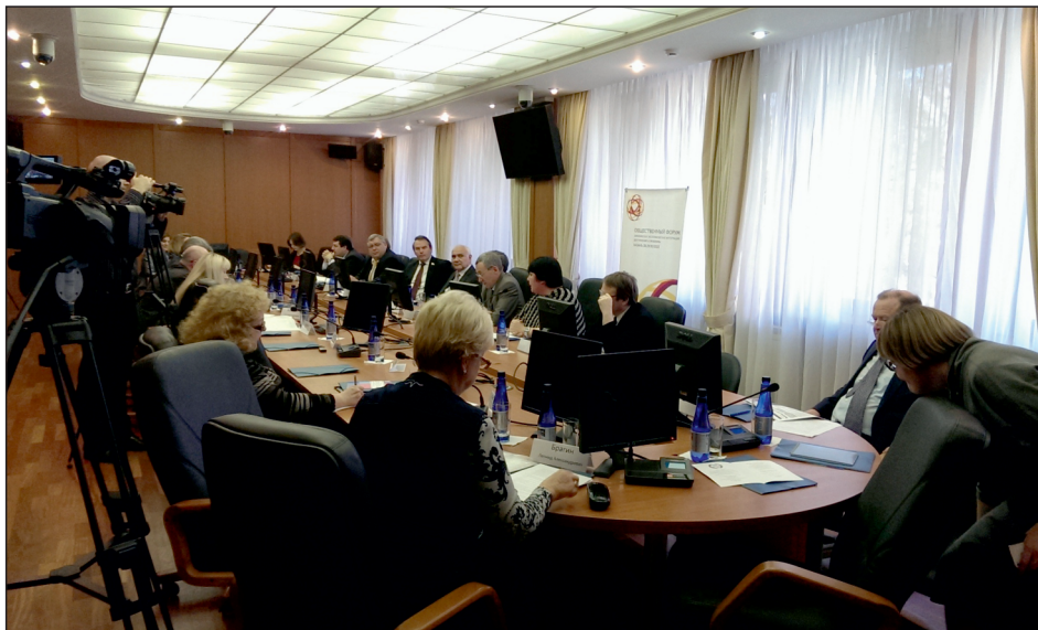
Участники круглого стола

Одним из этапов подготовки к Общественному форуму «Евразийская экономическая интеграция: достижения и проблемы», запланированному на 28-29 ноября 2013 года в Казани, был круглый стол в Российском экономическом университете им. Плеханова, состоявшийся ровно за месяц до форума – 29 октября 2013 года.