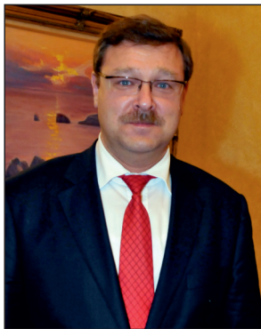
К. КОСАЧЕВ, руководитель Россотрудничества

Дорогие друзья! Прежде всего, воодушевляет сам факт, что последовательно продолжается глубокое теоретическое освоение этой проблематики. Ведь аналитическая – научная, экспертная, медийная –