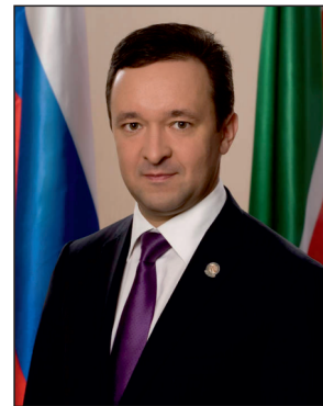
И. ХАЛИКОВ, Премьер-министр Республики Татарстан