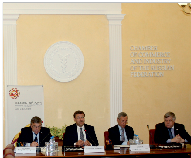
Презентация форума в ТПП РФ, Москва, 18 ноября

тели общественных и политических кругов, бизнеса и молодежи Казахстана для обсуждения достижений и проблем Евразийской экономической интеграции. Представители Казахстана смогут донести итоги обсуждений до всех участников Форума в момент прямого включения. Последним этапом стала Презентация форума в Москве, в здании Торгово-