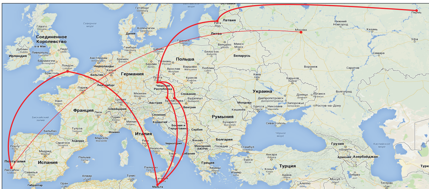
Маршрут фестивального марафона, проходящий через Пермь, Ригу, Прагу, Вену, Братиславу, Валлетту, Лондон и Лиссабон

ОБ АВТОРЕ: Климов Андрей Аркадьевич, 1954 г.р., в настоящее время зампред Комитета по международным делам Совета Федерации РФ, ранее – депутат Госдумы РФ 3,4,5 и 6 созывов, доктор экономических наук, председатель правления Европейского клуба, координатор «Евразийского диалога».