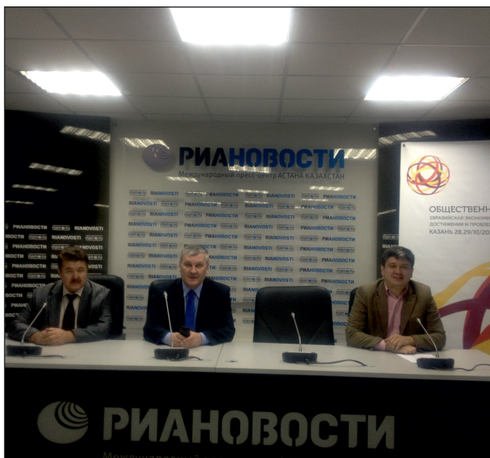
Презентация форума в РИА-Новости, Астана, 13 ноября

«Евразийского диалога», заместитель председателя Комитета по международным делам Совета Федерации А.Климов. Кроме того, в этот же день в Совете Федерации прошёл круглый стол на тему «Геополитические проекты Европейского союза на пространстве Содружества Независимых Государств: пути реализации и возможные последствия». Участники договорились о том, что рекомендации этого круглого стола войдут в итоговые документы общественно-го форума.