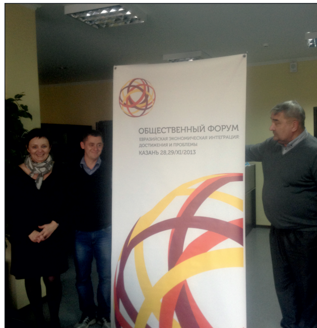
Презентация форума в РЦНК, Минск, 11 ноября

Промышленной палаты РФ. Здесь был показан фильм о форуме, специально снятый телекомпанией VETTA. Для фильма дали интервью российские парламентарии, министр Евразийской экономической комиссии, руководитель Россотрудничества. Сам фильм можно посмотреть на официальном сайте Форума evrazforum.ru Презентацию вели спецпредставитель президента РФ по связям со странами СНГ, руководитель Федерального агентства Россотрудничество» К.Косачев и координатор