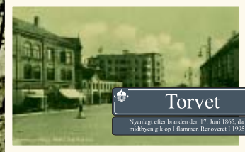
Torvet Nyanlagt efter branden den 17. juni 1865, da hele midtbyen gik op i flammer. Renoveret i 1995.