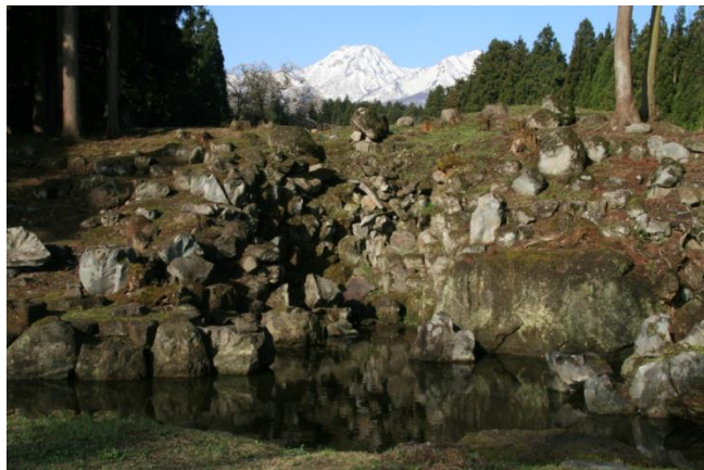
旧関山宝蔵院庭園(妙高市)