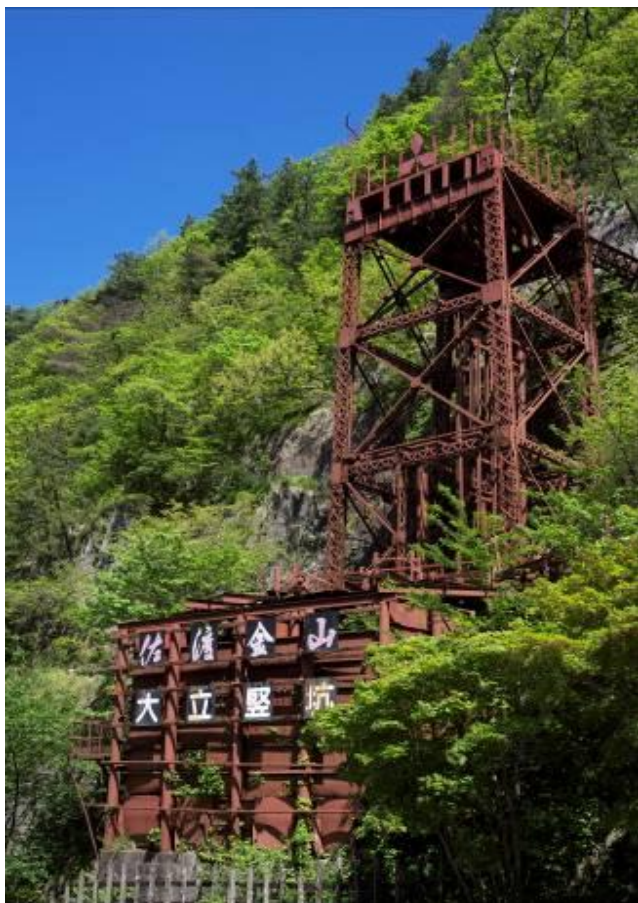
旧佐渡鉱山採鉱施設(佐渡市)