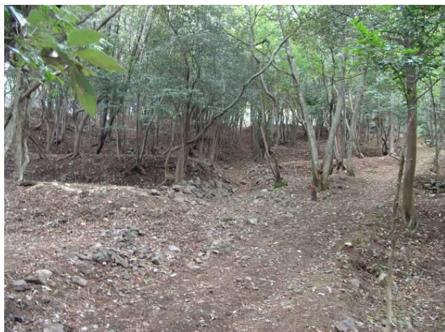
佐渡金銀山遺跡・上相川地区 (佐渡市)